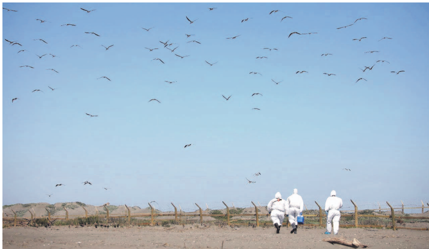
Durante la gripe aviar del 2023, el SAG Coquimbo desplegó 11 brigadas que realizaron muestreos en 5.898 aves.