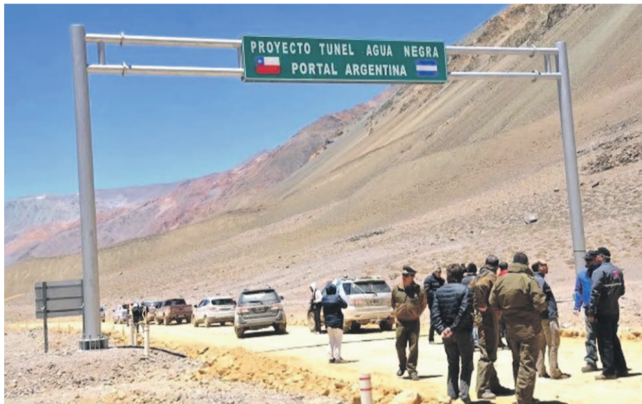
Por el Paso Agua Negra se han registrado cerca de 90 mil controles, de los cuales 50 mil corresponde a ingresos a la zona y otros 40 mil de personas que han salido desde la región.

El complejo fronterizo ha tenido ingresos récord en la temporada 2025, superando las cifras del mismo periodo del año anterior que bordearon las 24 mil personas, hecho que ha sido recibido de buena manera por parte de los sectores productivos. Desde gobierno indicaron que esperan mantenerlo abierto el mayor tiempo posible.