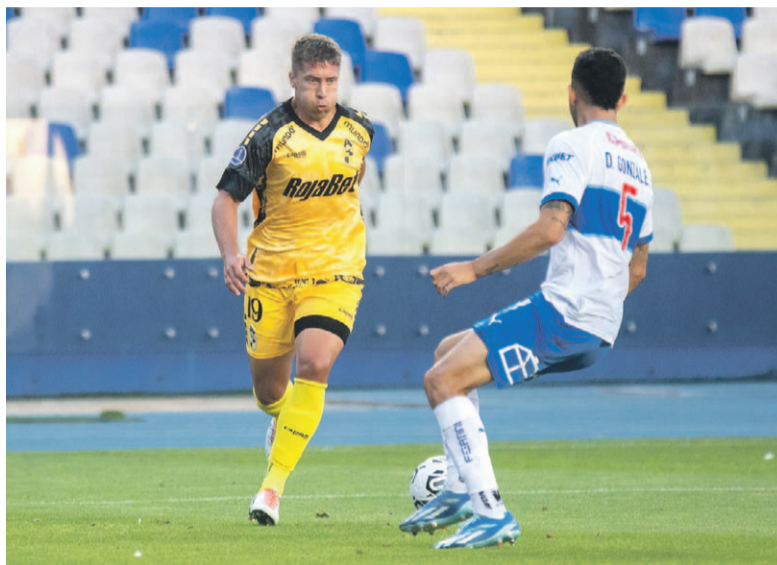
Los piratas dieron cuenta de Iquique en la primera fecha, mientras que la UC, doblegó al Audax Italiano.