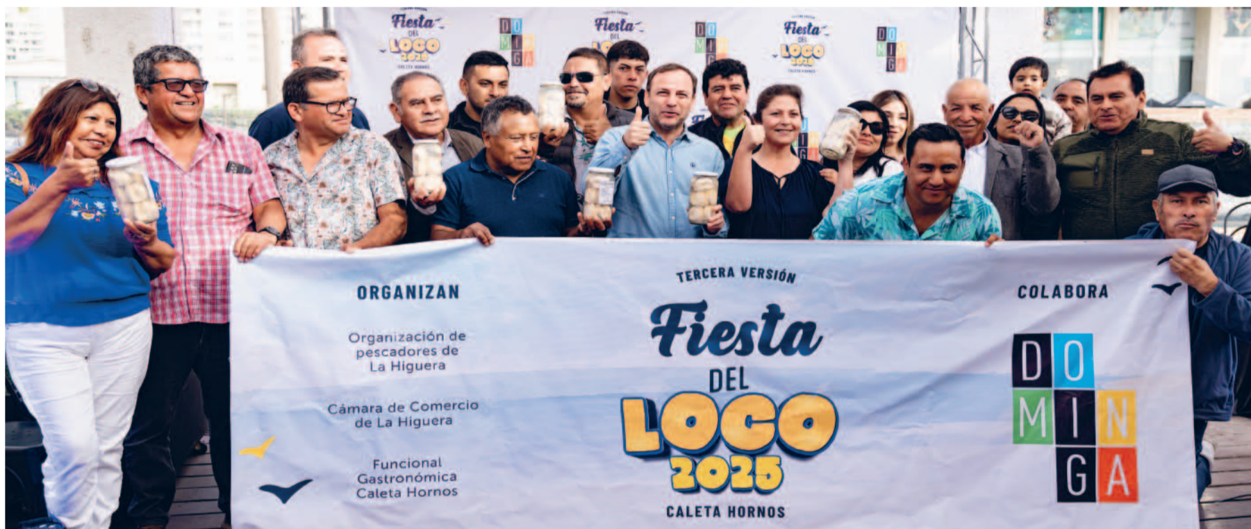
Sindicatos de pescadores de Caleta Hornos; la Cámara de Comercio y Turismo de La Higuera, las organizaciones sociales de la localidad y Dominga, realizaron un exitoso lanzamiento de la fiesta popular que promueve el turismo y la rica gastronomía de esta hermosa caleta.

Más de 5 mil personas se espera que lleguen este domingo 23 de febrero , hasta el sector Muelle de Caleta Hornos , en la comuna de La Higuera y a tan sólo 30 kilómetros al norte de La Serena, a celebrar la tercera versión de la Fiesta del Loco, todo el día, a partir de las 10 hrs.