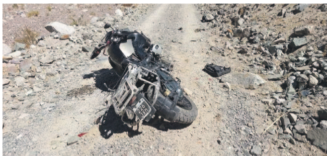
Carabineros tomó el procedimiento del fatal accidente.

Hasta el sitio del suceso llegó personal de enfermería de Juntas del Toro para prestar los primeros auxilios, pero al arribar constataron que la víctima no presentaba signos vitales.