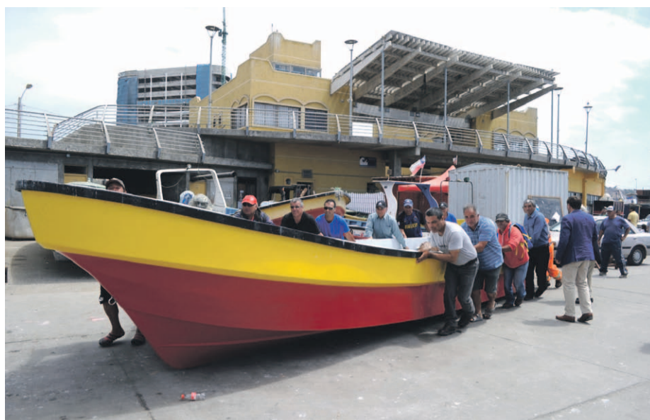
Pescadores, buzos mariscadores y macheros aseguran que trabajan con responsabilidad la extracción de productos del mar.

Asimismo destacaron el trabajo que vienen haciendo desde que se firmó la conciliación ante el Tribunal Ambiental.