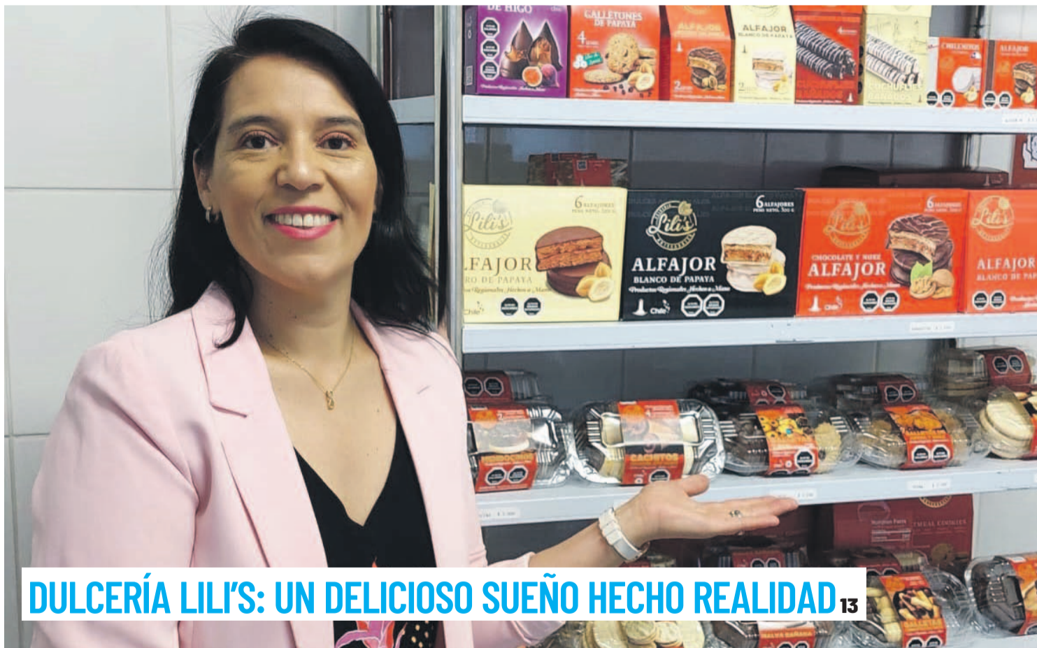
DULCERÍA LILY'S: UN DELICIOSO SUEÑO HECHO REALIDAD 13