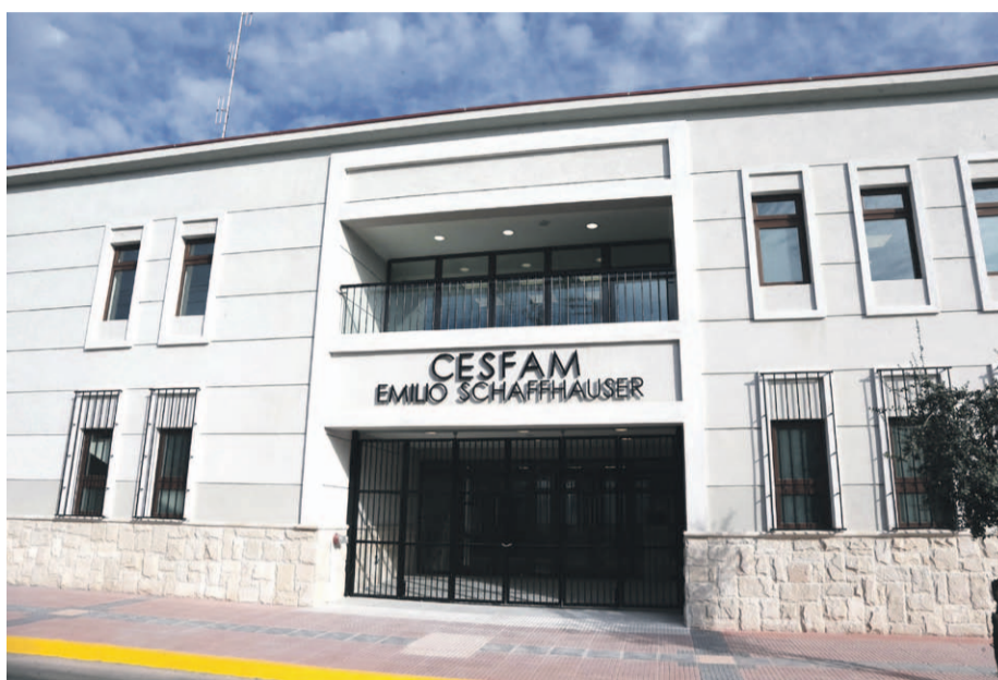
Los usuarios indican que desde el mes de enero se viene repitiendo la falta de medicamentos en varios de los Centros de Salud Familiar (CESFAM) y Centros Comunitarios de Salud Familiar (CECOSF).

Si bien todos los estamentos reconocen que la situación se originó durante la anterior administración municipal, la cual dejó una millonaria deuda con los proveedores, también están conscientes de que los pacientes no pueden esperar por remedios que son vitales para la salud y calidad de vida de los pacientes.