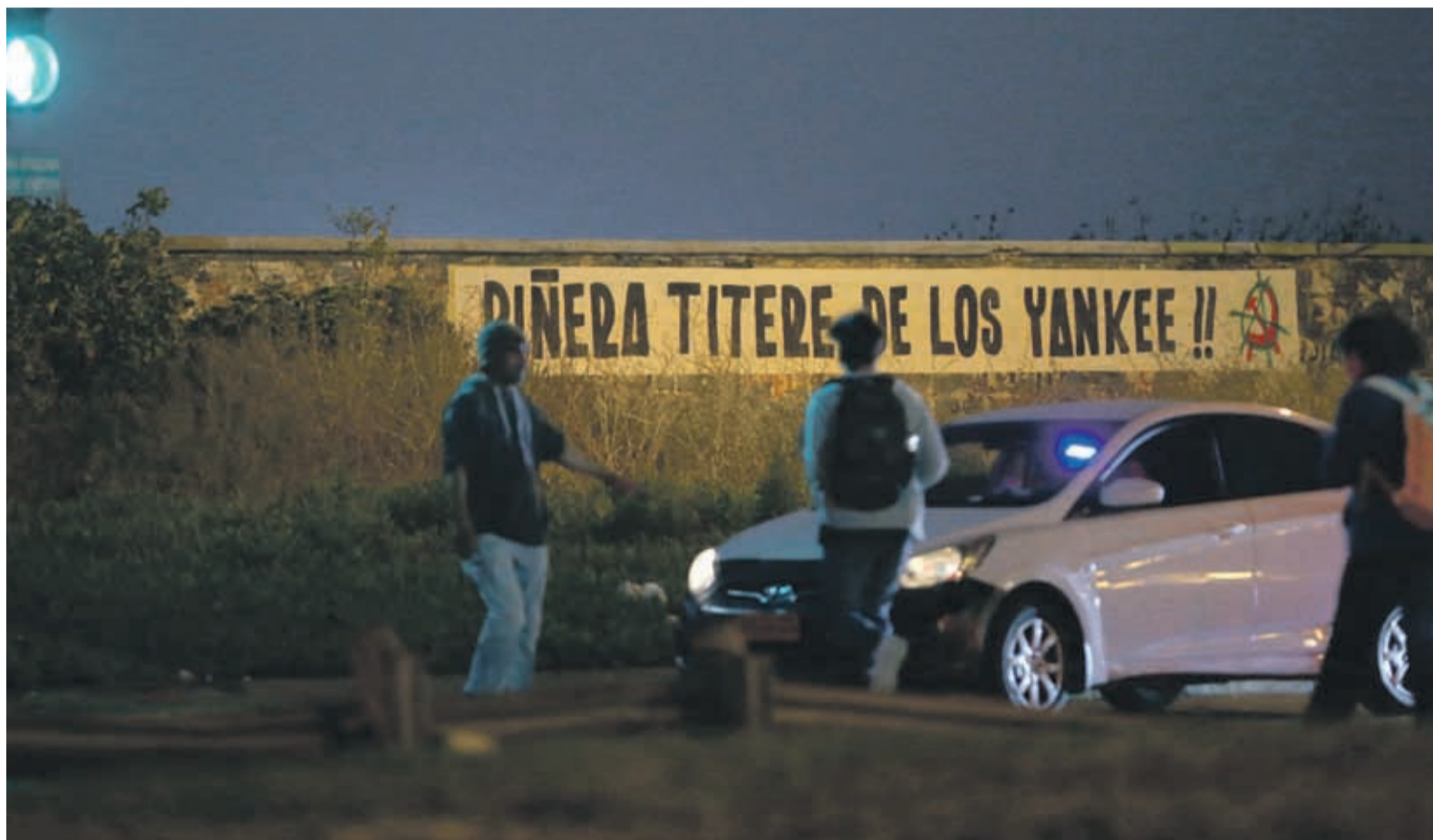
Del otro lado de la línea del tren, muchos consumidores se ocultan para no ser sorprendidos consumiendo. Algunos viven ahí, atrapados en la adicción.

Sujetos buscando clientes en las afueras de los pubs y ofreciéndole la droga a cualquiera. Muchos de ellos camuflados con chalecos reflectantes, simulando ser meros cuidadores de automóviles. También conocimos historias de jóvenes que querían salir del círculo vicioso, pero simplemente se encontraban atrapados, por distintas circunstancias de la vida.