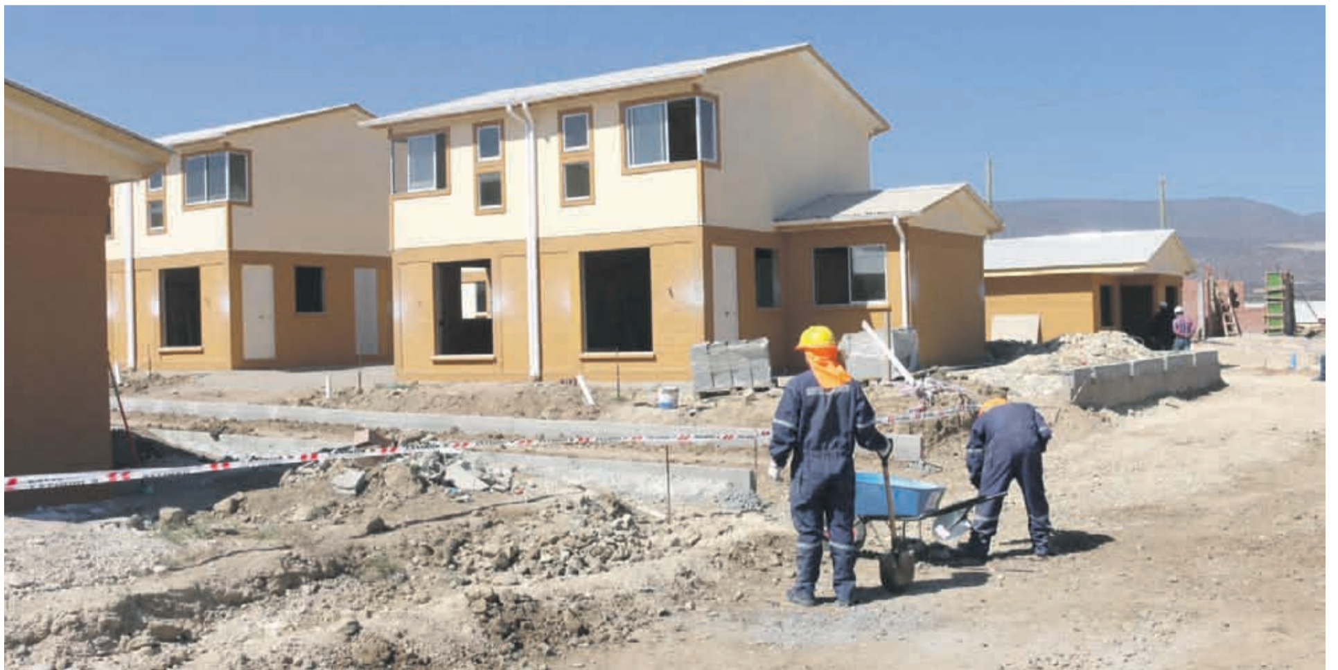
El subsidio DS19 es un nuevo programa Integración Social y Territorial que busca ampliar la oferta de viviendas con subsidio en ciudades con mayor déficit y demanda habitacional, a través de proyectos que incorporen familias vulnerables y de sectores medios