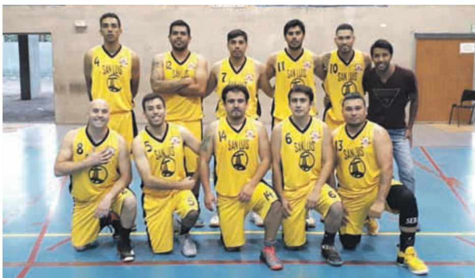
Exalumnos del colegio Adventista, ExCam se quedó con el título en adultos de la Liga de Básquetbol de Tierras Blancas.

La competencia en este torneo de Apertura se extenderá durante cuatro meses, “en menores la Liga Centro Norte se extiende desde Copiapó hasta el Choapa y se jugará íntegramente en Tierras Blancas, pero la Liga en los adultos es de El Salvador hasta Machalí y se desarrolló en tres grupos: el 1 que es Salvador, Chañaral, Copiapó y Vallenar. El Grupo 2, estará integrado por La Serena, Coquimbo, Ovalle y Vicuña, mientras que el Grupo 3 comprende Choapa, Santiago y Machalí”, recalcó. 080ii