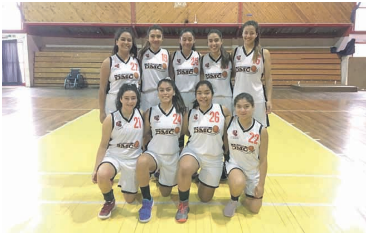
El equipo femenino del CD Manuel Cortés de Tierras Blancas, se enfrentó en un compromiso de preparación con la selección del IND.

Frente a esta situación, precisa la coordinadora, es necesario extender la invitación a los clubes de la zona que deseen sumarse a la liga, ya que todavía hay cupos por lo que se pueden contactar con ella o al correo yamarogo1973@gmail.com o al fono +56941641404.