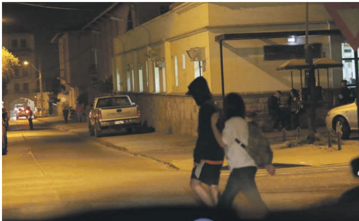
En calle Anfión Muñoz, muy cerca de los cuarteles de la PDI también se produce tráfico y consumo.

El Subcomisario de la PDI Juan Cáceres, Encargado del Equipo MT-0 (Microtráfico 0) en la Región de Coquimbo, destaca que este 2019 han comenzado de buena manera en términos de desbaratar puntos de venta en pequeñas cantidades. “Estamos trabajan-