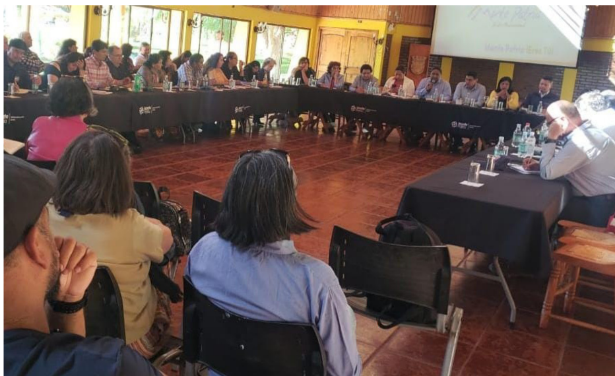
En la Mesa Rural de la Región de Coquimbo, los campesinos manifestaron su molestia.

Los dirigentes valoran que la política de desarrollo rural haya sido aprobada por el gobierno regional y central, pero esperan que se puedan acelerar los procesos para encontrar la vía por la cual se financiarán los distintos proyectos priorizados, como el manejo sustentable de la tierra y el mejoramiento de caminos rurales.