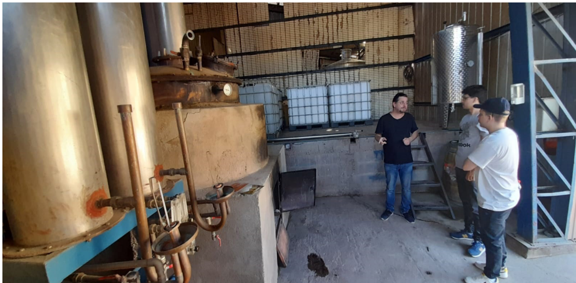
La pisquera Tuluahuén es un emprendimiento que comenzó en 1850 como un proyecto familiar en la localidad de la comuna de Monte Patria.