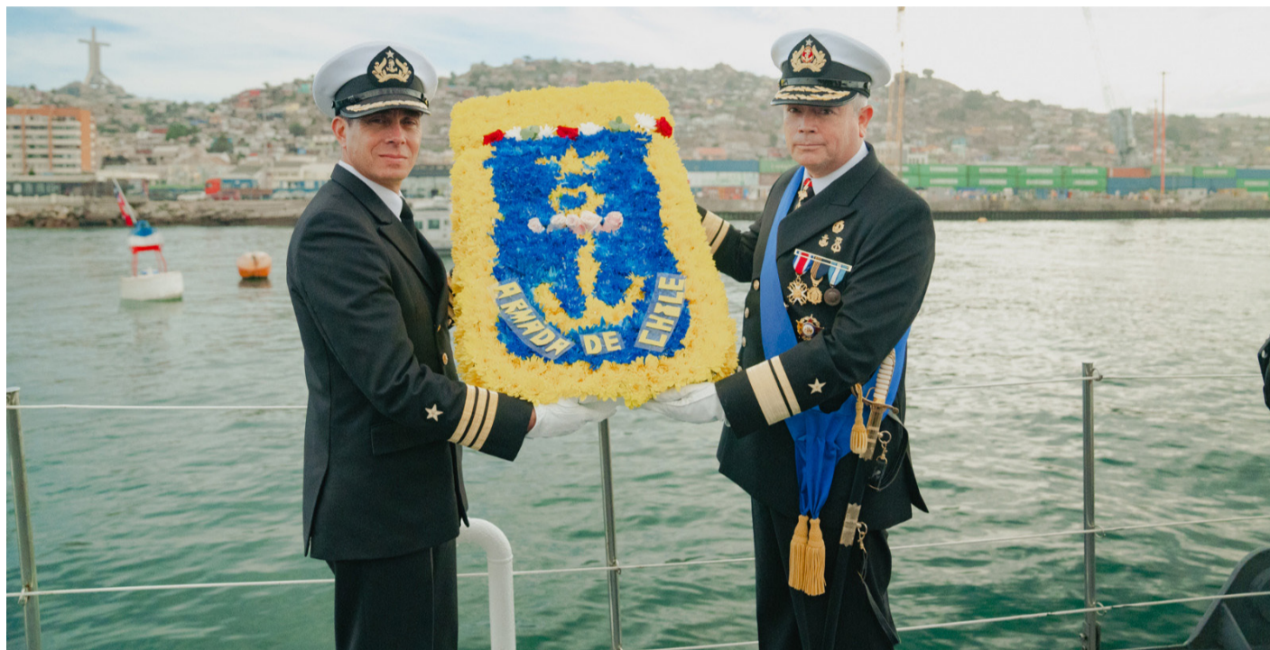
Las autoridades lanzaron al mar las ofrendas florales en honor a los héroes del Combate Naval de Iquique