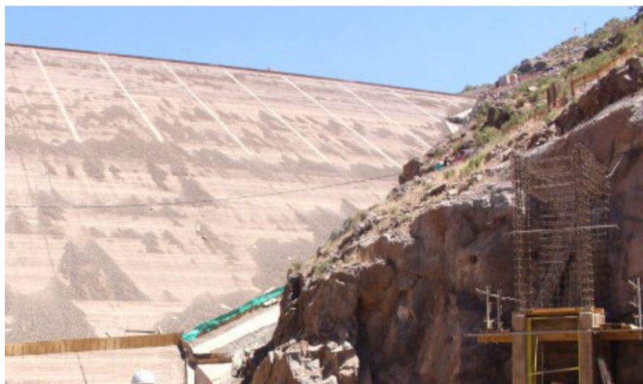
Murallas Viejas, que contempla una inversión superior a los U$196 millones. Tendría una capacidad de 50 millones de m 3 y beneficiaría a 3.250 hectáreas.

Murallas Viejas, La Tranca y Rapel son algunas de las obras anunciadas para la Provincia de Limarí, cuya construcción permitirá la acumulación de más de 110 millones de m 3 de agua para combatir la escasez hídrica en la zona. Sin embargo, dichos proyectos se encuentran nuevamente en estudio.