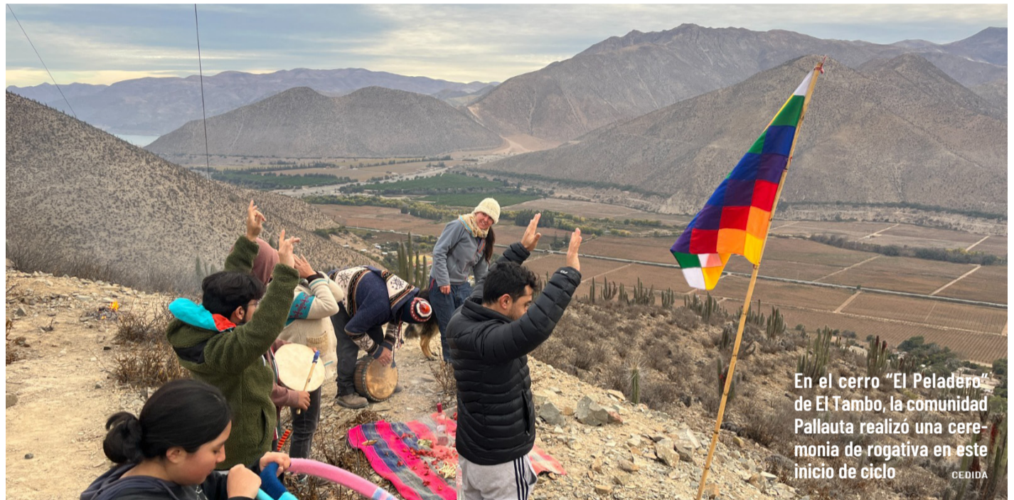
En el cerro “El Peladero” de El Tambo, la comunidad Pallauta realizó una ceremonia de rogativa en este inicio de ciclo

“Esta fue una actividad comunal que empezó a las 12 del día con una