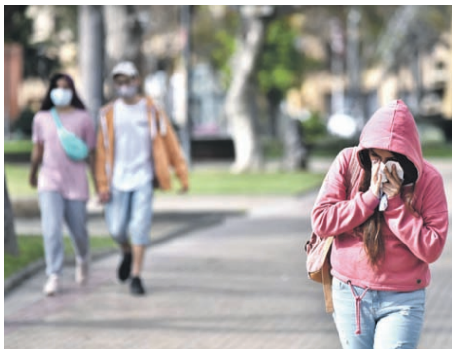
Los síntomas de las alergias no se caracterizan con la fiebre.