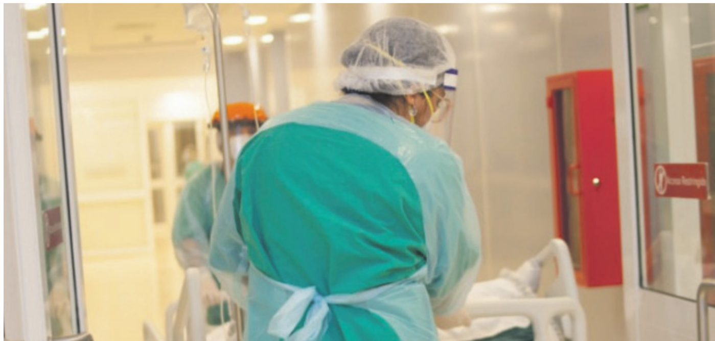
El impacto de la pandemia ha hecho que los recursos se redistribuyan y el foco ha estado puesto en las prestaciones relacionadas al Covid tanto en la salud primaria como también en los hospitales.

Para evitar las consultas presenciales y los contagios por coronavirus, ade-