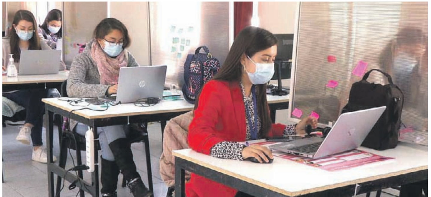
La Seremí de Salud cuenta con trazadores, encargados de monitorear a los pacientes contagiados y sus contactos estrechos.

Epidemióloga y Colegio Médico piden mayor cobertura en este ítem para detectar a la totalidad de pacientes –y sus contactos estrechos- contagiados y con síntomas en la región. Mientras que la autoridad sanitaria dice que la cobertura va en aumento y descarta contratación de más personal para estas labores.