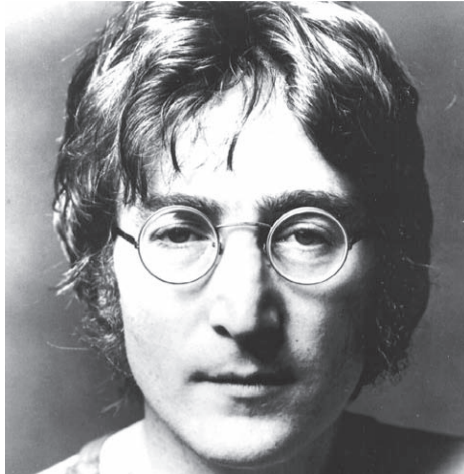
John Winston Lennon (más tarde, Ono Lennon), nació en Liverpool el 9 de octubre de 1940.

Lennon estudió en la escuela Quarry Bank High School, con apenas 16 años, en 1956, formó The Quarrymen, banda que sería el origen de The Beatles -nombre que adquirieron en 1960-, después de que se unieran a ella primero Paul McCartney, a quien conoció en el segundo concierto del grupo, y, más tarde, George Harrison.