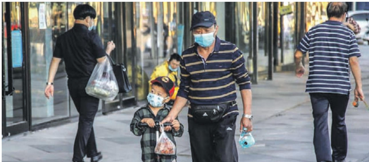
Personas transitando con mascarillas en las calles de Pekín, China, el miércoles 16 de septiembre.