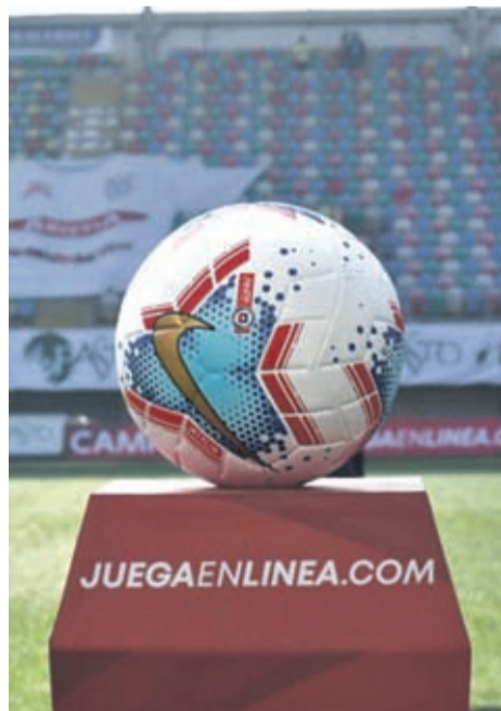
Desde que regresó la actividad, se han jugado alrededor de 70 partidos.

El Campeonato PlanVital y el Campeonato JuegaenLinea.com se reiniciaron el pasado 29 de agosto, después de varios meses de trabajo mancomunado entre las autoridades nacionales de salud y deportes, los clubes del fútbol chileno y las distintas comisiones conformadas en las ANFP. El torneo de Segunda División se sumó casi un mes después.