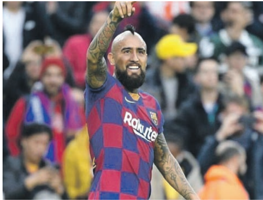
Ayer, el centrocampista de 33 años firmó su contrato con el Inter de Milán, donde será dirigido por Antonio Conte.

su ya excompañero en el Barcelona, y le aseguró que el vestuario del equipo azulgrana lo va a extrañar.