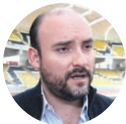
MARCELO PEREIRA ALCALDE DE COQUIMBO

“No entiendo muy bien el punto de la querrela, estoy siempre disponible a la conversación, yo por lo menos no me he referido al diputado con ningún tipo de mala palabra o algún comentario”.