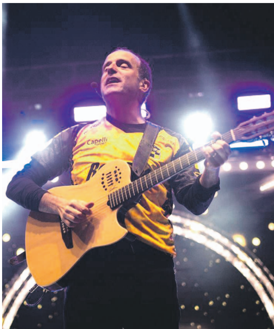
Enfundado en una camiseta de Coquimbo Unido, Stefan Kramer hizo reír a todo el público de la Pérgola Pampillera.

"La fiesta más grande de Chile es una puerta también para que los artistas locales puedan lucir su talento y en esta Pampilla 2024 quisimos abrirlo para que se suban al escenario agrupaciones de danza, cantantes urbanos y otros estilos, grupos consagrados y jóvenes con harto talento que merecen el apoyo de los coquimbanos y coquimbanas. De forma paralela al show, tenemos la renovada Pérgola Pampillera que este año quisimos darle más protagonismo como un espacio familiar, ahora pavimentada y que ha reunido a miles de personas en torno a shows infantiles, artesanía y artistas loca-