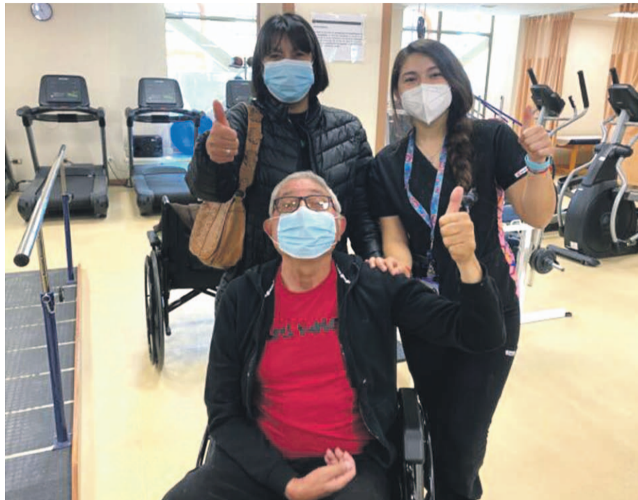
8 de cada 10 personas han podido beneficiarse desde la implementación de esta política pública.

“Con el Copago Cero logramos eliminar una barrera que impedía el acceso a la salud, un tema que es primordial para lograr nuestro objetivo que es avanzar hacia un sistema de salud universal, que