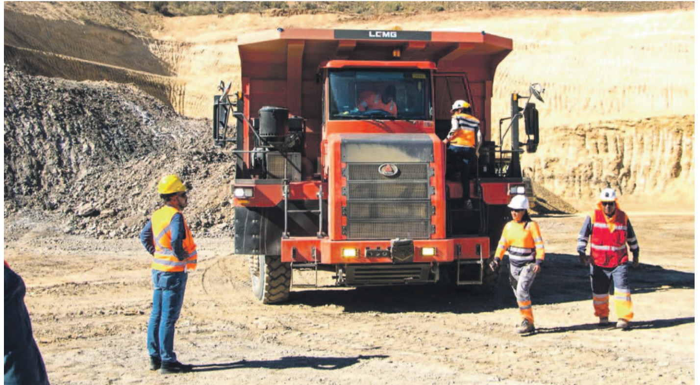
Más del 60% de los ocupados en minería en la región ejerce su trabajo en el Norte Grande y Atacama.