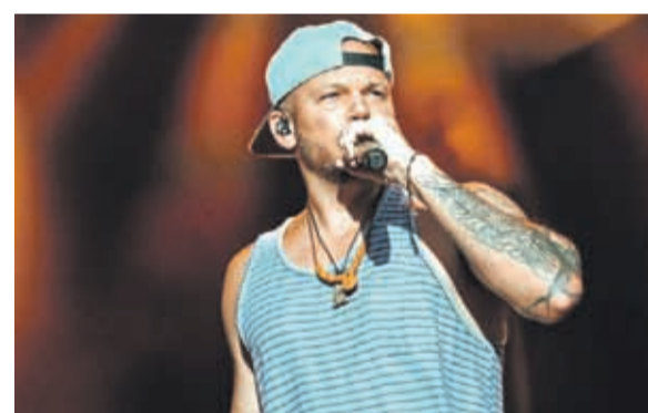
RESIDENTE RAPERO Y COMPOSITOR PUERTORRIQUEÑO

“Siento tanta impotencia ante esta situación. Me duele demasiado ver como mi país sufre de esta manera. no dejen que el desorden y el caos haga que la verdadera voz del pueblo se diluya, sin embargo, actuar en paz no significa que no se haga firmemente”.