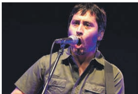
CLAUDIO NAREA MÚSICO NACIONAL EX LOS PRISIONEROS

“En Chile hay una democracia en crisis. La gente salió a la calle a manifestarse en respuesta a más de 30 años de abusos a través del alza y privatización de los servicios y derechos básicos (educación, salud, agua, vivienda, pensiones), la precarización laboral, colusiones, robos, la devastación de los territorios”.