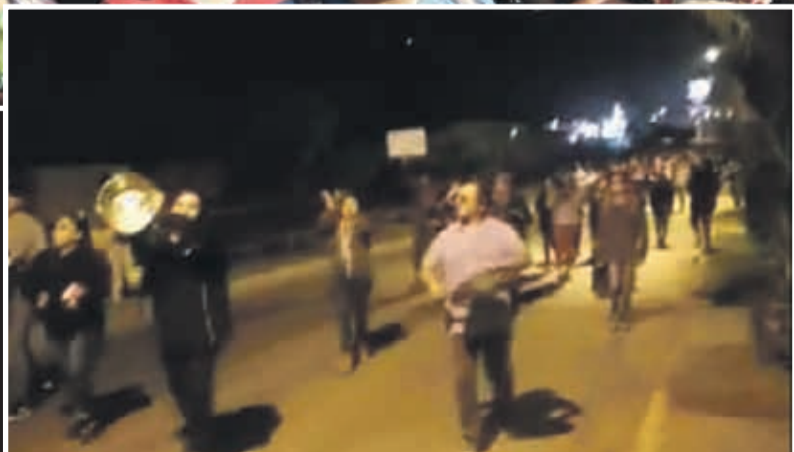
Pobladores marchan en un cacerolazo, sin respetar el toque de queda.