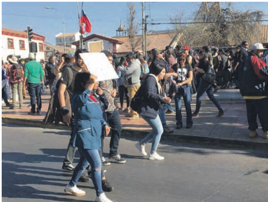
Hasta las calles la comunidad ha llevado su molestia, sobre la que los profesionales señalan que era una olla a presión que en cualquier momento estallaba.