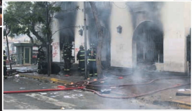
El incidente más grave ocurrió en La Serena, donde desconocidos provocaron un incendio en dependencias de la seremia del Trabajo.