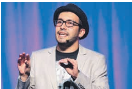
EDO CAROE HUMORISTA NACIONAL

“El gobierno se ha reído y aprovechado de nosotros toda la vida, ya es tiempo de actuar, de exigir nuestro derecho como personas y ciudadanos, de protestar si es necesario (...) son unos animales dominados por el abuso y el “poder” que dicen tener por usar un uniforme. Me encanta esta nueva generación sin miedo”.