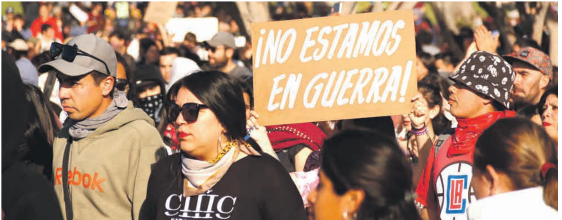
Con la consigna de "no estamos en guerra" se iniciaron las manifestaciones en La Serena, lamentablemente, terminaron con disturbios que empañaron el sentir de la protesta.