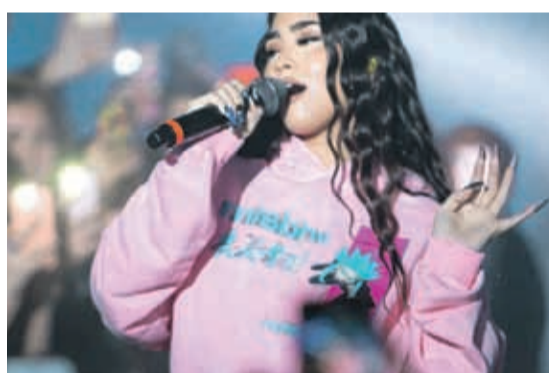
PALOMA MAMI CANTANTE CHILENO-ESTADOUNIDENSE

“Esto es el estallido espontáneo de una indignación encerrada a presión durante años (...) El problema de fondo está claro, y no hay tonitos de político acongojado ni músicas apocalípticas en los medios que los empañen. Hay que encausar esa indignación”.