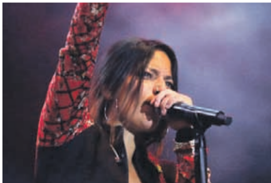
ANA TIJOUX CANTANTE Y COMPOSITORA NACIONAL

“En Chile hay una democracia en crisis. La gente salió a la calle a manifestarse en respuesta a más de 30 años de abusos a través del alza y privatización de los servicios y derechos básicos (educación, salud, agua, vivienda, pensiones), la precarización laboral, colusiones, robos, la devastación de los territorios”.