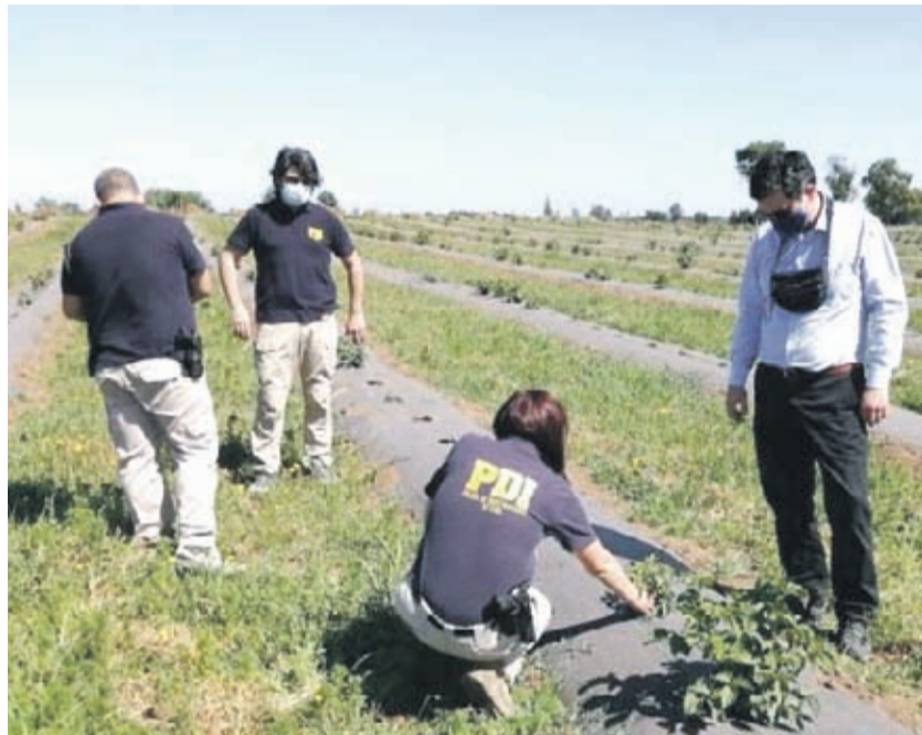
El fiscal del caso instruyó el trabajo de una sección especializada de la PDI: La Brigada Investigadora de Delitos Contra el Medioambiente (Bidema).

Los hechos fueron denunciados ante el Ministerio Público, que ayer confirmó el inicio de una investigación para establecer la veracidad de los hechos denunciados y eventuales responsabilidades.