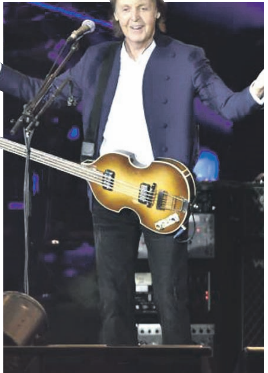
EL DÍA El músico ha compuesto y producido todos los temas del álbum, en los que él ha tocado asimismo cada uno de los instrumentos que aparecen.

OTEL PREMIUM a todo lujo ★★★★★ www.motelpremium.cl