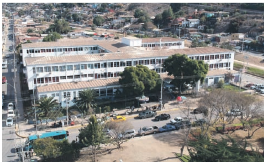
El recinto comenzó a recibir pacientes contagiados por Covid-19 durante el mes de abril.