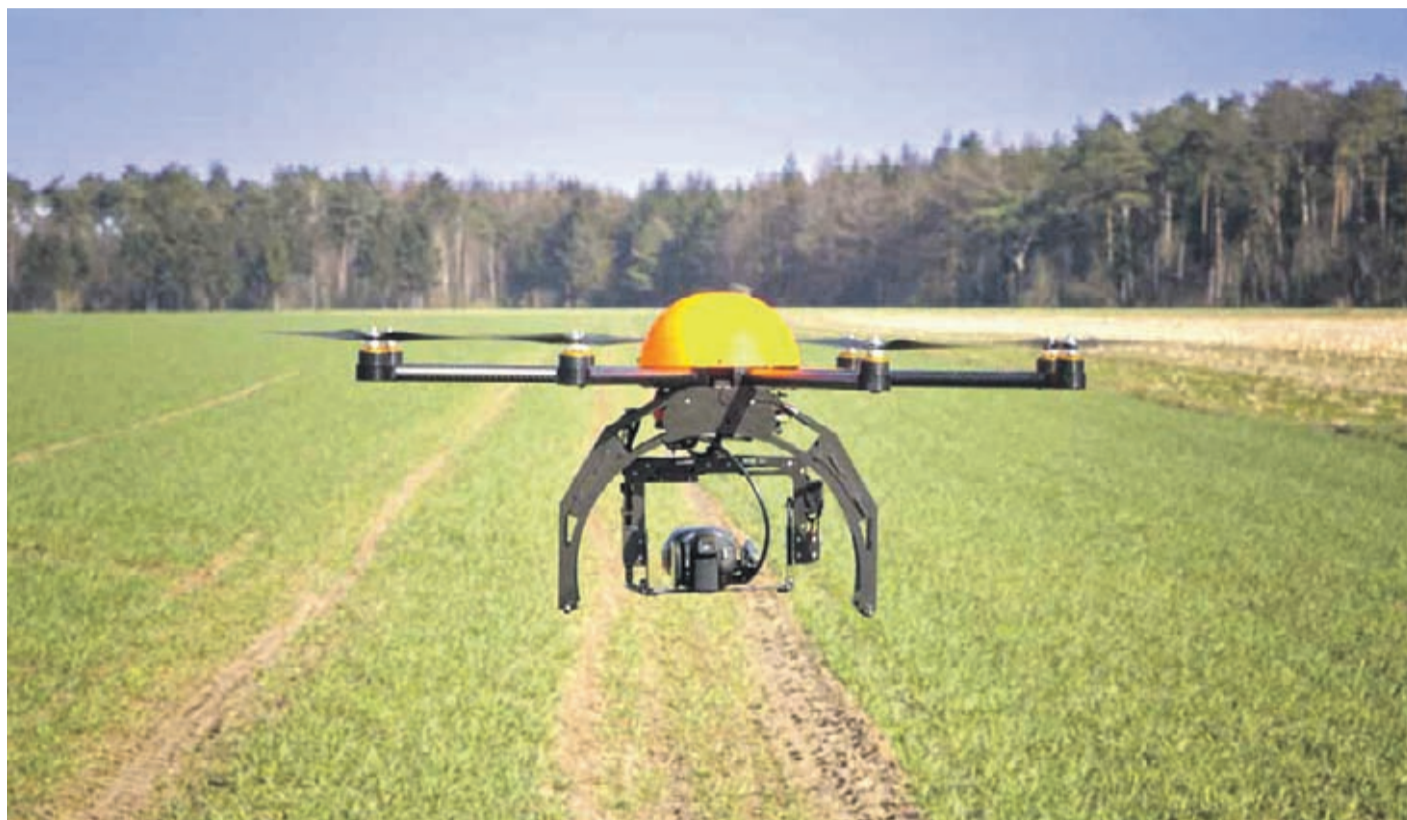
Con las nuevas tecnologías se pretende aumentar la eficiencia del uso del agua en la agricultura de América Latina y el Caribe

Por su parte, la Secretaria Ejecutiva Saini, destacó tres componentes claves que se vinculan en este proyecto: trabajo en red, llegada al productor y la digitalización y utilización de tecnologías de precisión. "Bienvenido es este tipo de tecnologías y muchas felicidades a todas y todos los profesionales involucrados. Esperamos que sea un gran aporte para la región y desde FONTAGRO estaremos