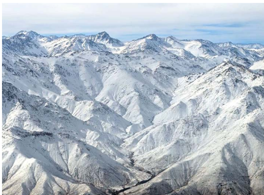
Nuevamente la nieve podría hacerse presente en las altas cumbres de la región.

Se recomienda tomar las precauciones pertinentes y estar atentos a la evolución del pronóstico en la página www.ceazamet.cl .