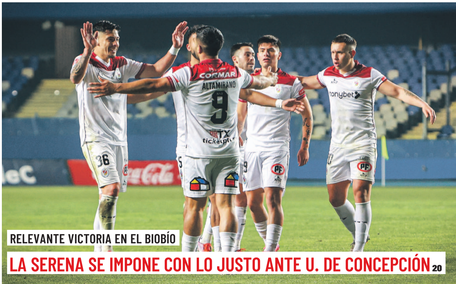
RELEVANTE VICTORIA EN EL BIOBÍO

Un grupo de desconocidos, quienes en plena calle Brasil llevaban consigo 12 botellas con acelerante y un bidón con combustible, se dieron a la fuga tras intentar ser fiscalizados por Carabineros en el marco de los despliegues nocturnos realizados este fin de semana. 6