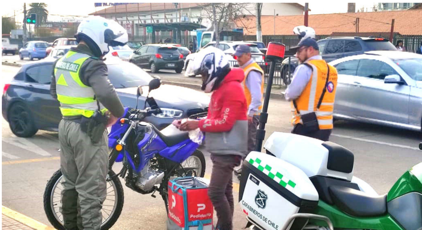
Carabineros mantuvo una fuerte presencia en terreno durante este fin de semana largo pasado.

El trabajo de seguridad permitió también reducir en un 30% los accidentes de tránsito, respecto al año 2023, “por lo que son cifras para considerar el despliegue operativo