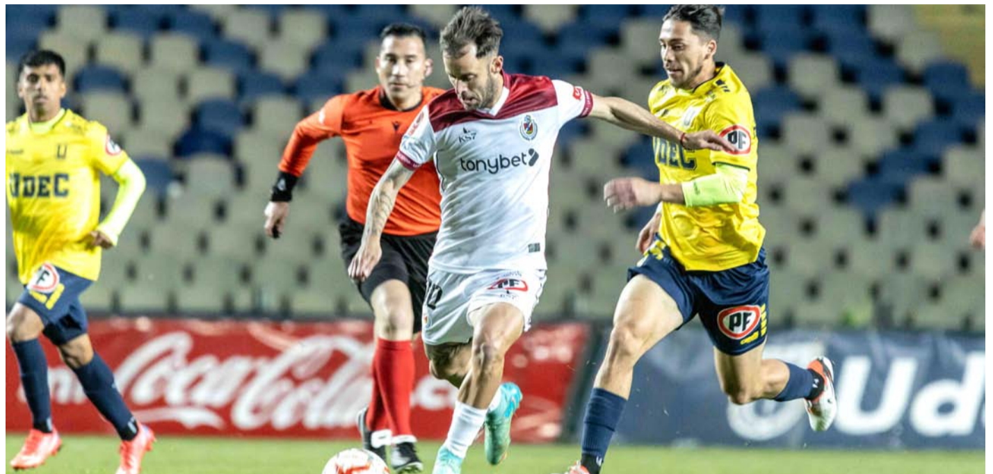
Club Deportes La Serena se trajo 3 puntos importantes desde el estadio Ester Roa Rebolledo.