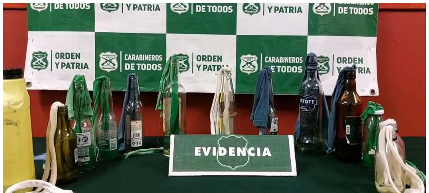
Un total de 12 bombas molotov dejaron abandonadas un grupo de sujetos tras ser sorprendidos por Carabineros, en pleno centro de La Serena.

En tanto, el delegado presidencial, Galo Luna, quien estaba al tanto de lo sucedido, destacó el accionar y el trabajo realizado por Carabineros con los despliegues nocturnos, "lo que permitió que los efectivos policiales detectaran a estos sujetos con el material que posteriormente fue decomisado. Sin embargo, podemos aclarar que, inicialmente, no se trata de ninguna acción vandálica o terrorista, debido a las características de las personas que escaparon