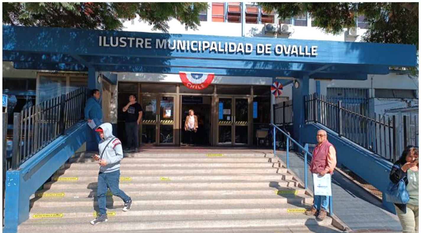
Actualmente, el número de trabajadores municipales de la comuna de Ovalle supera los 4.600.

El desglose de estas cifras, no obstante, ha llamado la atención en la provincia del Limarí y en la Región de Coquimbo, ya que Ovalle es el séptimo municipio con más trabajadores municipales en todo el país, con un total de 4.665, siendo superado solo por Antofagasta (9.809), Santiago