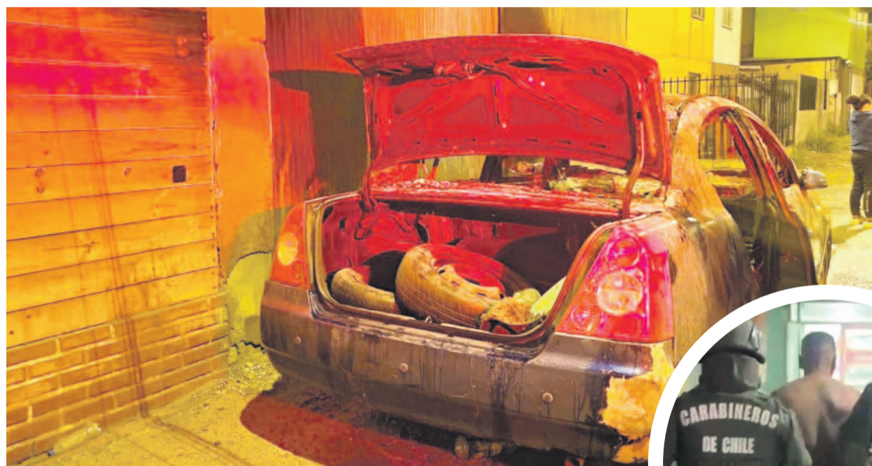
El hombre de 34 años fue detenido por personal de la Sección Centauro de Carabineros.