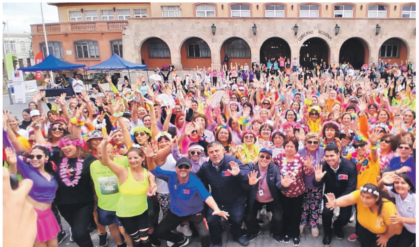
Una entretenida actividad deportiva se desarrolló en el centro de La Serena, como una manera de hacer un buen uso de los espacios públicos.

Sin embargo, el Cendyr La Serena y el de Caleta San Pedro fueron los otros espacios que albergaron parte de la jornada y a las familias interesa-