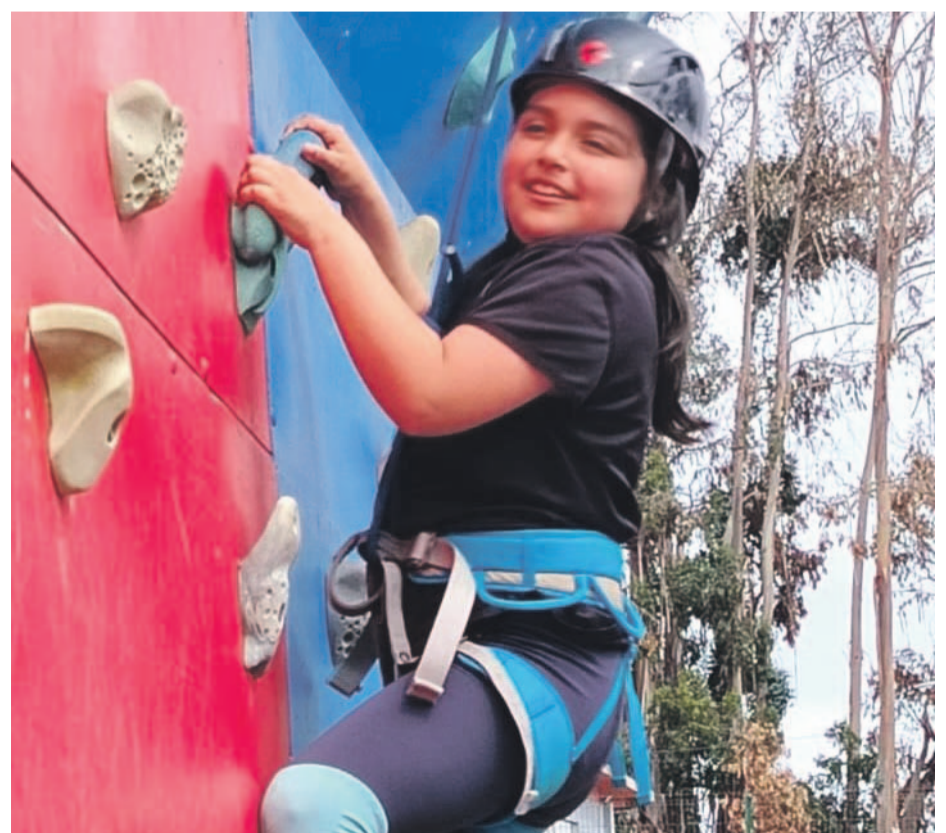
En el Cendyr San Joaquín, las familias, y los jóvenes en particular, disfrutaron de la oferta deportiva que entrega ese recinto deportivo ubicado en la capital regional.