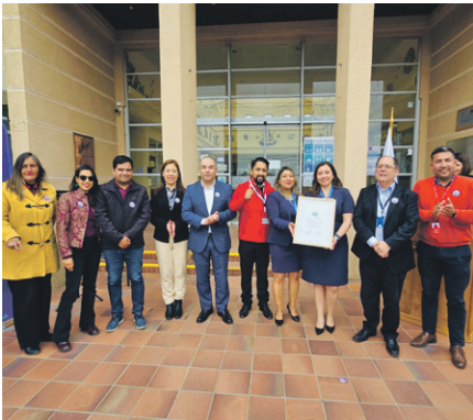
Actualmente, el CESFAM Pedro Aguirre Cerda del sector Antena, atiende a más de 33 mil usuarios, de los cuales 6 mil pacientes podrán acceder a tratamientos GES.