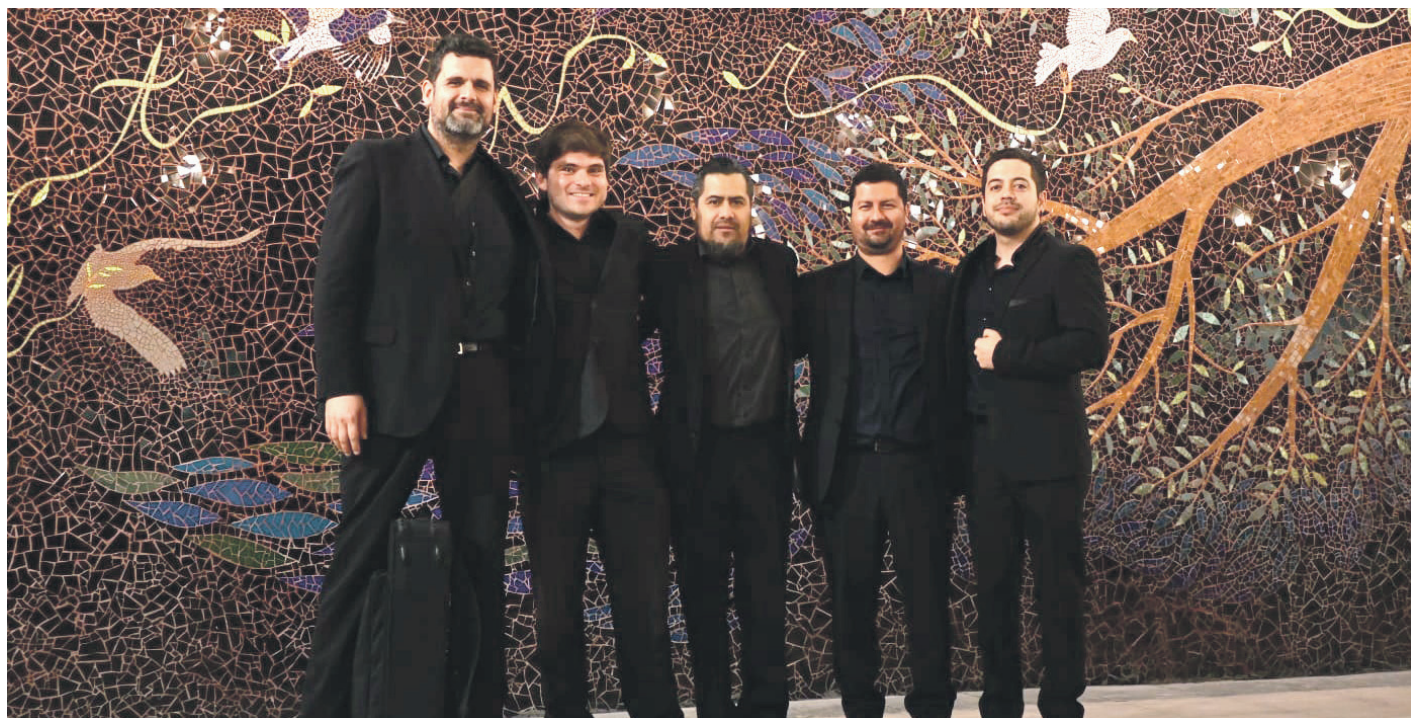
La Asociación Cultural Mismar reafirmó su compromiso con el desarrollo artístico regional, la descentralización cultural y la promoción de nuevas músicas en Chile.

“Hemos diseñado un plan de gestión con tres dimensiones fundamentales: una temporada de música de cámara; actividades orientadas a promover los derechos laborales y la prevención y cuidado de lesiones en intérpretes; y un impulso decidido a la creación