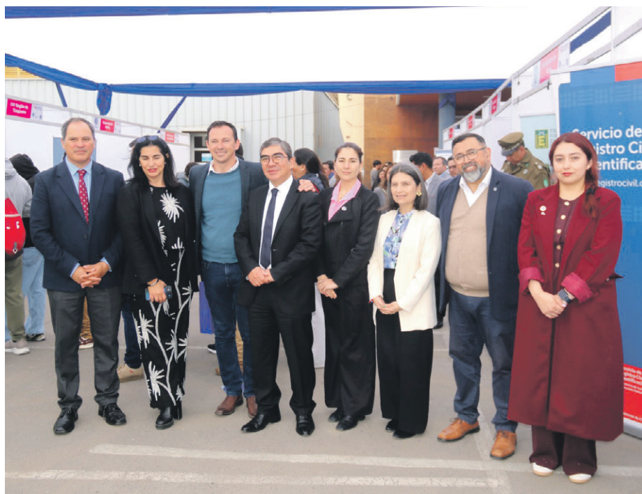
En la feria existen 20 stands implementados por las empresas participantes.