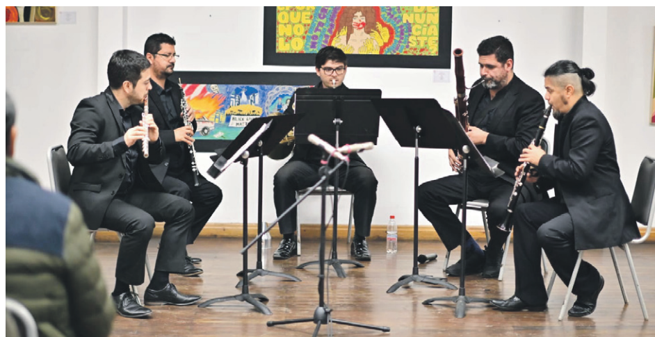
A través de esta nueva etapa, la agrupación busca consolidar su trabajo a través de una programación diversa que combina varios conciertos.

El primer concierto de la temporada se realizará este jueves 23 de octubre a las 19:00 horas en la Sala de Conciertos del Departamento de Música de la Universidad de La Serena, y marcará el punto de partida de una temporada que busca acercar al público a repertorios cuidadosamente