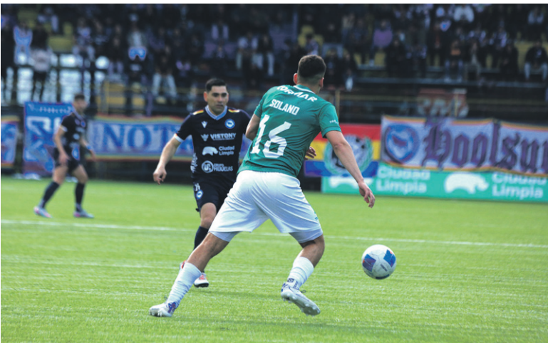
Provincial Ovalle, a través de su directiva, es uno de los clubes que lucha por el cambio en la Segunda División.

El proyecto de los clubes apuntaba a un formato con más incentivos deportivos y mayor regularidad en el calendario, buscando evitar extensos periodos de inactividad que afectan los ingresos, las planificaciones técnicas y la estabilidad laboral de jugadores y funcionarios. “Esta propuesta está enfocada en darle mayor continuidad al campeonato y un formato con más incenti-