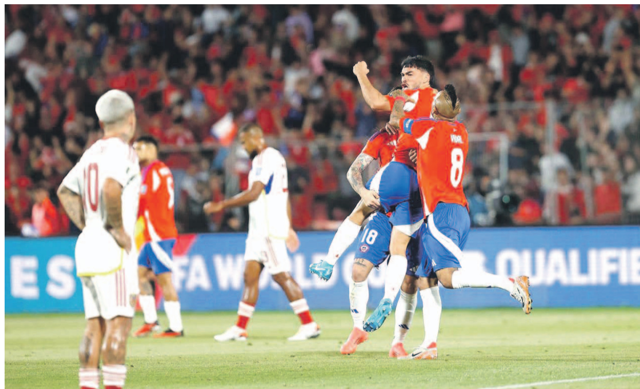
La victoria de Chile ante la Vinotinto fue un verdadero baño de energía para el equipo nacional.

Lo obtenido en ambos partidos es la única cosecha del técnico argentino tras dirigir seis encuentros de estas eliminatorias, que se reanudaron en