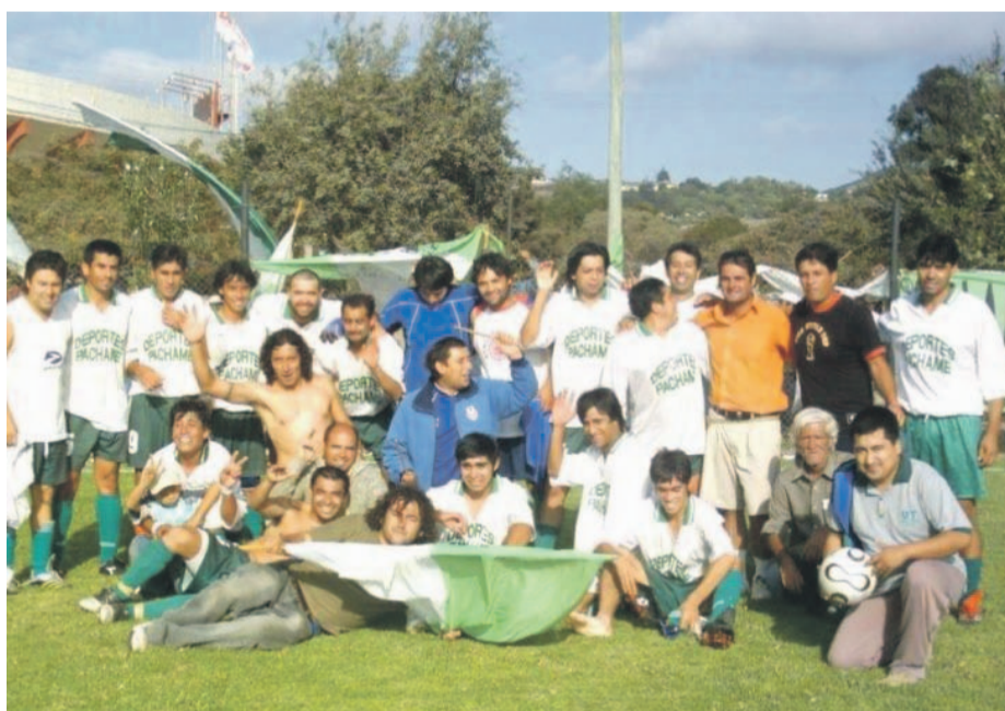
Imágenes de Diablos Rojos y Unión Tangué en plena celebración.