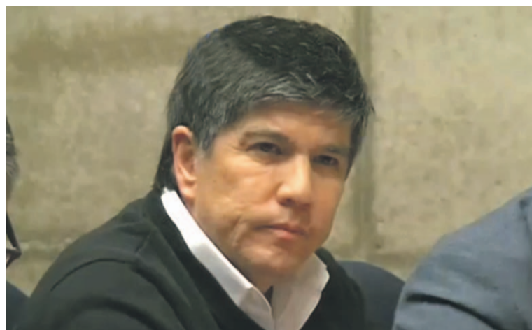
Las autoridades insistieron en que la protección del exsubsecretario Manuel Monsalve al interior del penal de Rancagua está asegurada.

Por medio de un breve comunicado, Gendarmería de Chile informó que “recabados todos los antecedentes, que darían cuenta de una presunta amenaza al imputado Manuel Monsalve, en circunstancias donde se encontraba en el área de salud del Complejo Penitenciario de Rancagua, la Institución presentó una denuncia ante el Ministerio Público para investigar los hechos”.