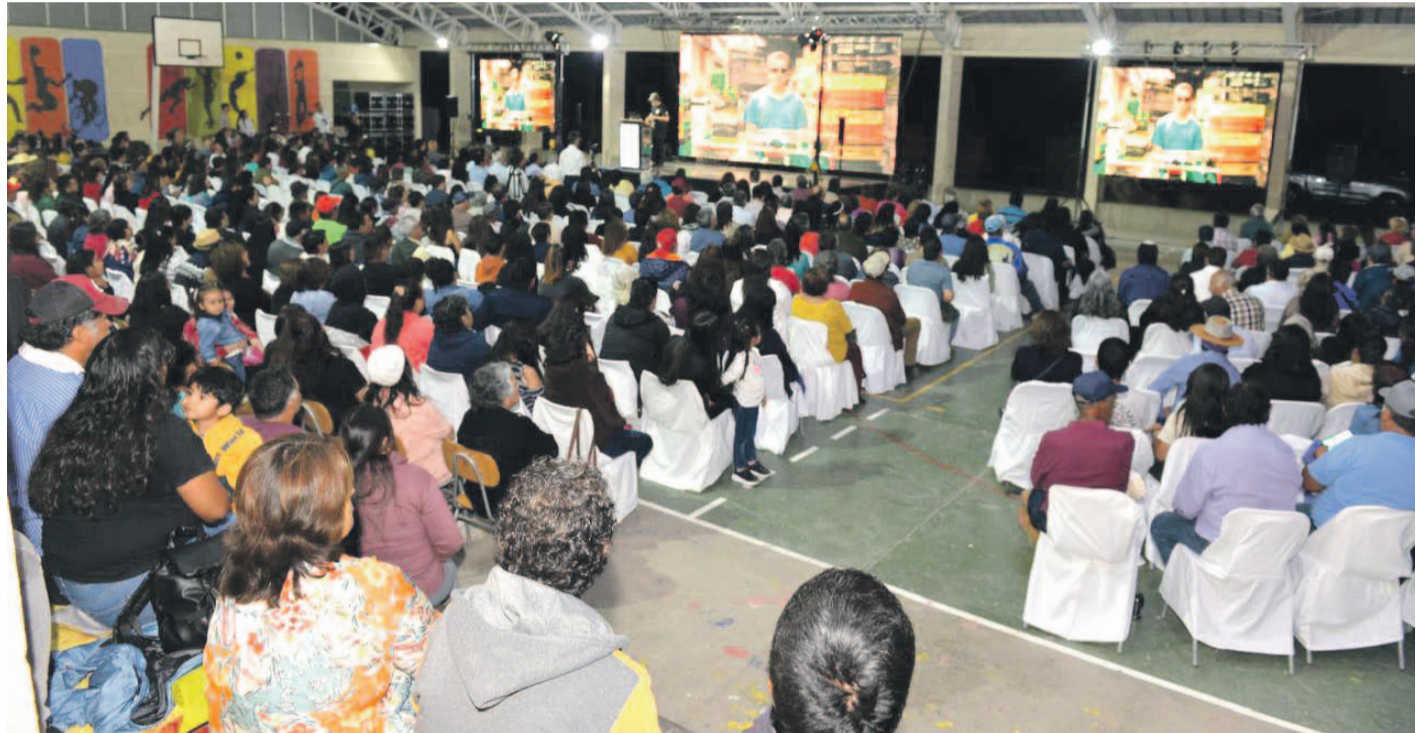
Más de 800 vecinos de la comuna de Alto del Carmen participaron en el encuentro anual de emprendedores del programa Emprende Alto.

Barrick, junto a un comité de desarrollo integrado por líderes de la comunidad y autoridades, iniciaron en 2020 este programa de apoyo al emprendimiento local, y a la fecha, ha recibido cerca de 2 mil postulaciones. Los beneficios que entrega el programa incluye capacitaciones, apoyo para la formulación de planes de negocio