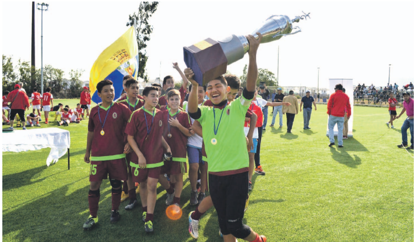
La actuación de las academias que forman parte de la Asociación Diaguitas ha sido sinónimo de éxito desde hace varios años.

De esta manera, ahora las academias -formalizadas como clubes- cuentan con los derechos de formación de sus deportistas, lo que significa ingresos económicos en caso de