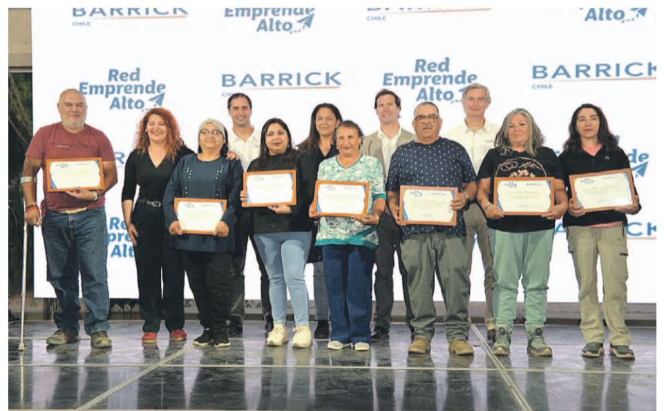
Diversos reconocimientos recibieron los emprendedores locales.

Esta red tiene como objetivo brindar apoyo a los emprendedores a través de tres principales ejes de trabajo: asesoría para la formulación de proyectos, capacitación en temas relacionados al quehacer del emprendedor y cofinanciamiento para cubrir el aporte