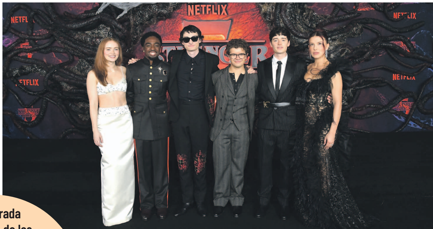
De izquierda a derecha: Sadie Sink, Caleb McLaughlin, Finn Wolfhard, Gaten Matarazzo, Noah Schnapp y Millie Bobby Brown en la premiere de la temporada 5 de la serie en Hollywood, el pasado 5 de noviembre.

Consagrada como una de las series más vistas de Netflix, la ficción protagonizada por Millie Bobby Brown, Finn Wolfhard y Winona Ryder regresa para una última temporada que promete un emotivo desenlace.