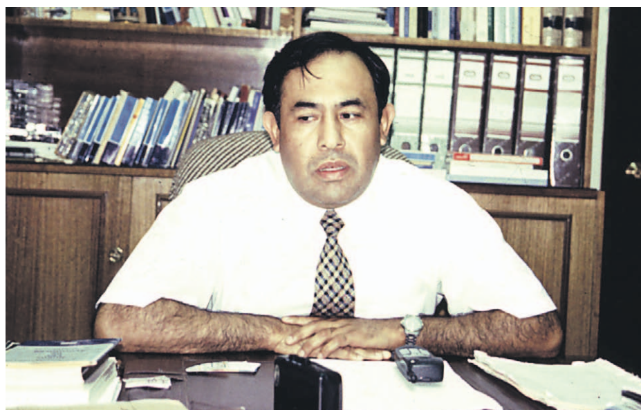
En agosto de 2000, Simpertigue fue nombrado juez de Garantía de La Serena, integrando el primer grupo de magistrados responsables de poner en marcha la Reforma Procesal Penal.

El antecedente detonó una inmediata reacción política, especialmente entre