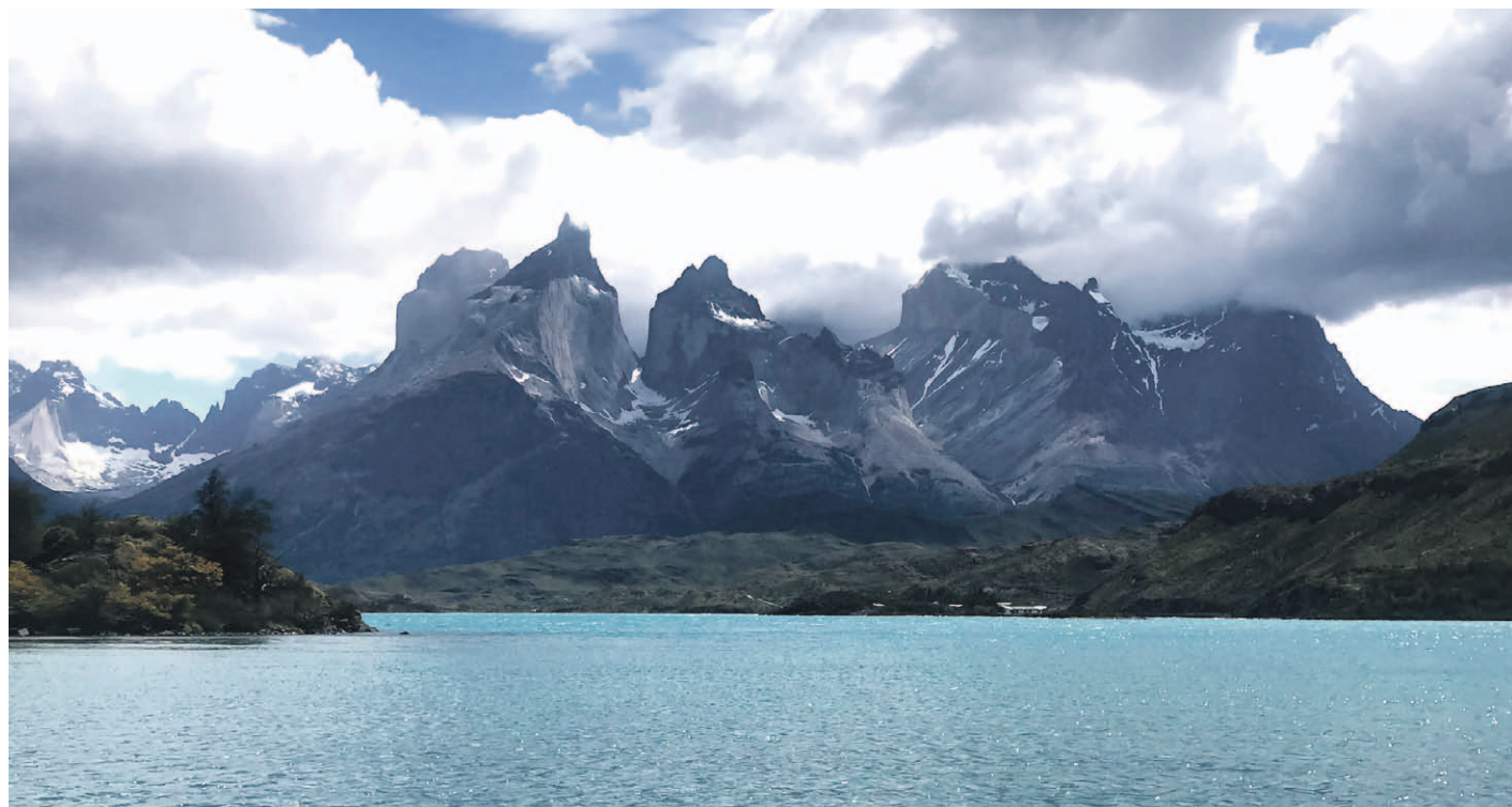
Imagen del macizo del Paine, rodeado de pampas, bosques, lagos y glaciares, es uno de los mayores atractivos turísticos de Chile.

En general, la conectividad es prácticamente nula, con campamentos remotos y varias zonas en las que