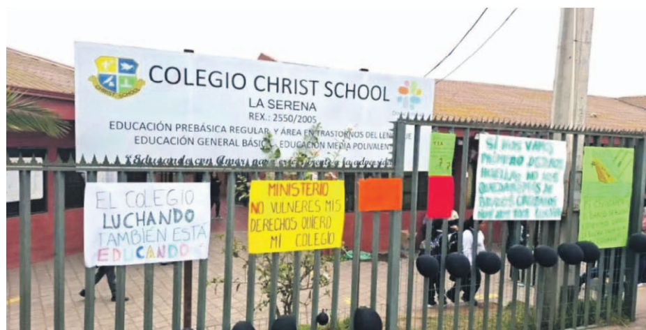
La revocación del reconocimiento oficial del Colegio Christ School se hará efectiva a partir de marzo de 2026, momento en que se concretará el cierre definitivo del establecimiento.

La solicitud fue acogida por la Subsecretaría de Educación, por lo que se requirió al nuevo sostenedor la entrega de antecedentes, los que fueron evaluados por la seremi de Educación, proceso que culminó recientemente.