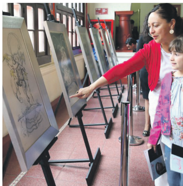
La muestra es totalmente gratuita para la comunidad.