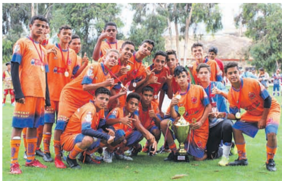
CATEGORIA 2004-2005, Campeón COMPAÑÍAS CUP 2019, RELÁMPAGO ARAGUAY, BRASIL