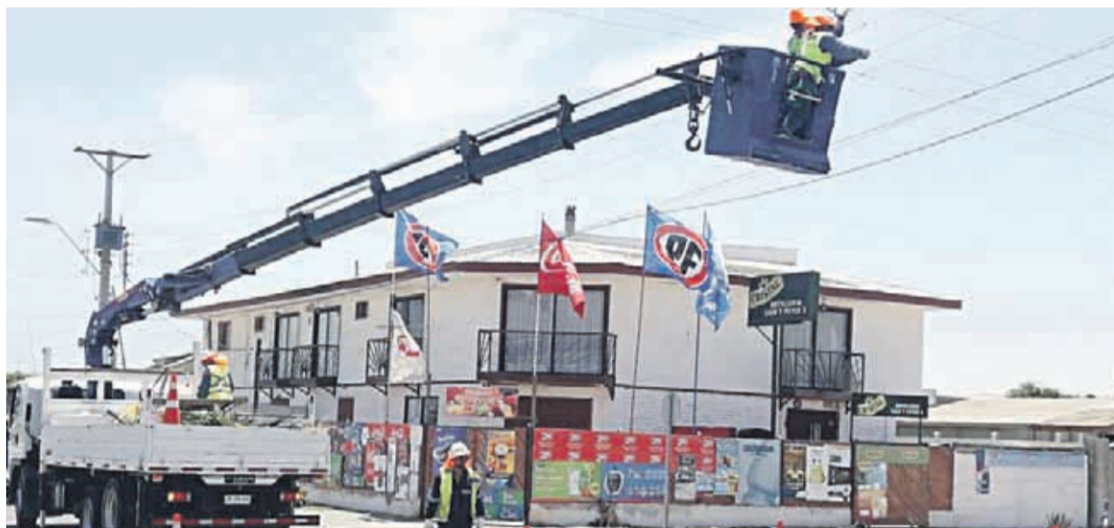
Diversos puntos de la región, principalmente La Serena y Coquimbo, fueron afectados por los cortes de electricidad.