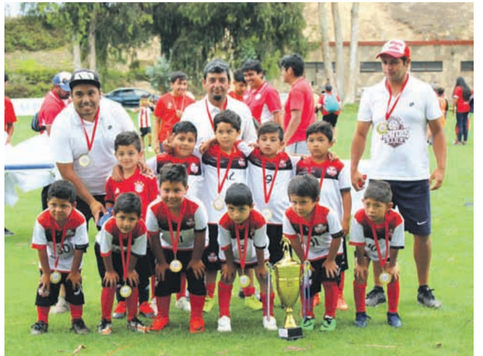
CATEGORIA 2012, Campeón COMPAÑÍAS CUP 2019, PAPAYEROS KID'S