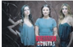
15:20 Verdades ocultas. MEGA