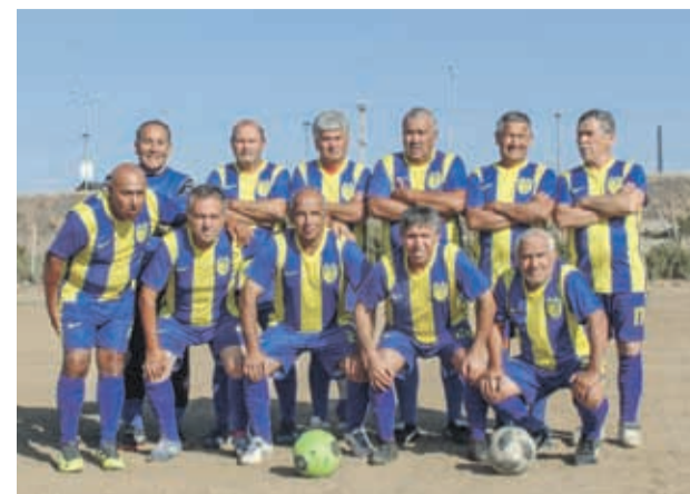
El Real Amistad no tuvo el mejor debut pero espera mejorar en las próximas jornadas.

“Pinigol” podría integrarse a Coquimbo Unido el viernes en La Calera y estaría llegando al puerto con sus compañeros el sábado para comenzar su trabajo. 38031