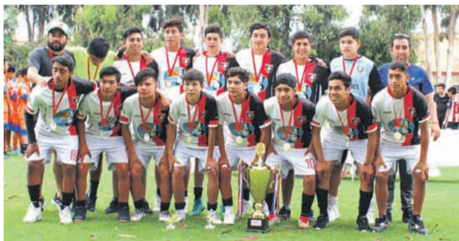
CATEGORIA 2002-2003, Campeón COMPAÑÍAS CUP 2019, PALESTINO PUERTO MONTT