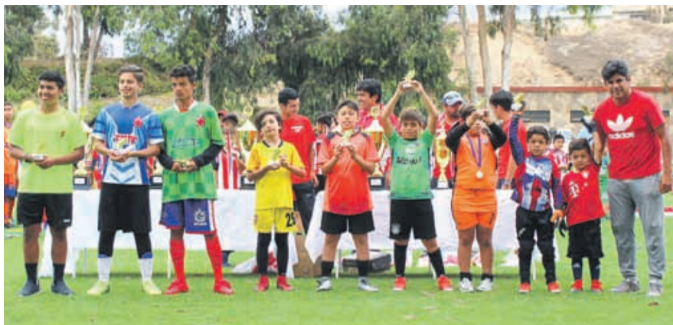
ARQUEROS MENOS BATIDOS, en sus Categorías, Torneo Internacional COMPAÑÍAS CUP 2019