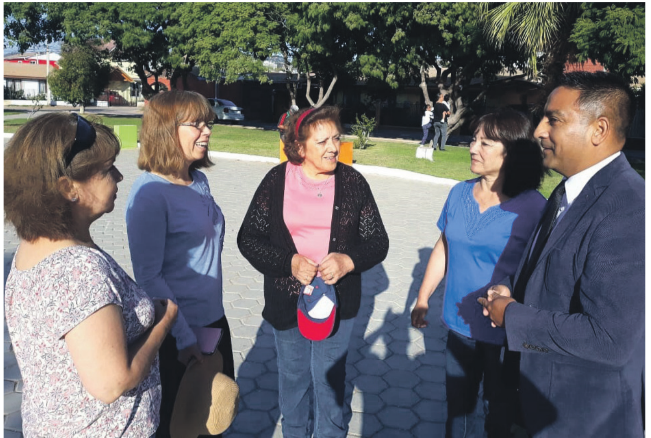
Los vecinos de buen pastor piden a las autoridades tener más seguridad en el sector.

“El llamado a las autoridades es a preocuparse por el sector La Pampa, porque hay un sentir de que necesitamos más refuerzo policial, si bien tenemos muy buena relación