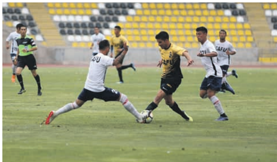
Ante deportes copiapó los piratas se impusieron por 2-0 en partido jugado a cuatro tiempos de treinta minutos cada uno.

Posteriormente, ya en marzo, reciben a Everton en el estadio