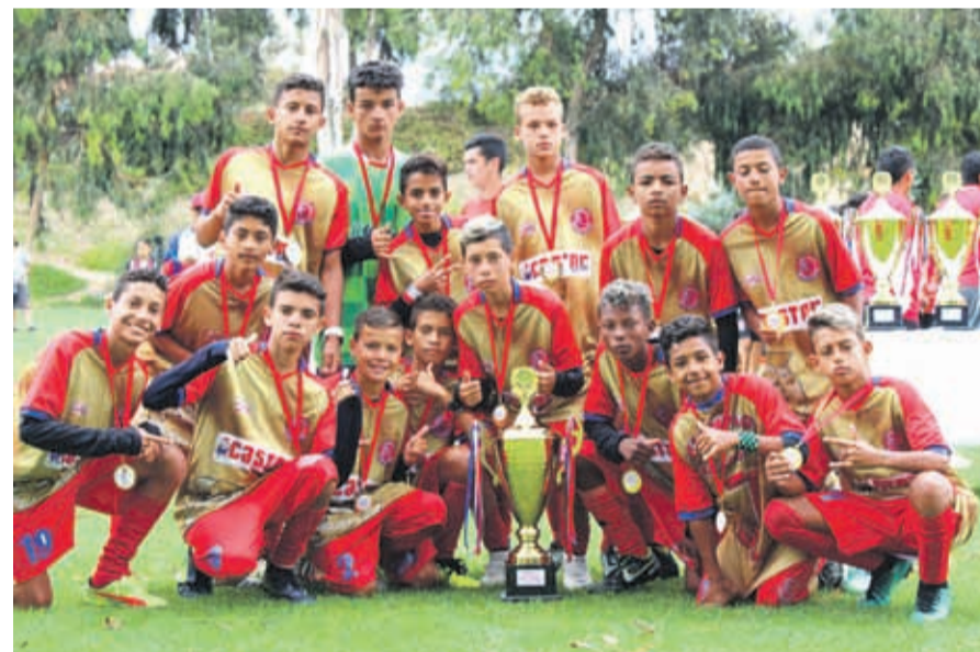
CATEGORIA 2006, Campeón, RELÁMPAGO ARAGUAY-BRASIL