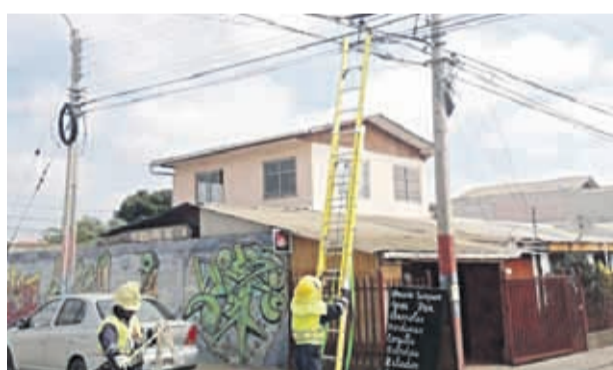
Brigadas trabajaron en la reposición del suministro eléctrico tras los cortes de líneas.

nal, no se preocupan de lo que está pasando la gente y eso es totalmente relevante”, sostuvo a El Día.