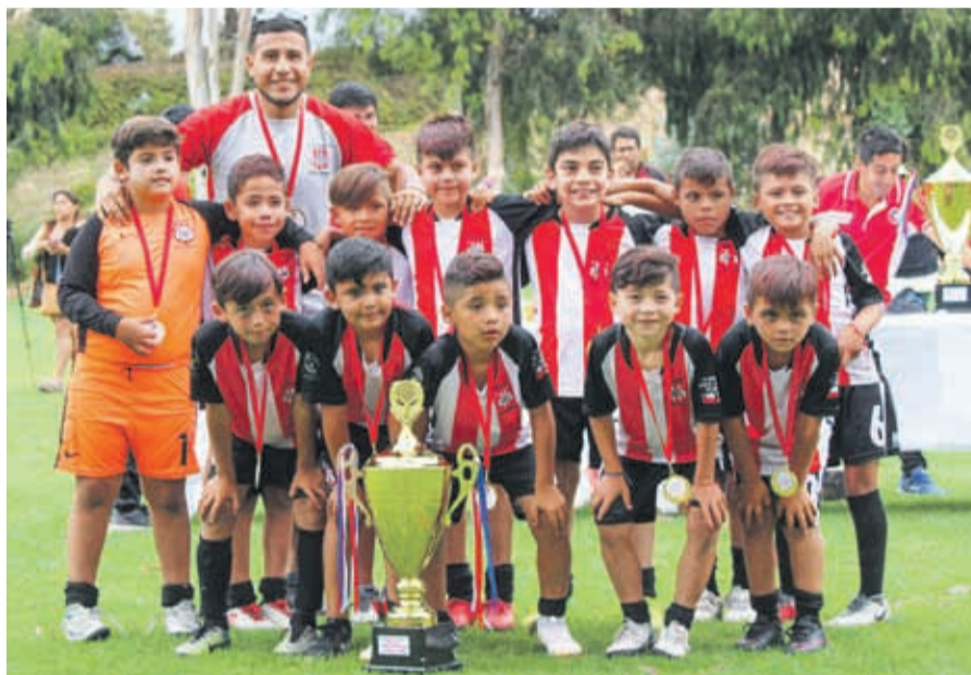
CATEGORÍA 2010, Campeón COMPAÑÍAS CUP -2019, ESMERALDA de ARICA