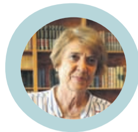
CONSUELO VALDÉS Ministra de Las Culturas, Artes y Patrimonio.

Usted lo puede ver. La pieza de mi sobrina quedó inutilizable y ella ya no quiere dormir aquí por el miedo, esto pese a que recién lo habíamos arreglado después de muchos trámites. Esto demuestra que los arreglos que se hacen muchas veces son muy a la ligera