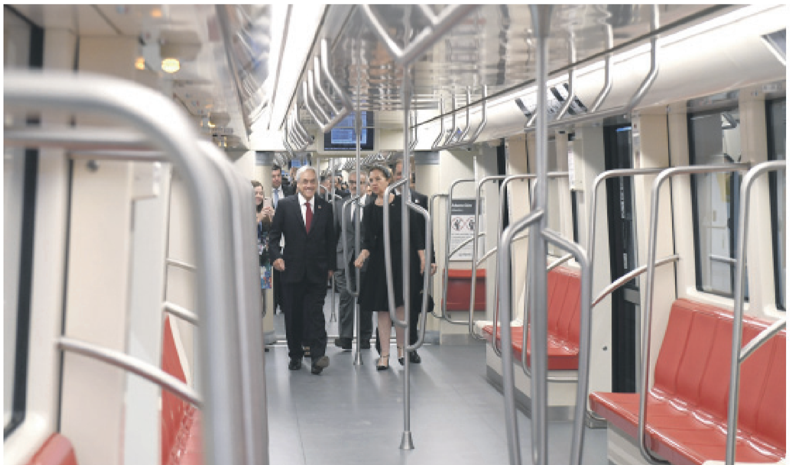
Piñera valoró las modernas instalaciones de esta nueva línea del metro, que busca beneficiar a más de 245 mil personas.

“Los sistemas en red tienen que estar conectados, porque mientras más conectados están, más útiles son para todos y cada uno de sus usuarios”, expresó el Mandatario en su discurso de inauguración, donde estuvieron presentes la ministra de Transporte y Telecomunicaciones, Gloria Hutt, de Obras Públicas, Juan Andrés Fontaine, la intendenta Karla Rubilar, el presidente