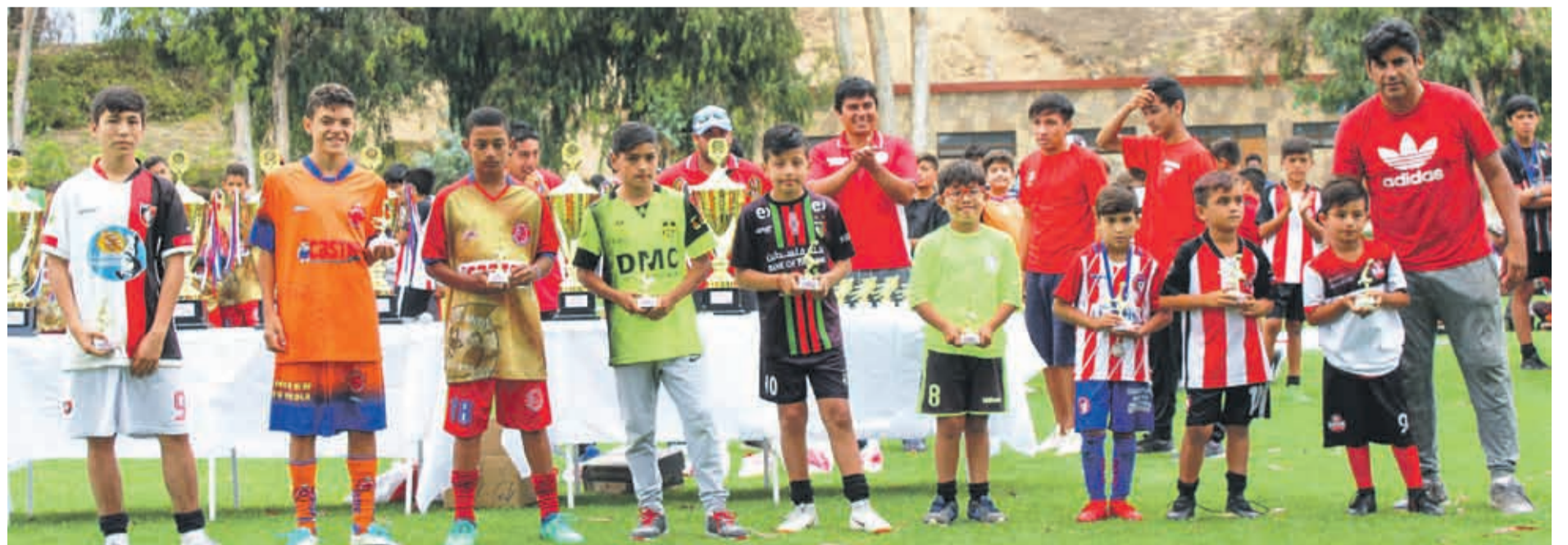
GOLEADORES en sus Categorías, III Versión Torneo Internacional de Fútbol Infantil COMPAÑÍA CUP 2019.jpg

Fotografía: Nicanor Díaz Contacto: jtorres@eldia.la