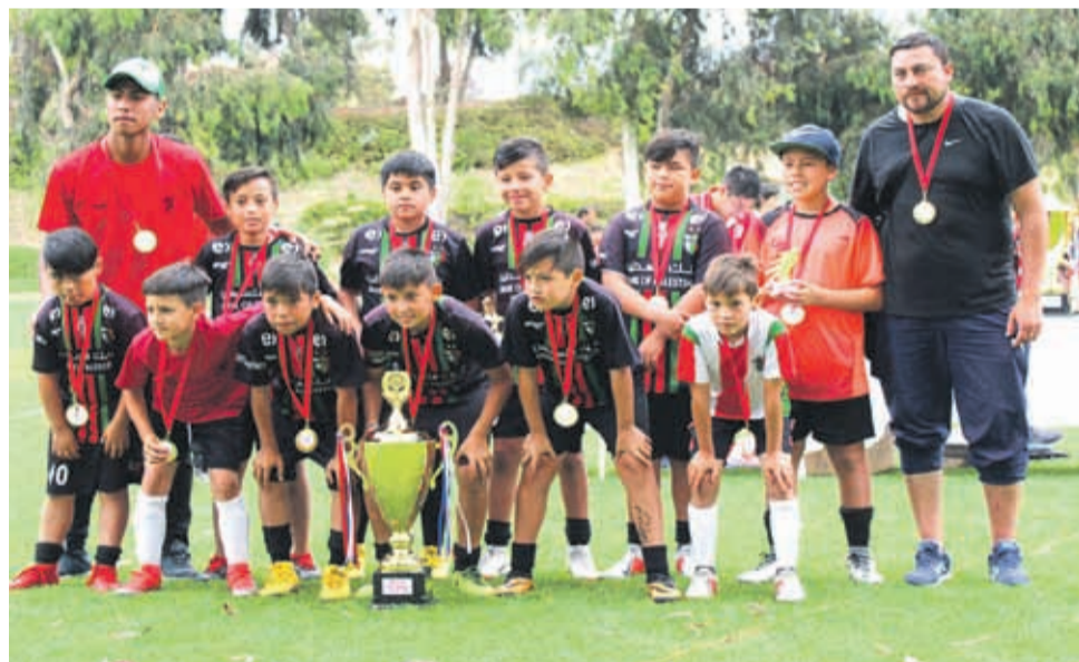
CATEGORIA 2008, Campeón COMPAÑÍAS CUP 2019, PALESTINO PUERTO MONTT