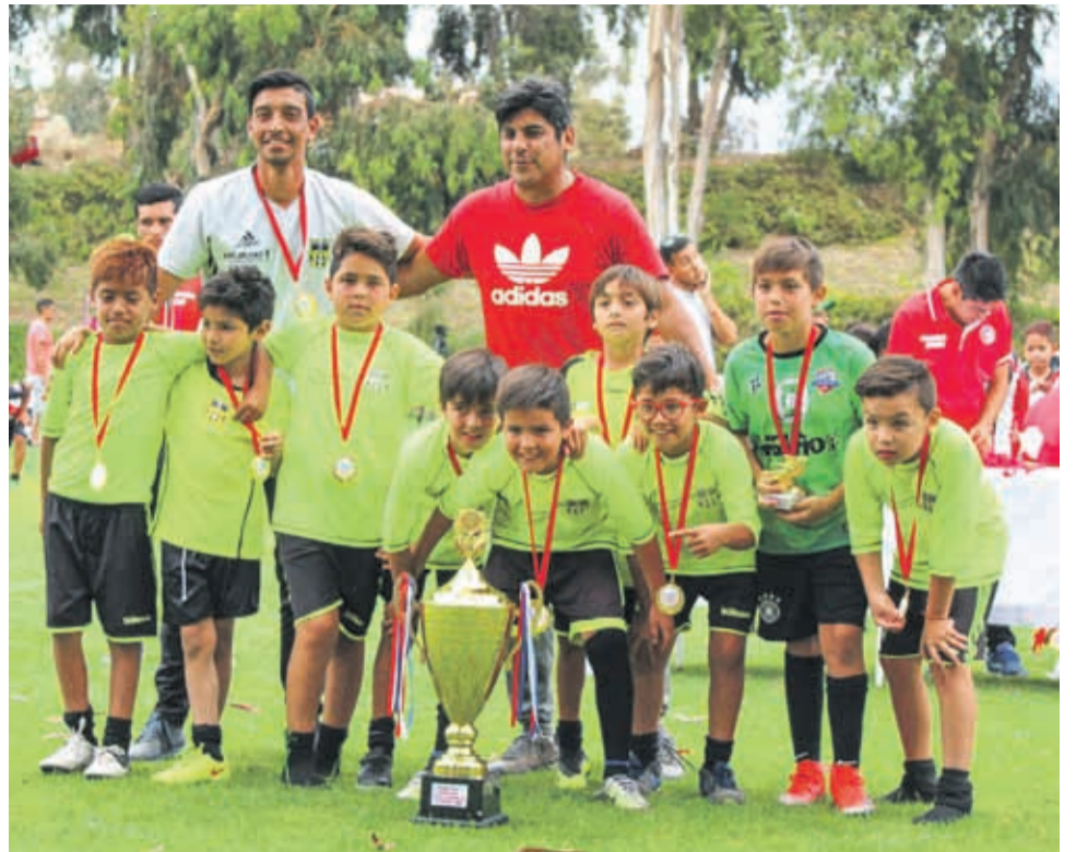
CATEGORIA 2009, Campeón COMPAÑÍAS CUP 2019, MARFIL COQUIMBO

Durante la tarde del pasado domingo se llevó a cabo el cierre del Campeonato Internacional de Fútbol Infantil Compañías Cup-La Serena 2019, y premió a los más destacados del torneo en las canchas del Complejo La Alpina.