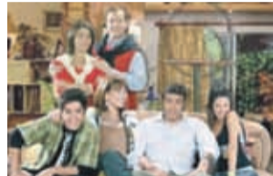
15:30 Casado con Hijos. CHV