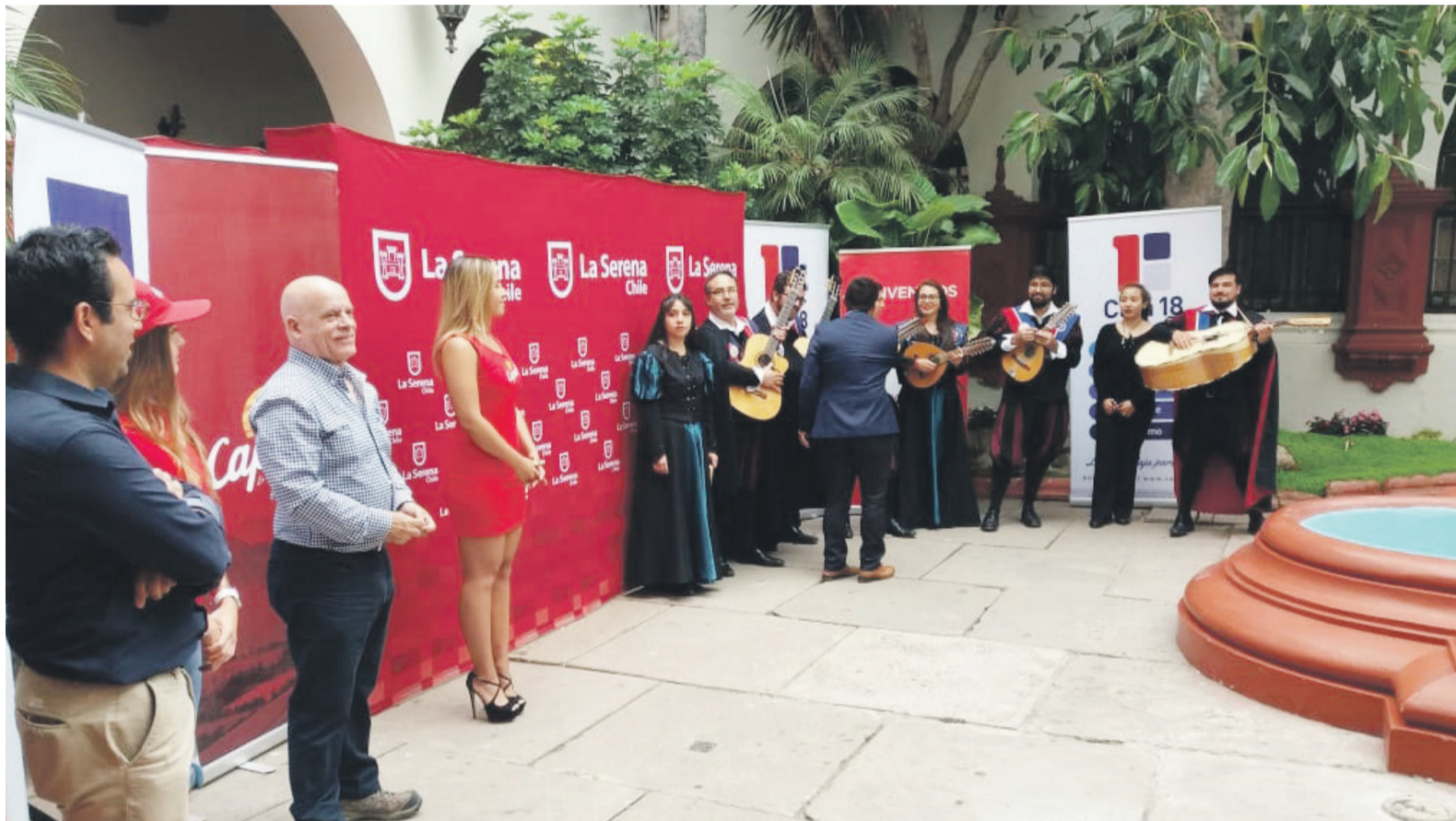
Autoridades e integrantes de las tunas reiteraron la invitación para el fin de semana