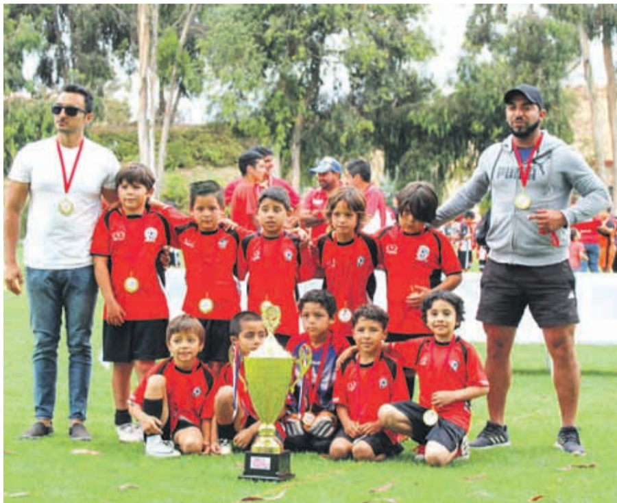
CATEGORIA 2011, Campeón COMPAÑÍAS CUP 2019, ACADEMIA LA SERENA