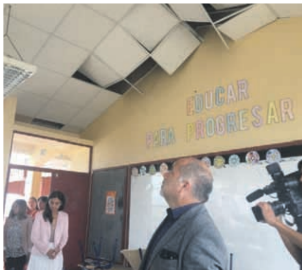
El seremi de Educación recorrió algunos de los establecimientos que presentaron mayor daño en la región.

“Hemos recibido importantes reportes de Choapa y Limarí de que prácticamente no habría