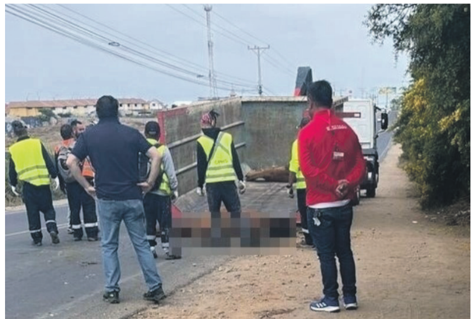
Uno de los equinos murió instantáneamente producto del impacto del vehículo, mientras otros debieron ser sacrificados.