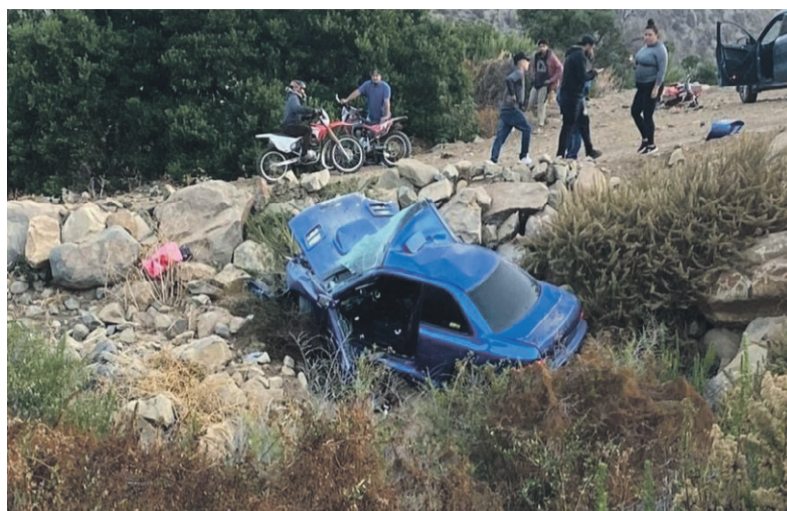
El conductor fue trasladado al hospital de Los Vilos donde falleció producto de las lesiones.

Cabe reiterar que es la quinta víctima fatal en un accidente vehicular ocurrido durante lo que va del mes de enero.