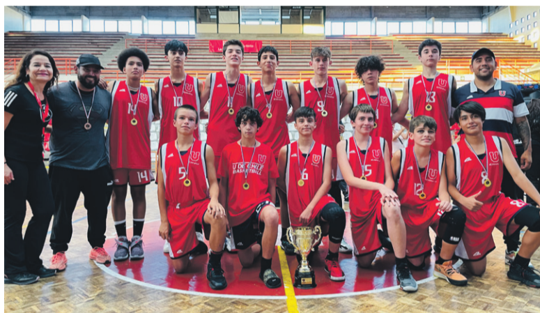
La misión capitalina de la Universidad de Chile U14, fue el mejor entre los varones, mostrando gran nivel colectivo e individual.