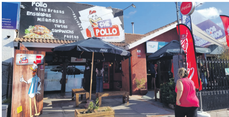
Che Pollo ubicado en la Av. José Joaquín Pérez 4335.