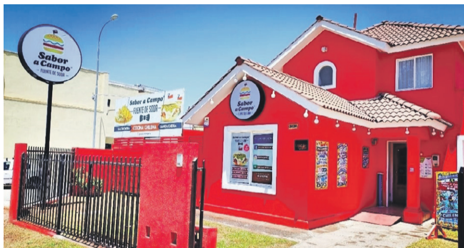
Sabor a Campo, ubicada en Av. Ulriksen 3020 nació en el año 2017.

Durante estos días de verano, la cantidad de turistas que visita la zona gusta de conocer más a fondo todas las opciones gastronómicas que existen tanto en La Serena como en Coquimbo, por lo que a continuación te dejamos una lista de algunas de las “picadas” que debes visitar si te encuentras pasando unos días de descanso en la región.