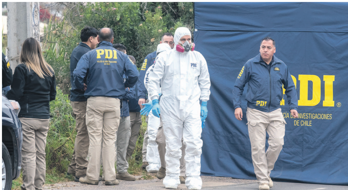
Los restos de la mujer fueron encontrados el sábado pasado a un costado de la avenida Cuatro Esquinas, en La Serena.

Sin embargo, el oficial no entregó mayores detalles de las pesquisas “porque pueden obstruir la investigación que estamos realizando. Estamos viendo