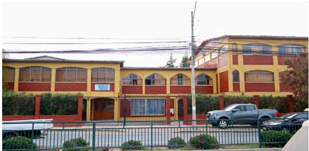
Desde el Colegio Florencia Nightingale afirman que los hechos de este tipo no son frecuentes.

El joven sostiene que “todas las semanas pasa algo malo”, lo que ha enrarecido el ambiente para la comunidad educativa, mientras que desde la dirección sostienen que esos hechos “no son frecuentes”. El Departamento Provincial de Educación intervino con revisión de protocolos.