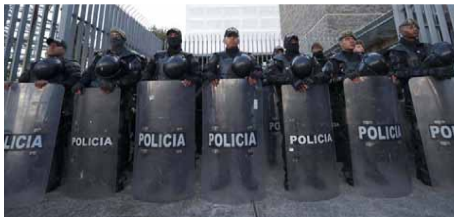
Policías vigilan los alrededores del Palacio de Carondelet, en Quito, capital del Ecuador.

El pasado miércoles, el presidente ecuatoriano Guillermo Lasso, disolvió la Asamblea Legislativa y llamó a elecciones anticipadas en medio de un juicio político por un presunto delito de malversación.