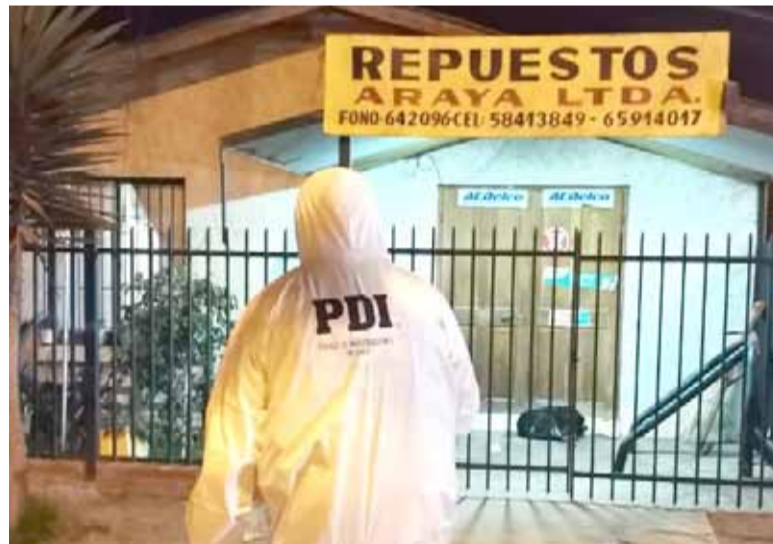
Tras el asesinato, personal de la PDI acordonó el lugar para realizar las diligencias balísticas respectivas.

El hombre, quien quedó herido de gravedad, fue auxiliado por Carabineros y personal del SAMU en el mismo lugar de los hechos para, posteriormente,