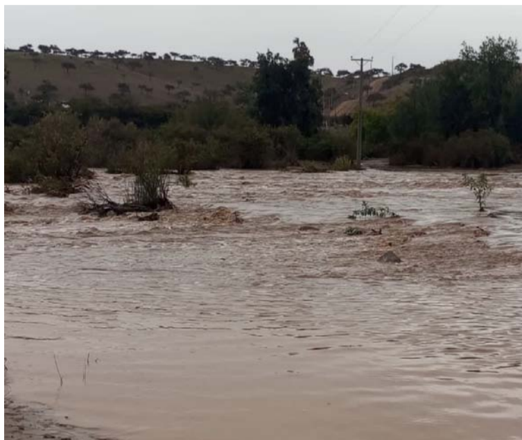
Quebradas y afluentes, como lo muestra la imagen de Camarico, se vieron nuevamente colmadas de agua luego de las precipitaciones que alcanzaron a la región.

La zona donde más precipitó fue en la provincia de Choapa, donde los sectores más afectados están en las zonas rurales. Autoridades destacan, de todas formas, que la lluvia es benéfica y que se superaron las situaciones más críticas trabajando en los lugares.