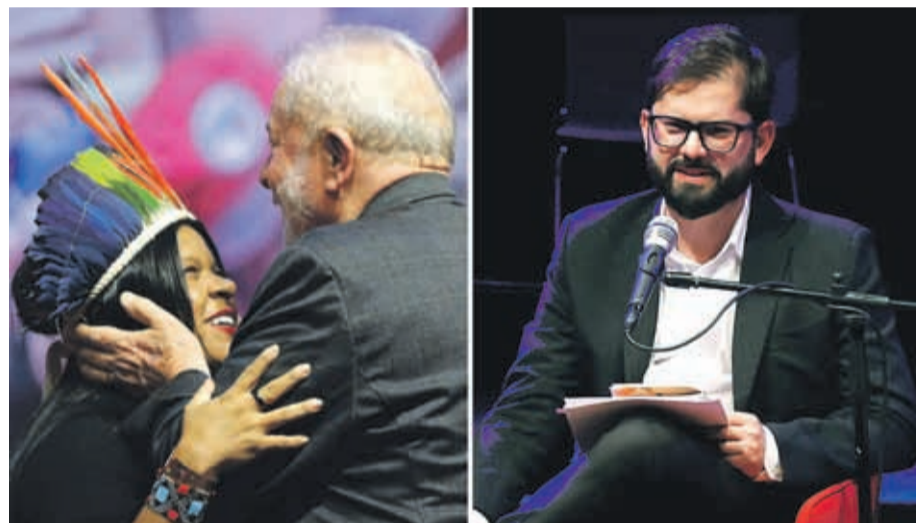
El presidente brasileño Luiz Inácio Lula da Silva de espaldas con la líder indígena Sonia Guajajara. A la derecha, el presidente de Chile, Gabriel Boric, en una imagen de octubre de 2022.

tenido el matrimonio más largo en la historia de la Corona británica: casi 75 años estuvo casada con el Duque de Edimburgo, -al que sin embargo nunca le concedió el título de rey consorte por su ascendencia alemana- hasta su fallecimiento, un año antes que ella, poco antes de cumplir 100 años.