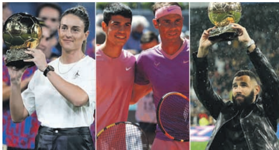
A la izquierda la capitana del Barça, Alexia Putellas, galardonada por segunda vez consecutiva como Balón de Oro, 2022; dos astros del tenis español y mundial, Rafa Nadal y Carlos Alcaraz y el delantero francés del Real Madrid, Karim Benzema, con el Balón de Oro.

Otro de los récords de Isabel II es haber