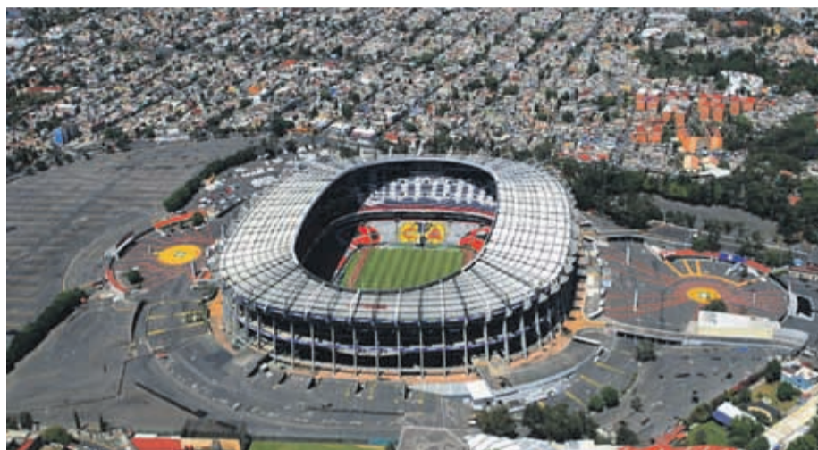
Fotografía de archivo del Estadio Azteca, en la Ciudad de México, que en 2026 se convertirá en el primer estadio que acogerá un Mundial por tercera vez.

que tomarán parte en la fase de clasificación de la CONMEBOL van a estar presentes con seguridad en el Mundial. Aun así, seguirá siendo complicado acabar entre los primeros puestos ya que la competencia y el nivel parece crecer cada vez más.