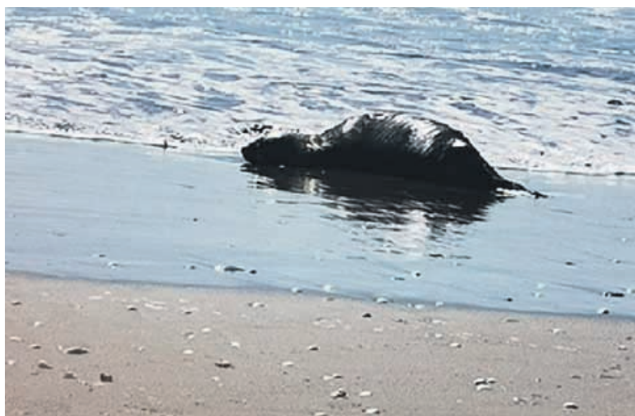
Vecinos de la Avenida del Mar indicaron que nadie se haría responsable del retiro del cuerpo del lobo marino.