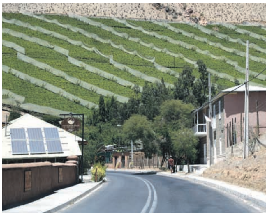
Agrícola El Cerrito lleva más de 20 años funcionando en el Valle de Elqui.

Acusaciones que, a través de un comunicado público, la empresa niega