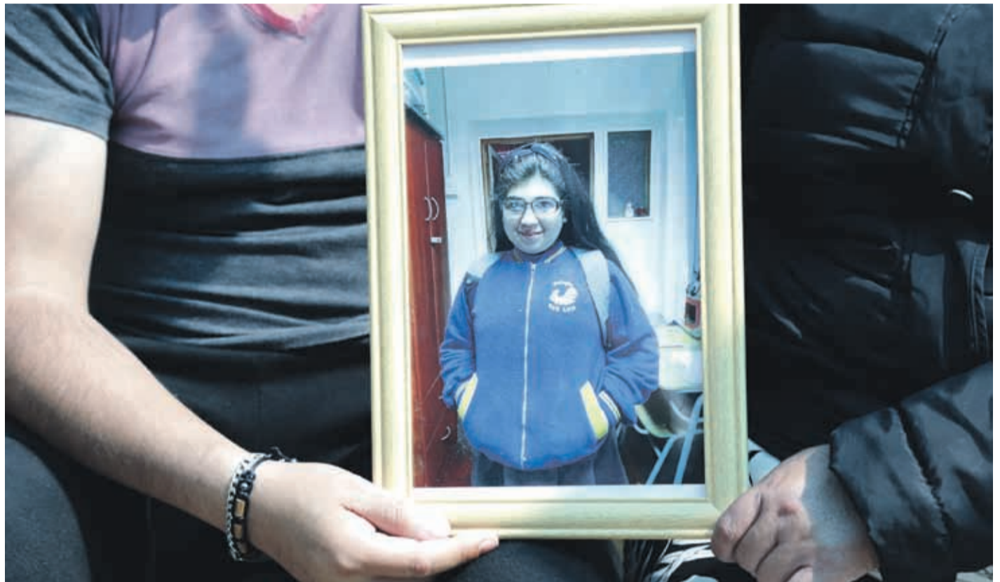
Sigue la espera por el juicio, mientras los imputados continúan en prisión preventiva.

En la fase actual, de investigación, la ley fija un plazo máximo de 2 años desde la formalización