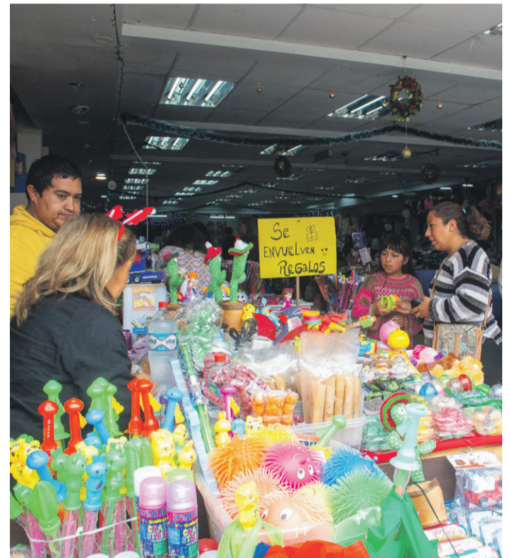
Muchos compradores de La Serena y Coquimbo esperan hasta el último momento para adquirir sus regalos de Navidad.