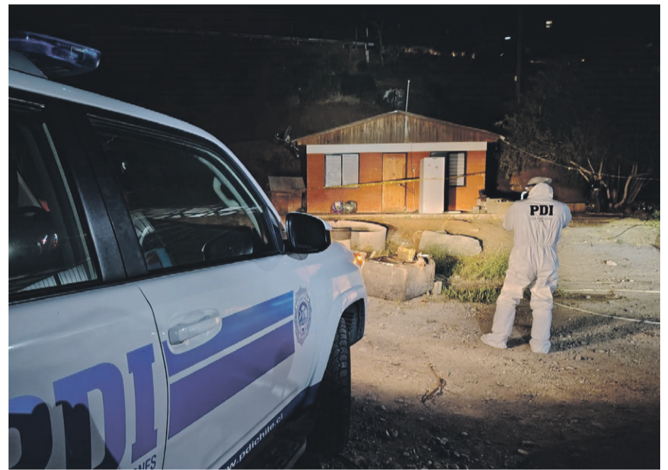
La Policía de Investigaciones se encuentran realizando las investigaciones por la muerte de dos personas en un domicilio particular.

informó que las diligencias incluyen el levantamiento de evidencia en el sitio del suceso, empadronamientos y en-