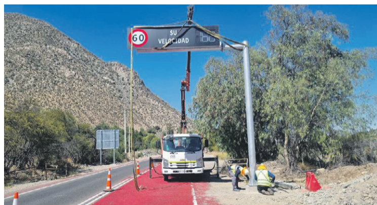
Desde hace unos días se encuentran instalando los radares en la zona.

tamos muy satisfechos y contentos de cumplir este compromiso que asumimos como Ministerio durante el gobierno del presidente Boric, de poder mejorar la seguridad vial de la concurrida ruta 41CH. En este sentido, y sumado al trabajo que se está realizando para construir la doble vía en dicha ruta, partiendo por los primeros 3,9 kilómetros en el sector aeropuerto, también hemos realizado grandes obras de seguridad vial en diversos puntos. Por ejemplo, se han construido pistas de aceleración y desaceleración en cruces que se