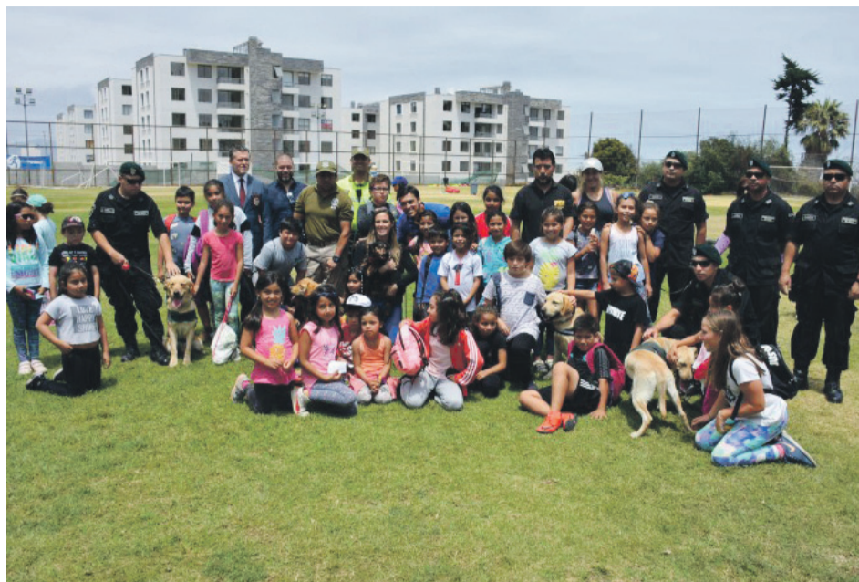
La iniciativa busca generar espacio para las mascotas y promover su tenencia responsable.

incluirá la jornada que fue difundida este miércoles por las autoridades a los niños y