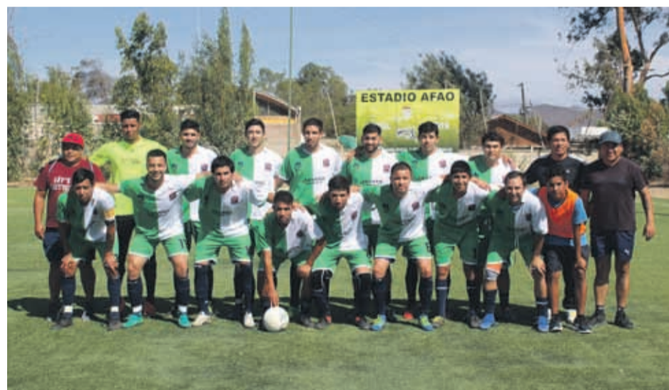
Caupolicán comenzó ganando su participación en la Copa de Campeones. El equipo "Oro y Cielo" solo piensa en seguir logrando victorias que lo lleven a lo más alto.