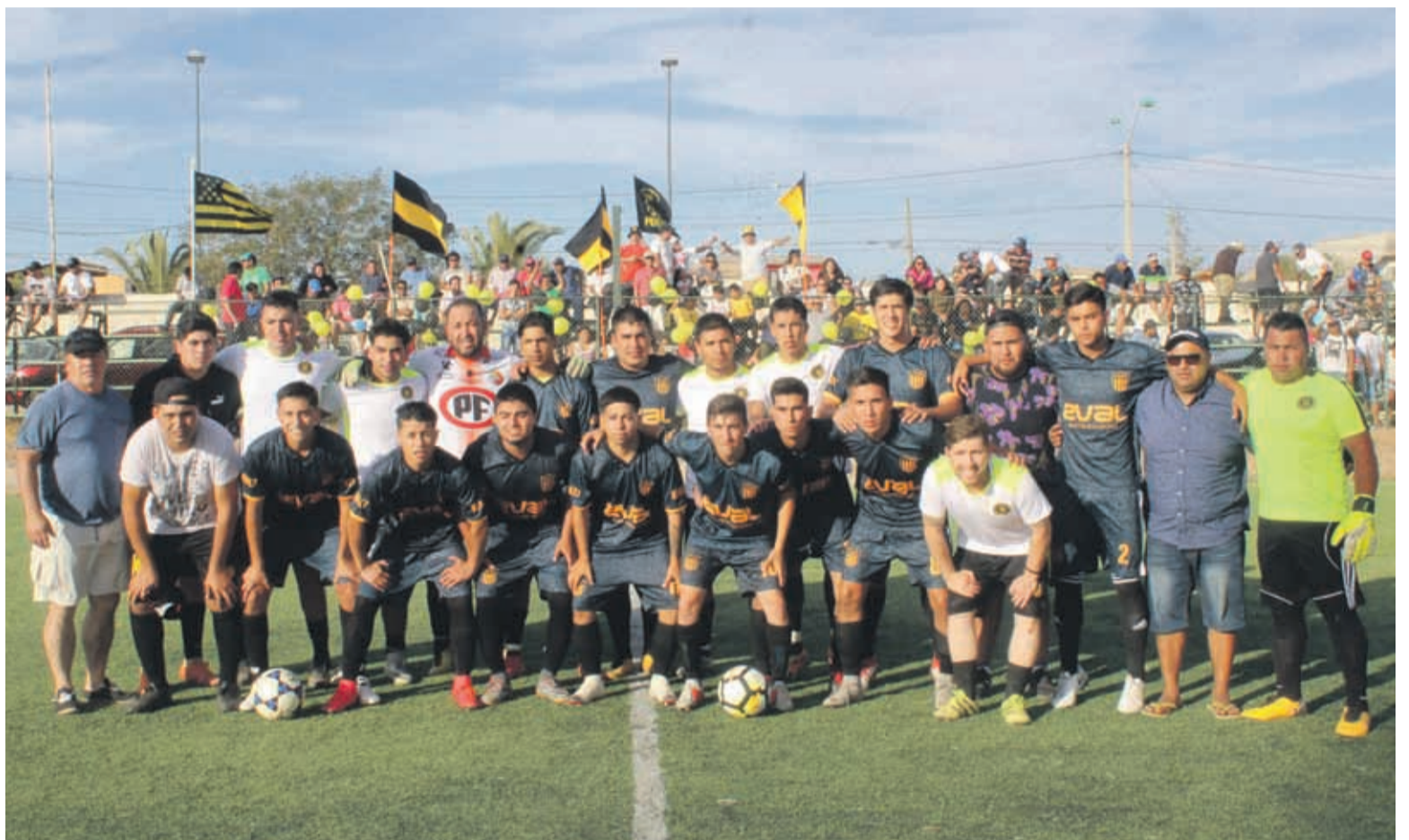
El Club Peñarol no jugó solo en Ovalle. Su fiel hinchada los acompañó y disfrutó del triunfo 2-0.

Los cuadros de la Asociación Serena Norte se impusieron por 2-1 y 2-0 sobre Unión Tangué y Mirador Oriente, respectivamente. Ahora, buscarán cerrar en casa su paso a la próxima fase.