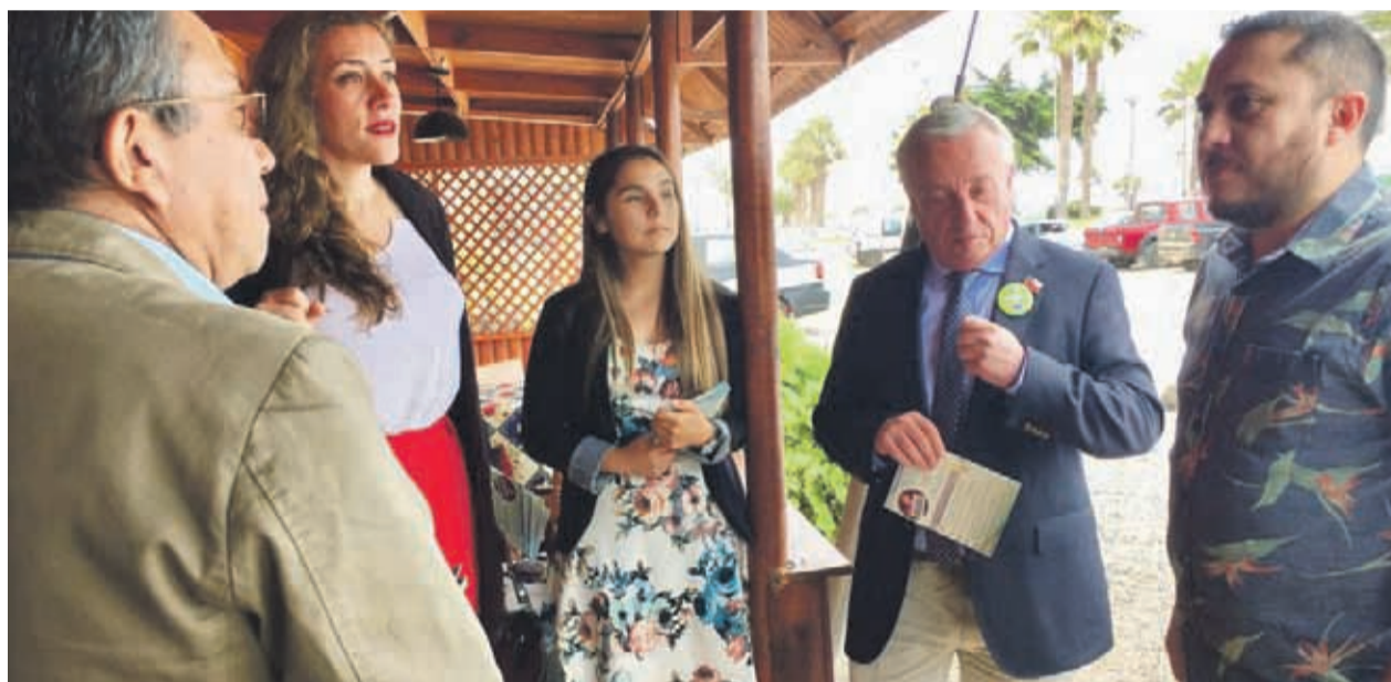
La ley de Modernización Tributaria busca incentivar la inversión, el ahorro y el empleo.