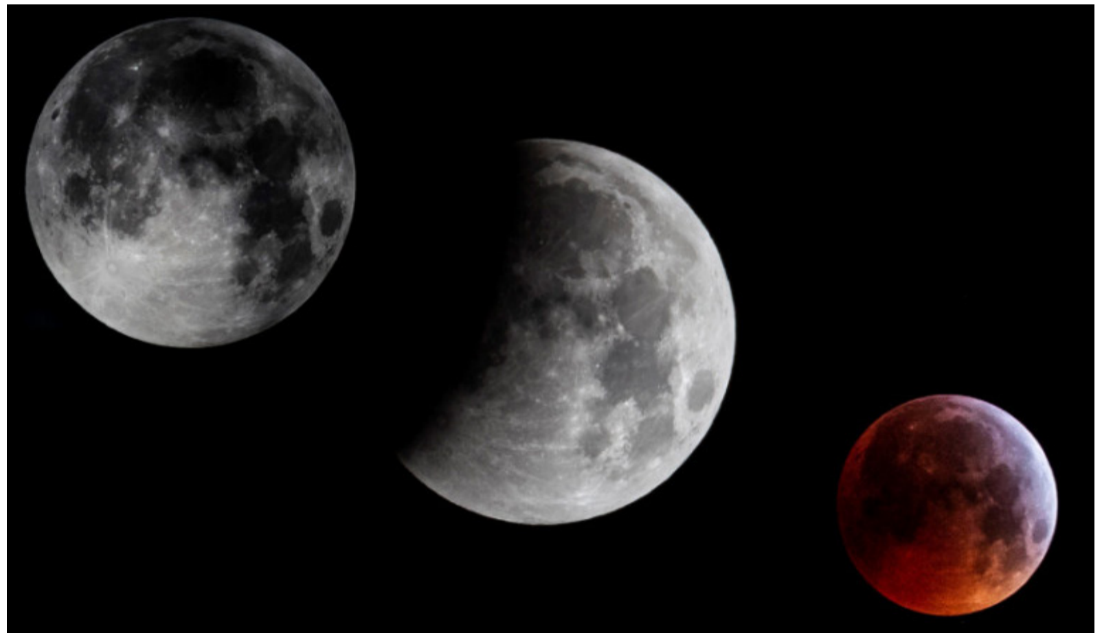
Con visitas, charlas, yoga y orientación, se vivió un paseo nocturno para disfrutar de la Luna Roja

Olivares se encarga de matizar con narraciones poéticas