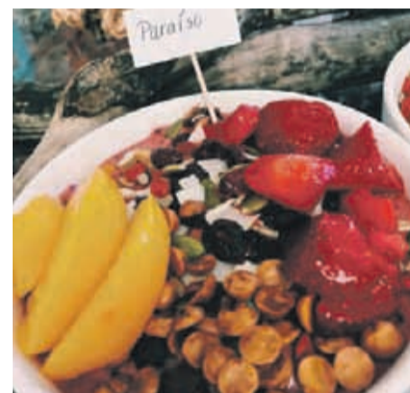
Helados y postres hechos sobre la base de fruta congelada es el producto que comercializan.