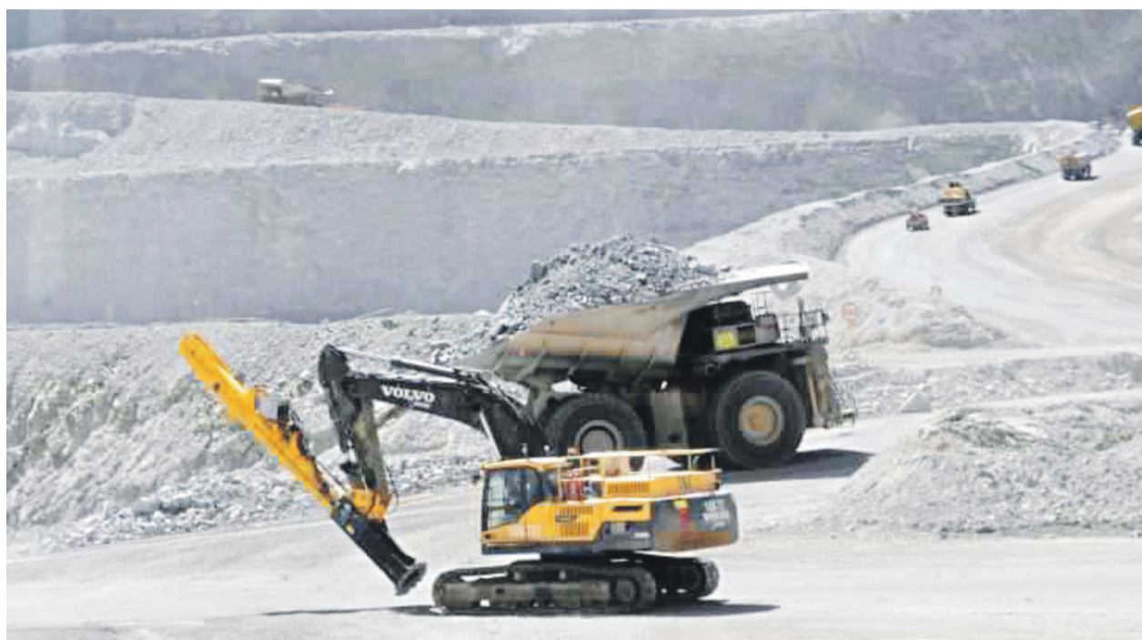
Compensaciones e incentivos son dos ideas que ha venido trabajando el gremio, a través de su Comisión de Patrimonio y con la idea de darle nuevos aires a la zona típica de La Serena.

El grupo minero anotó una producción de 725 mil toneladas de cobre fino en 2018, superando el máximo histórico logrado en 2013, cuando alcanzó las 721.000 toneladas. Junto con destacar los resultados obtenidos, Iván Arriagada, presidente ejecutivo de la firma, comentó que proyectan un nuevo aumento de producción en 2019.