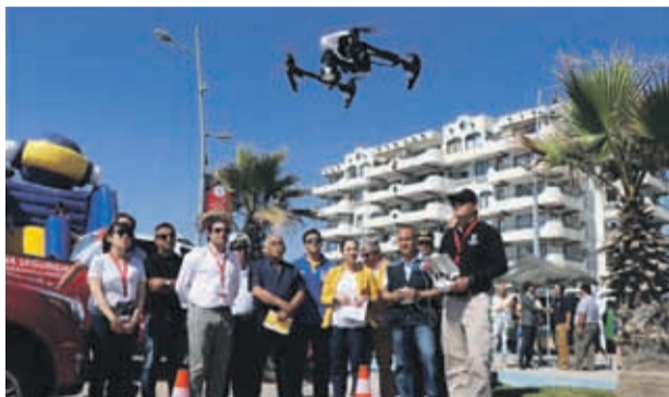
En la oportunidad, funcionarios del municipio serenense mostraron la tecnología con la que se cuenta para mejorar la seguridad en la zona.