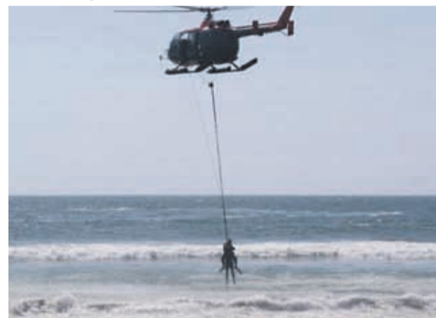
Personal de La Armada, realizó un simulacro de rescate por inmersión en el borde costero.