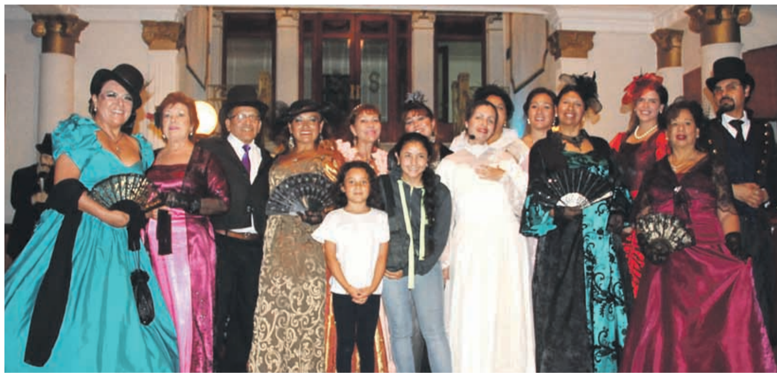
CON ALGUNOS TOQUES de color invocando la época precolombina, las candidatas desfilaron por la pasarela y saludaron al público presente ayer en la plaza.

UNA IMPERDIBLE VISITA GUIADA EN FORMA NOCTURNA