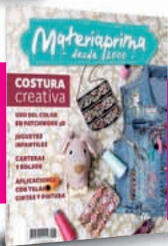
Revista Materia Prima

Por un monto adicional puede elegir una de estas tres promociones: