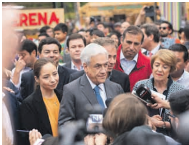
La ministra (a la derecha) acompañó al Presidente Sebastián Piñera en su visita a la zona tras el violento sismo para verificar en terreno los daños.

“Para estos casos se ha estudiado mucho el comportamiento del adobe. Hoy día se sabe que el adobe es muy resistente en la medida que se esté revisando. Además hoy también existen muchos elementos que permiten mantener compactos los