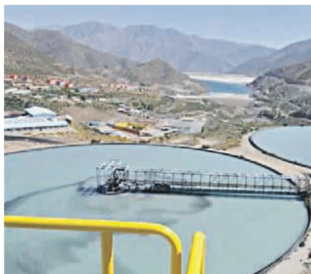
Con relación a los subproductos , Antofagasta Minerals estima producir entre 240.000 y 260.000 onzas de oro y 11.500 a 12.500 toneladas de molibdeno.

Minerals fijó una meta más ambiciosa aún, la de producir más de 750.000 toneladas de cobre. “Hemos seguido