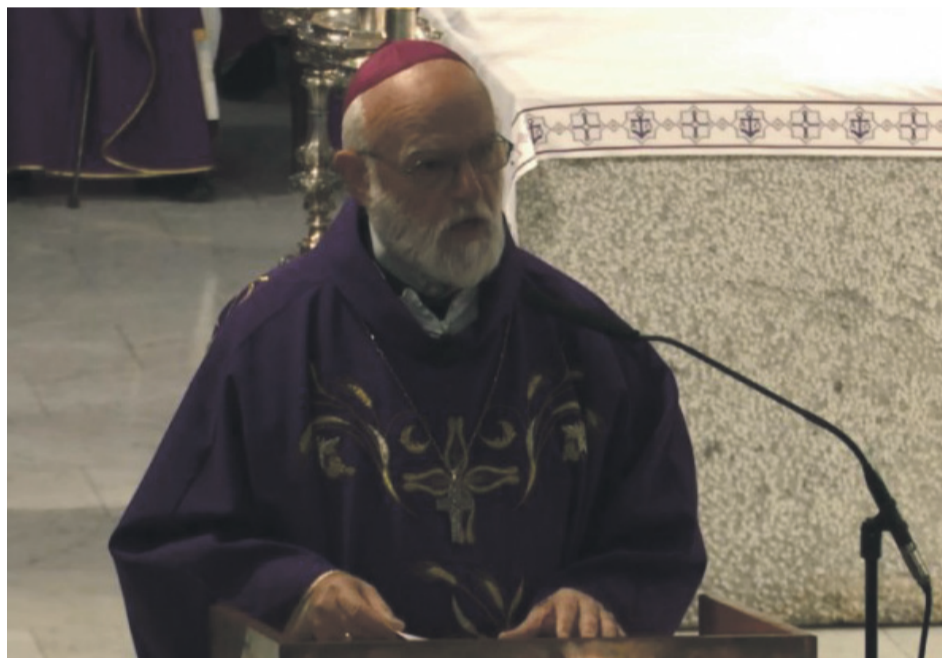
Con una misa realizada en la Catedral de Santiago asumió como administrador apostólico.

Ezzati, de 77 años, es uno de los obispos más influyentes de la Iglesia chilena y ha sido muy