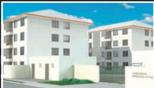
Brisas de La Florida III