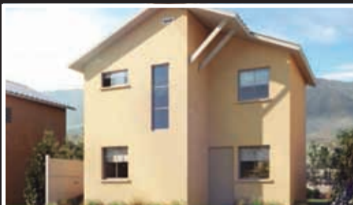
Brisas de La Florida IV