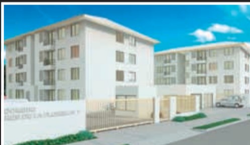
Aires de La Florida IV - V