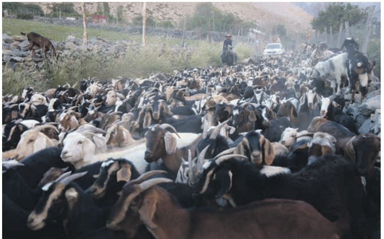
Los crianceros recorren más de 45 kilómetros con dirección la cordillera durante las veranadas.

Los crianceros atraviesan un camino de tierra, angosto y serpenteante, y de vez en cuando se encuentran con una casa de adobe, de algún inhóspito habitante de la comuna.