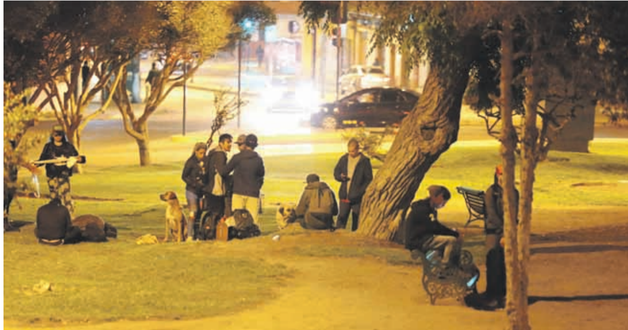
En la Plaza Buenos Aires también se estarían produciendo problemas de inseguridad, consumo de alcohol y drogas. Algo que admiten desde Carabineros.

De hecho, la plaza se estaría prestando para encuentros sexuales pagados, que nada tiene que ver con la pareja. Otras personas estarían utilizando el espacio para concretar sus citas.