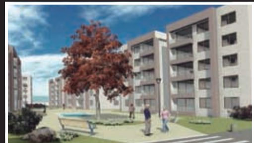
Cumbres de La Chimba