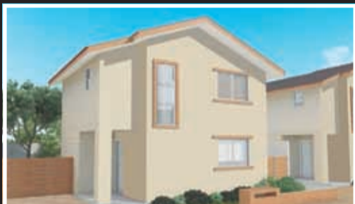
Brisas de La Florida II