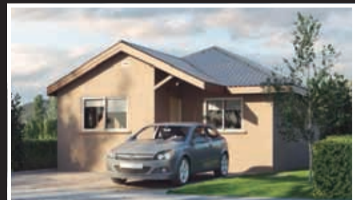
Faldeos de La Florida I