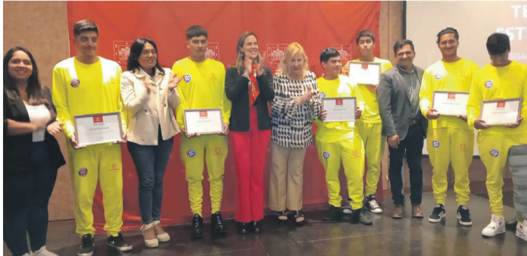
En una ceremonia realizada en el Hotel Serena Club Resort, la alcaldesa de La Serena agradeció el trabajo realizado por todo el personal municipal y el sector privado durante la pasada temporada estival.

Un verano con cifras récord y una estrategia integral permitieron consolidar a la comuna como uno de los destinos turísticos más importantes del país.