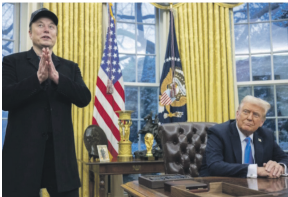
En febrero pasado, el presidente de Estados Unidos, Donald Trump, firmó una orden ejecutiva para otorgar más poder a Elon Musk.

El diario neoyorquino señala que algunos empleados de SpaceX que trabajan