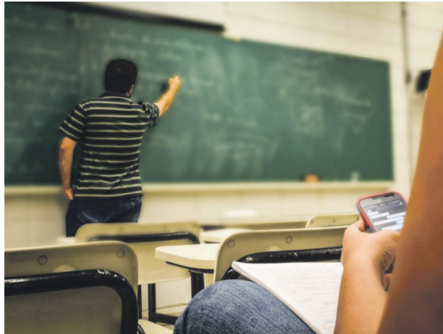
Expertos locales aseguran que la agresión que sufrió la profesora en la Región del Ñuble revela diversas problemáticas que socavan el sistema educacional.

Según datos de los años 2022 y 2023 existen 46.798 personas autistas en el sistema educativo, 42.945 en