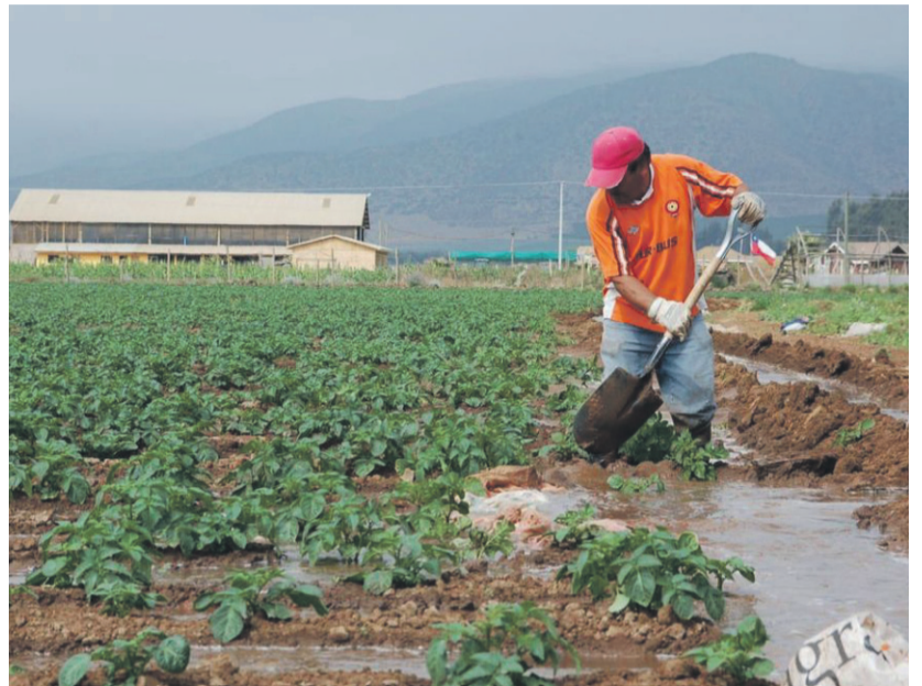
Complejo es el panorama que se vive hoy en el mundo rural a raíz de los hechos delictuales que le afectan.

esta Primera Encuesta de Robo Agrícola, señala que un 80% de los participantes ha sido víctima de robos en los últimos 12 meses, y un 40% ha sufrido tres o más delitos en el mismo período.