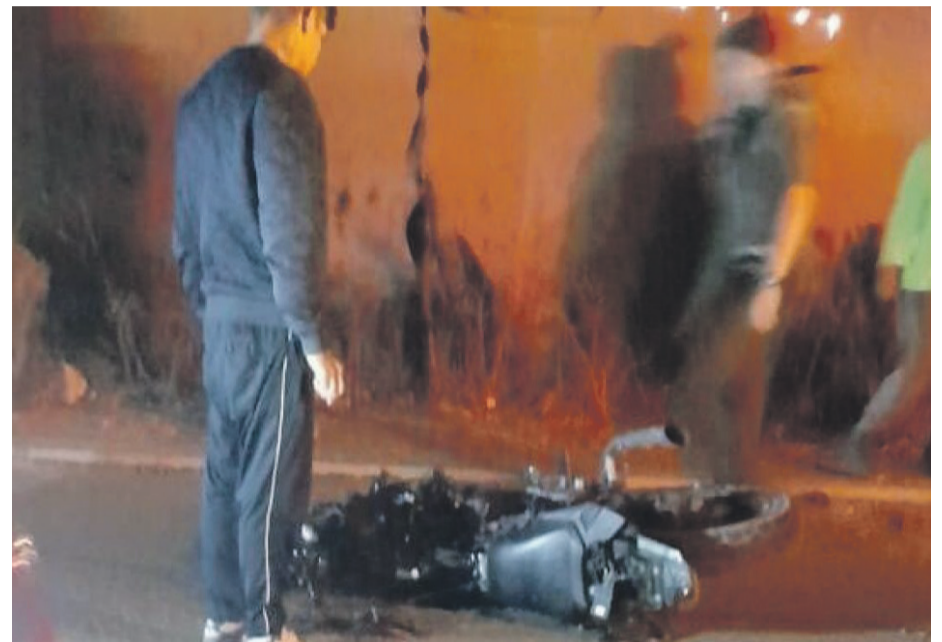
Imagen del estado en que quedó la motocicleta que fue impactada por otro vehículo, accidente que le costó la vida a su conductor.

De acuerdo a lo señalado por fuentes policiales, el siniestro ocurrió en la