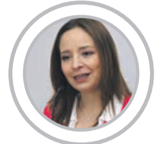
LUCÍA PINTO Intendente

"Hay que ser prudentes, hay que hacer las cosas paso a paso y no podemos correr el riesgo dada la inversión que esto significa, de enfrentarnos a sobrecostos que puedan sobrepasar lo normal"