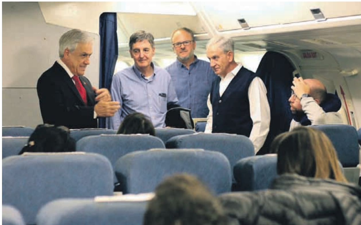
El mandatario viaja junto a una comitiva de empresarios de diversos rubros.