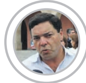
MANUEL FUENZALIDA Diputado UDI

"Acá se buscan excusas para no avanzar y lo que hay que hacer es transparentar, que diga claramente Sebastián Piñera, si el gobierno actual tiene o no voluntad de hacer este proyecto"