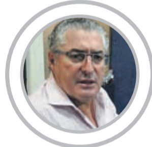
JORGE PIZARRO senador DC

Pero a juicio de los parlamentarios de oposición, todos los