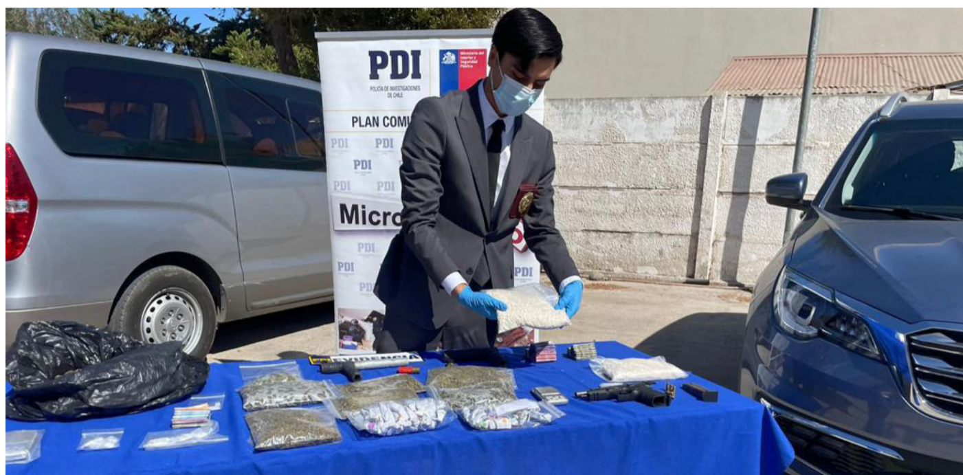
La imagen corresponde a la droga, dinero y vehículos incautados en el operativo.