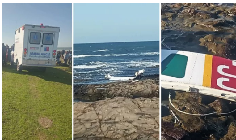
Las causas del siniestro deberán ser investigadas.