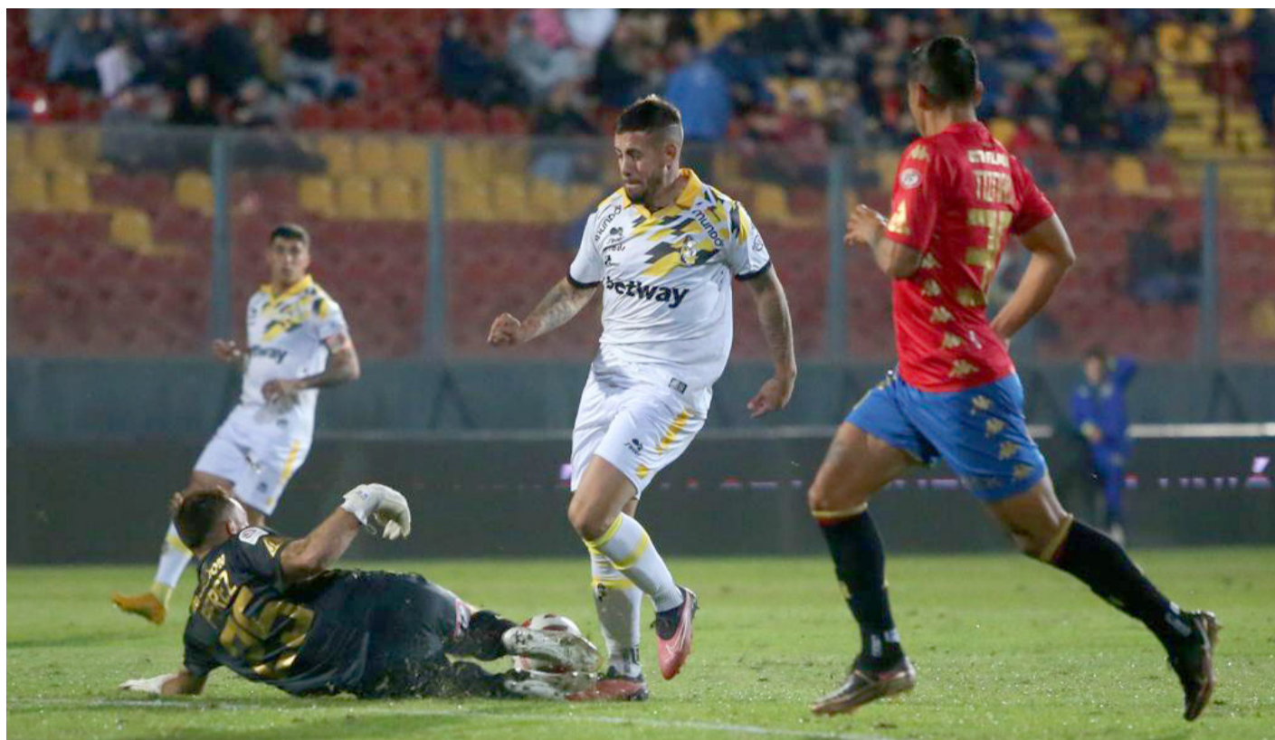
Coquimbo Unido no pudo mantener su buena racha, y terminó cayendo ante Unión Española.

Coquimbo Unido visitó el Estadio Santa Laura para enfrentar a la Unión Española en el cierre de la onceava fecha de la primera división nacional. Los resultados de los otros juegos ilusionaban a los hinchas "piratas", ya que de vencer a los hispanos quedaban como líderes del campeonato junto a Huachipato. El anhelo no era descabellado, pensando que el conjunto aurinegro venía de celebrar cinco triunfos consecutivos.