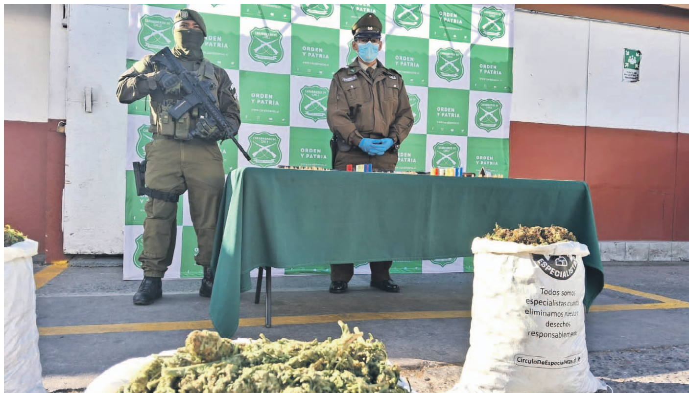
Varios son los operativos que han desarrollado Carabineros y la PDI durante las últimas semanas.