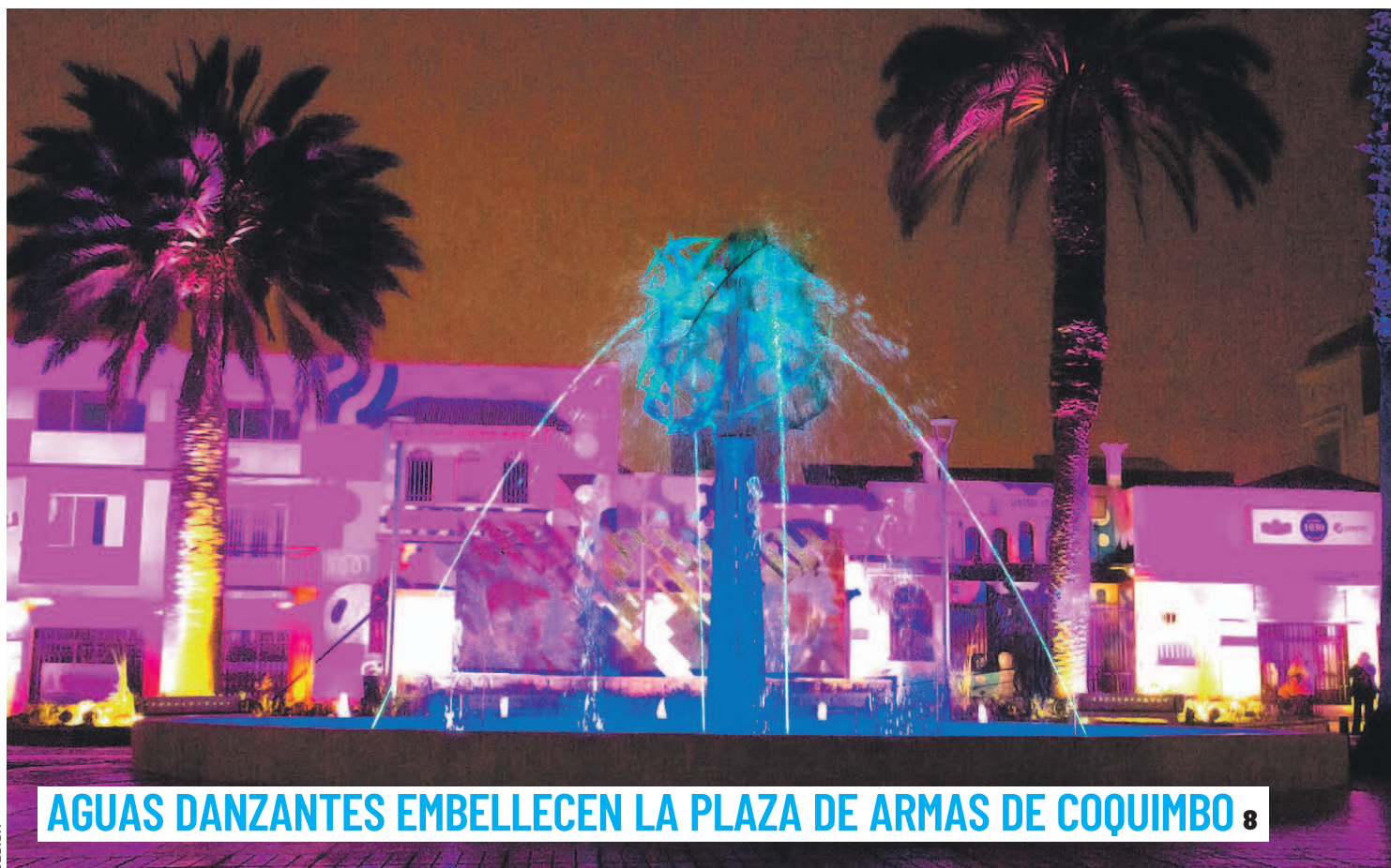
AGUAS DANZANTES EMBELLECE LA PLAZA DE ARMAS DE COQUIMBO 8