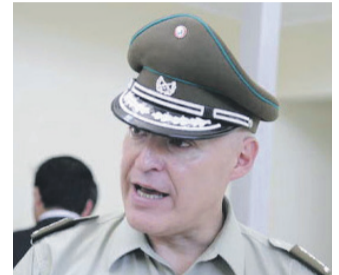
GENERAL JORGE TOBAR