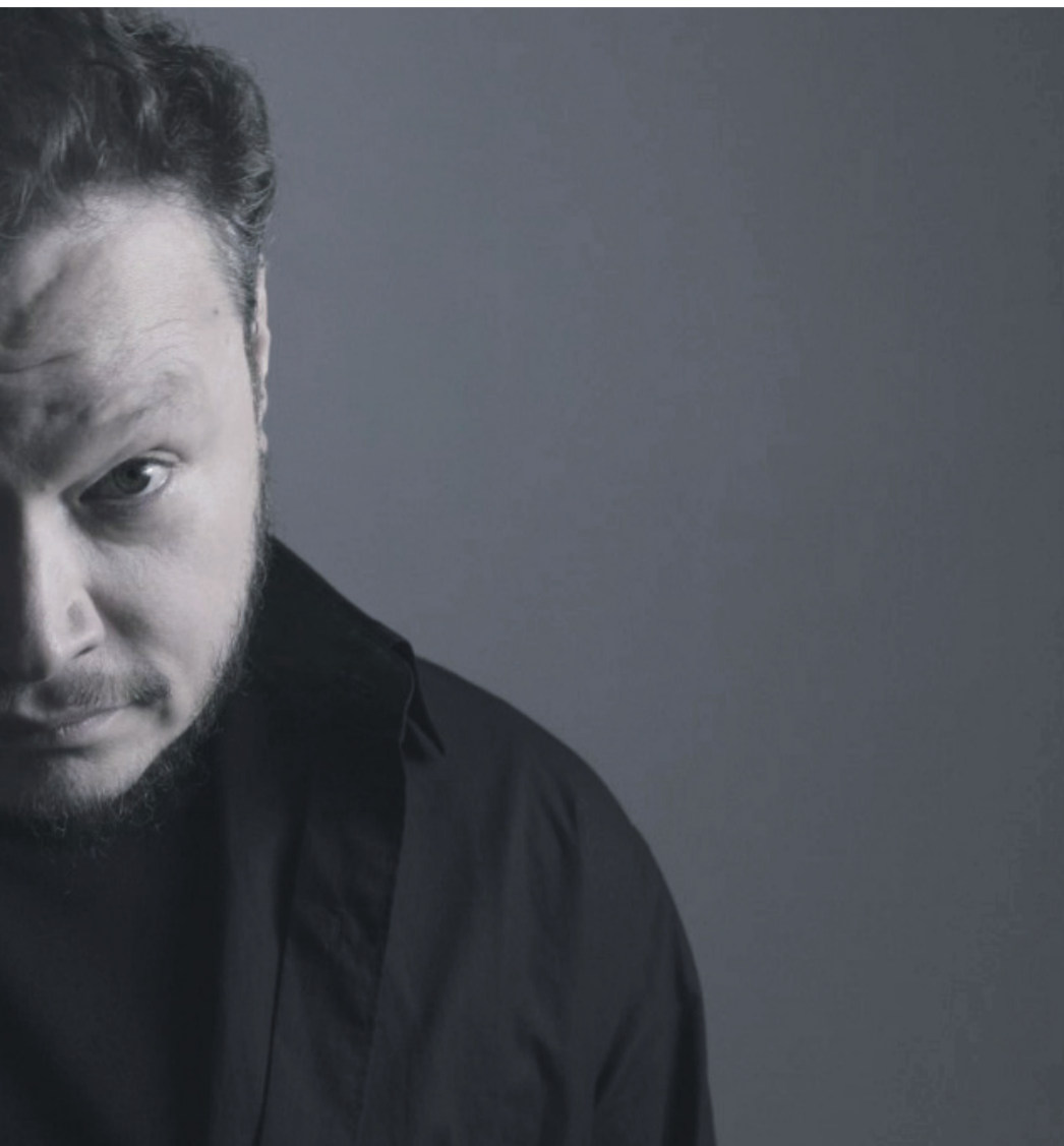
, Thalía y Ha* Ash, además de los clásicos de Sin Bandera, es estrenar cada mes una nueva canción.