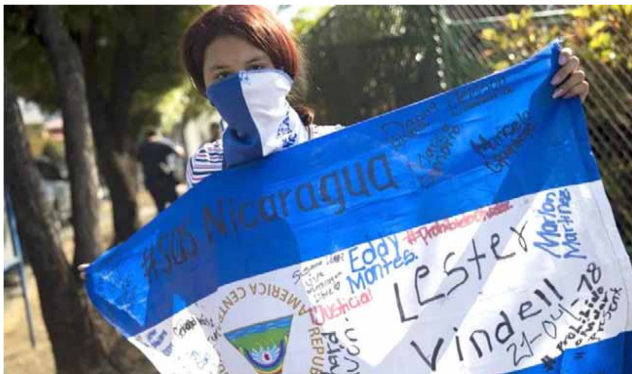
En 2021, Nicaragua decidió retirarse de la OEA, luego que se cuestionara la legitimidad de las elecciones que le dieron la reelección a Daniel Ortega.

Los países miembros instruyeron al organismo a considerar "todas las acciones adicionales" que puedan conducir a un "ejercicio efectivo" de la democracia en el país centroamericano.