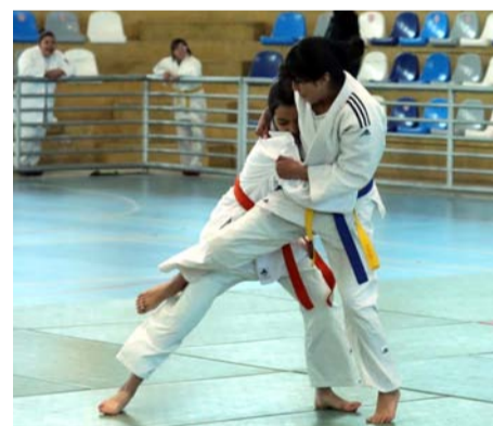
En la serie femenina seis serán las deportistas que estarán compitiendo en la fase nacional.

son las instancias regionales donde el deporte hace gala en cada una de las regiones en la etapa escolar. Aquí lo importante es poder tener en consideración la educación, la inclusión y por supuesto, un aspecto importante que tiene que ver con lo valórico”, resaltó.