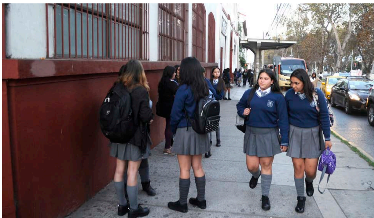
La educación municipal está siendo traspasada a un nuevo sistema denominado Servicio Local de Educación Pública, SLEP, un proceso que no ha estado ajeno a los conflictos.

De esta forma, en el año 2022, se conformó el Comité Directivo Local, se