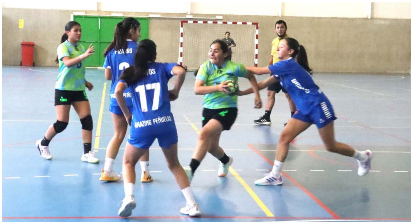
El balonmano es una de las disciplinas que más se ha desarrollado a nivel escolar, creciendo en su práctica en el plano provincial, de manera especial en Elqui, que busca romper con la superioridad que ha mostrado en el último tiempo Limarí.

En el marco de la serie Sub 14 de los Juegos, el representativo de Coquimbo alzó la corona en la fase regional de la competencia que se desarrolló en Ovalle, timbrando así, los pasajes a la cita nacional de octubre próximo.