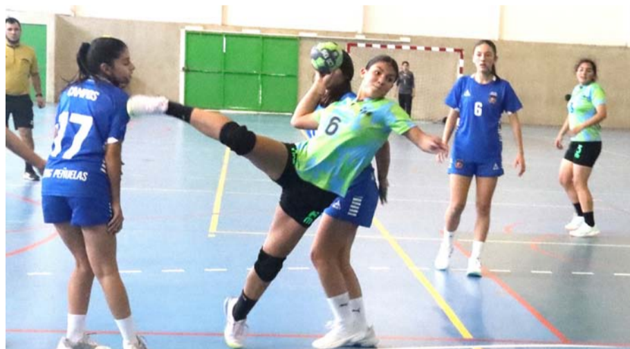
El Amazing Grace de Peñuelas marcó una clara diferencia con el resto de los elencos en la Región de Coquimbo. Ahora ya comienza a prepararse para el Nacional.

El torneo se desarrolló en la modalidad "todos contra todos", imponiéndose finalmente, en ambas series damas y varones, el representativo de