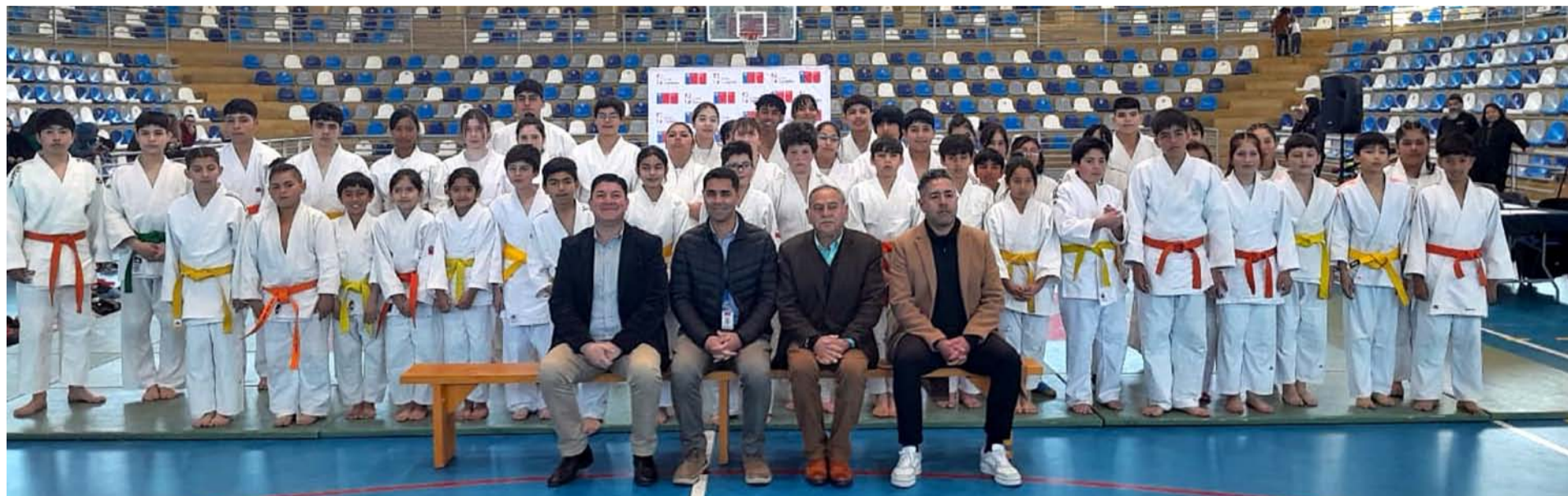
Las autoridades que aparecen en primer término, destacaron la importancia de entregar a los escolares la posibilidad de fortalecer las actividades deportivas.