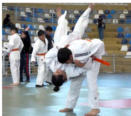
Interesantes combates se observaron en la definición regional del judo, cuyos ganadores se medirán en octubre con los mejores de Chile.