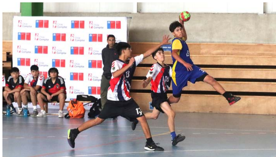
La final de la categoría varones mostró fuerzas muy parejas entre el Amazing Grace y su similar del San Jun Bautista de Ovalle.