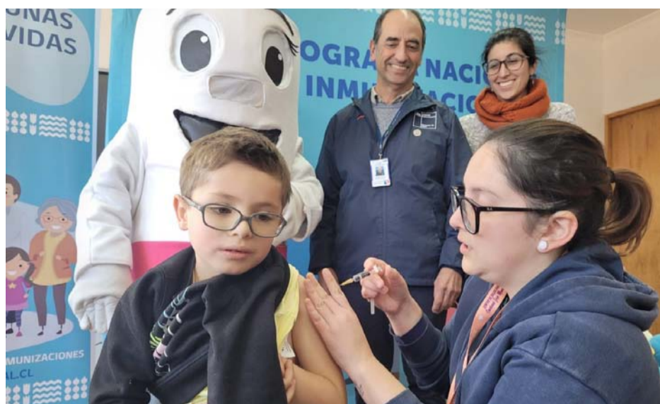
Se espera que casi 50 mil niños sean vacunados durante este año.

“A partir de este año estamos administrando una vacuna nueva que se llama Gardasil 9 o VPH nonavalente, que protege contra nueve cepas del virus papiloma humano, y además, se administra en una sola dosis. Tenemos las expectativas que ahora los niños/