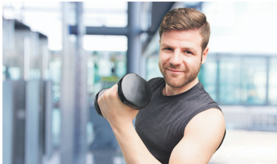
El ejercicio físico es considerado vital para mantener una salud mental adecuada.