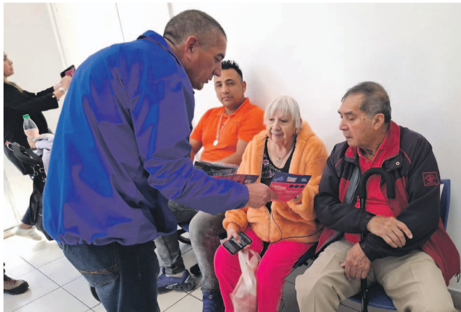
Como una forma de poder prevenir delitos entre los adultos mayores, desde el municipio de La Serena hicieron entrega de alarmas personales.

Uno de los delitos más comunes que afecta a este sector de la población es la sustracción de sus pensiones, hechos en los que, frecuentemente además, los delincuentes ejercen violencia física en su contra, provocándoles graves lesiones que, en muchos casos, les dejan secuelas graves.