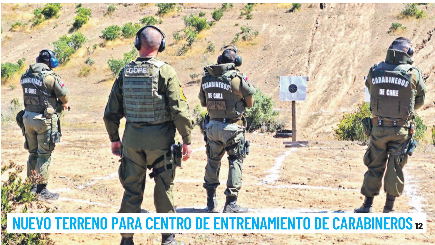
NUEVO TERRENO PARA CENTRO DE ENTRENAMIENTO DE CARABINEROS 12