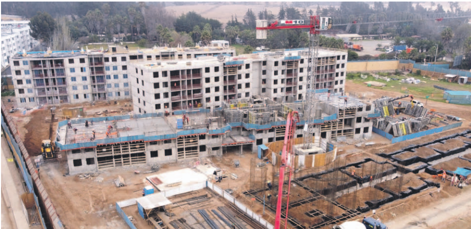
En las comunas de La Serena, Coquimbo y Ovalle el mercado inmobiliario mantiene un bajo dinamismo, sobre todo, respecto a inicio de nuevos proyectos.

En ese contexto, en su versión número 16, el Catastro Inmobiliario 2025 —iniciativa del Comité Inmobiliario y Vivienda de la CChC La Serena, desarrollada por su Unidad de Estudios— muestra que en las comunas de La Serena, Coquimbo y Ovalle el mercado mantiene un bajo dinamismo,