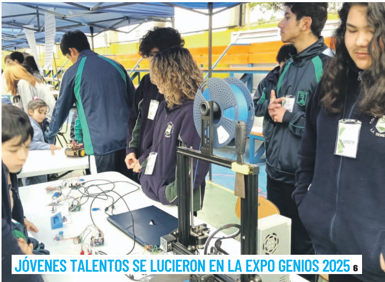
JÓVENES TALENTOS SE LUCIERON EN LA EXPO GENIOS 2025 6