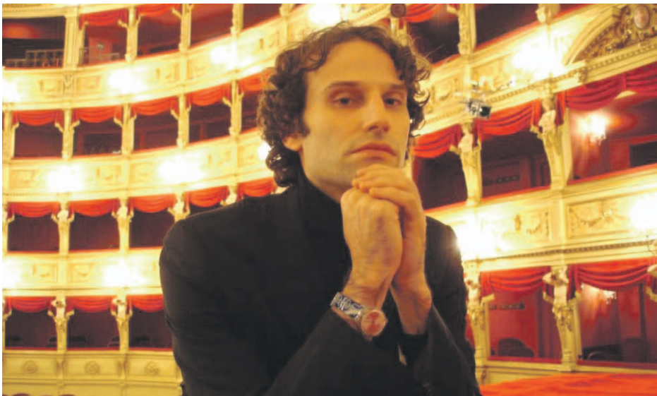
David Greilsammer es uno de los pianistas más destacados de su generación.

publicado por el sello francés Naïve, ha recibido más de diez premios internacionales y ha sido descrito por la crítica como “radical, valiente e impresionante”. El artista llega se presentará en La Serena en una gira que incluye conciertos junto a la Orquesta Sinfónica Nacional de Chile. Las entradas estarán disponibles a través de www.ticketplus.cl desde $5.000 a $10.000.