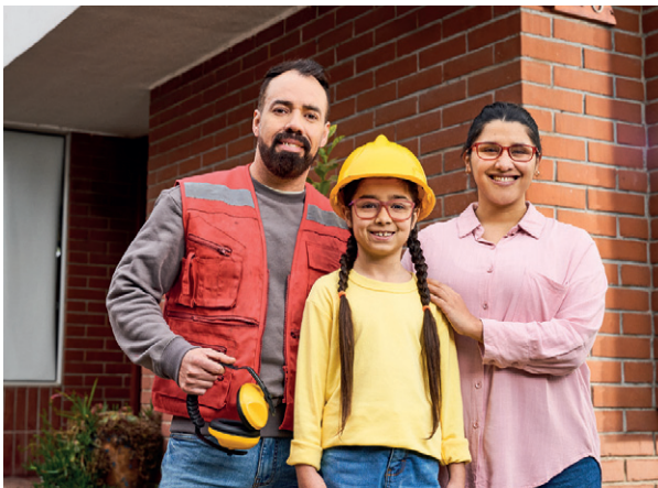
La nueva campaña institucional destaca cómo estos programas generan oportunidades para el trabajador y su familia.

Vincular a las empresas con programas sostenibles que fomenten un entorno laboral moderno y flexible, mejorando así el estándar de toda la industria.