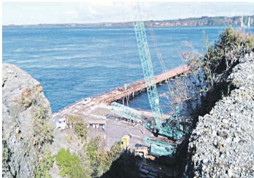
La empresa Hyundai anunció este lunes la paralización de las obras.

Anteriormente, indicó, se amplió el período de ingeniería de 1 año a