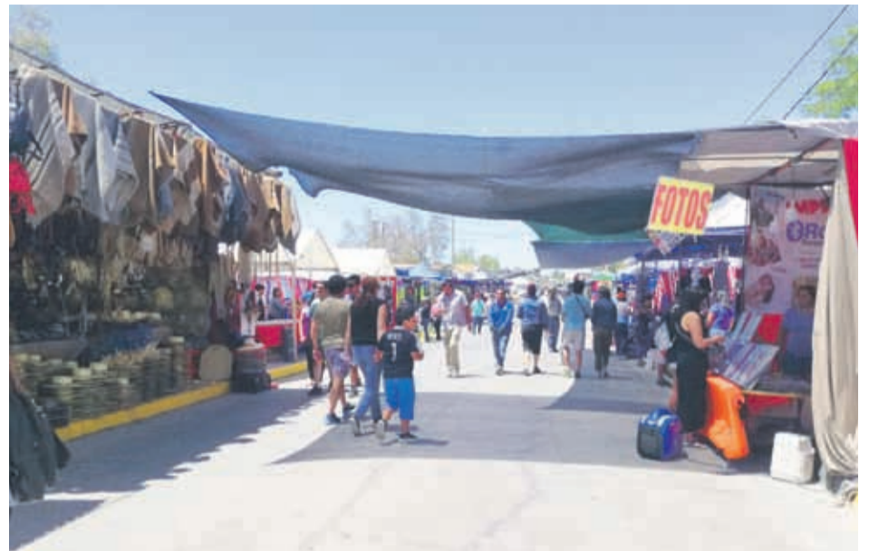
CANAL ANDACOLLO TV

La basílica permanecerá cerrada y las actividades religiosas se concentrarán en la iglesia chica, donde se oficiarán misas y se recibirá a los visitantes.