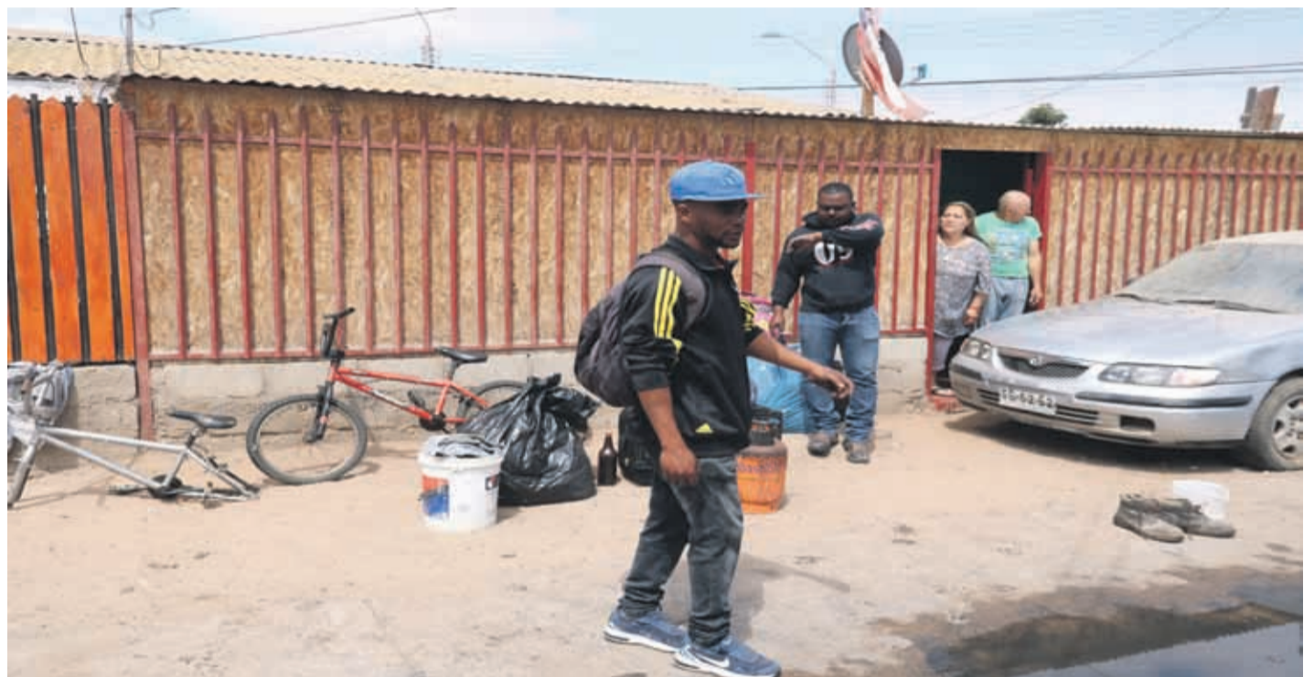
La emergencia movilizó a voluntarios de Bomberos de la sexta y octava compañía