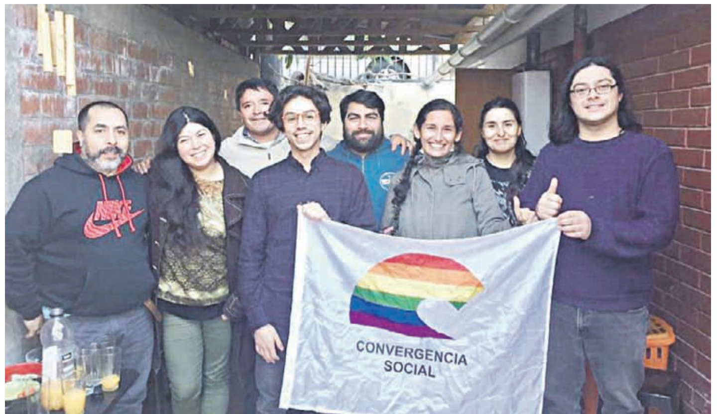
El partido frenteamplista desarrolla un intenso trabajo territorial en el país. En las tres provincias de la región lo han hecho bajo tres ejes, salud, educación y acceso al agua.