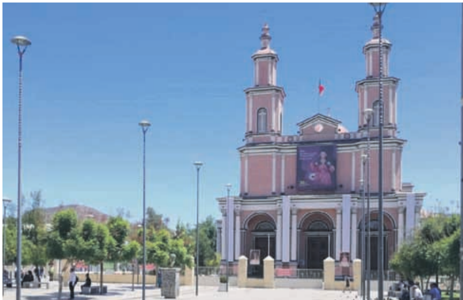
CANAL ANDACOLLO TV

La basílica permanecerá cerrada y las actividades religiosas se concentrarán en la iglesia chica, donde se oficiarán misas y se recibirá a los visitantes.