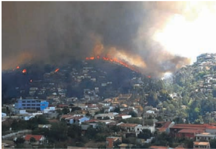
Se trata de las poblaciones Cuesta Colorada y La Isla, donde Bomberos se encuentran trabajando para evitar que las llamas se acerquen a las viviendas.

Se decretó el acuartelamiento de Bomberos en Valparaíso y Viña del Mar producto de la emergencia.