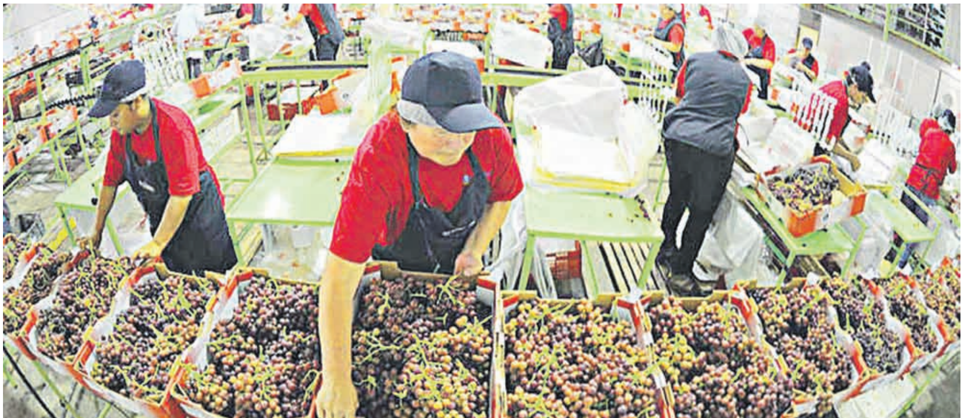
En un 1,5% se espera que aumenten los envíos de uva de mesa desde la región de Coquimbo al extranjero.

Por su parte, el Índice General de Precios de Acciones (IGPA) presentó una disminución de -0,21% y cerró en 23.563,91 puntos.