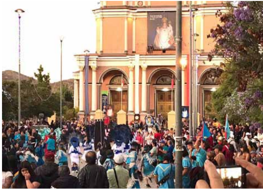
Bajo el lema de “Virgen de Andacollo, un regalo para Chile”, la Fiesta Grande de Andacollo 2023 es la segunda que se realiza desde que terminaron las restricciones sanitarias.

Cofré destaca la variedad de locales para almorzar y la buena oferta de