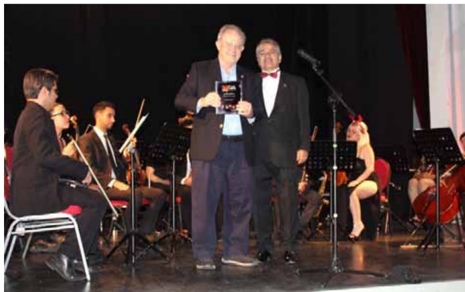
El exintendente Felipe del Río recibió un reconocimiento por su apoyo al proyecto musical.