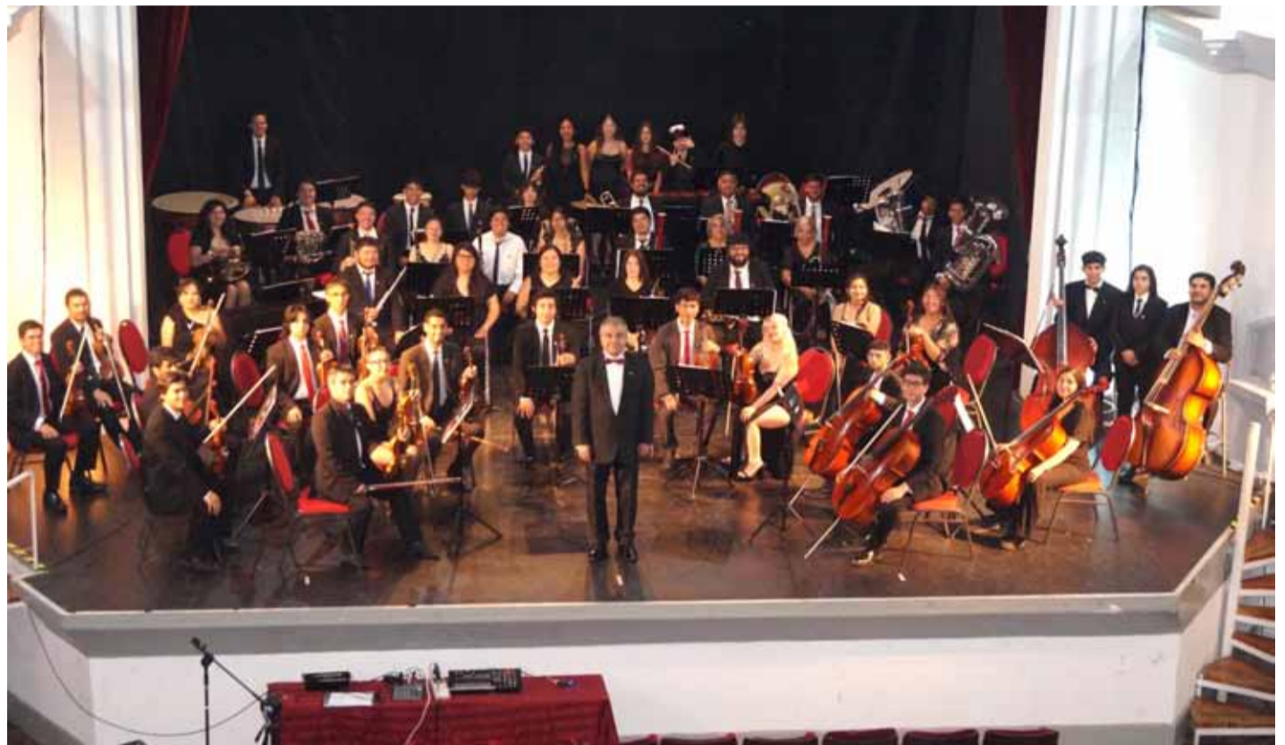
El concierto de gala por el aniversario número veinte se realizó en el Teatro Municipal de La Serena.

“Este día quedará marcado en la historia de nuestra orquesta. Estoy muy emocionado y muy feliz por los resul-