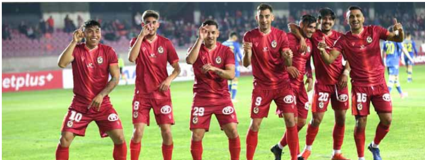
Pasa el tiempo y CD La Serena no da señales respecto de la conformación de su plantel y cuerpo técnico para la temporada 2024.