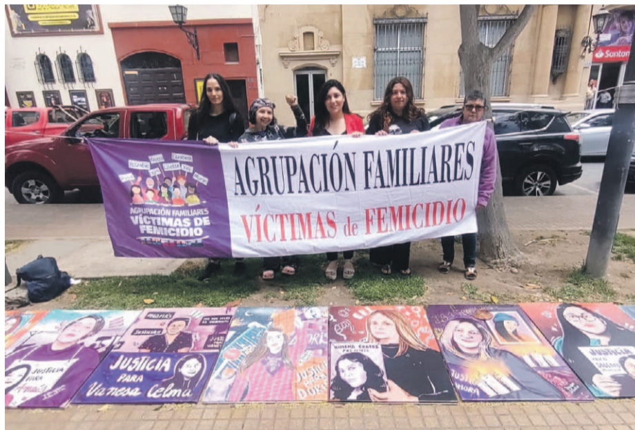
La Agrupación de Familias de Víctimas de Femicidios han efectuado diversas manifestaciones para dar visibilidad a la violencia de género que muchas mujeres sufren.

A esto se suman los femicidios frustrados, que evidencian un patrón preocupante. De hecho, hasta diciembre de este año, se han registrado 11 casos, reflejando la persistencia de este tipo de violencia contra las mujeres. Los familiares de las víctimas insisten en la necesidad de un rol más proactivo por parte del gobierno y exigen el endurecimiento de las penas para los agresores.