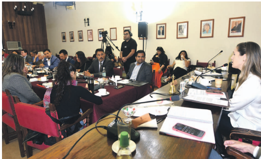
El concejo municipal conoció de manera preliminar los resultados de la auditoría realizada por la nueva administración a la corporación municipal.

En una sesión extraordinaria del concejo municipal de La Serena realizada ayer, se entregaron diversos antecedentes de la grave situación que vive la Corporación Gabriel González Videla, los cuales fueron revelados por un preinforme de auditoría que realizó la nueva administración.