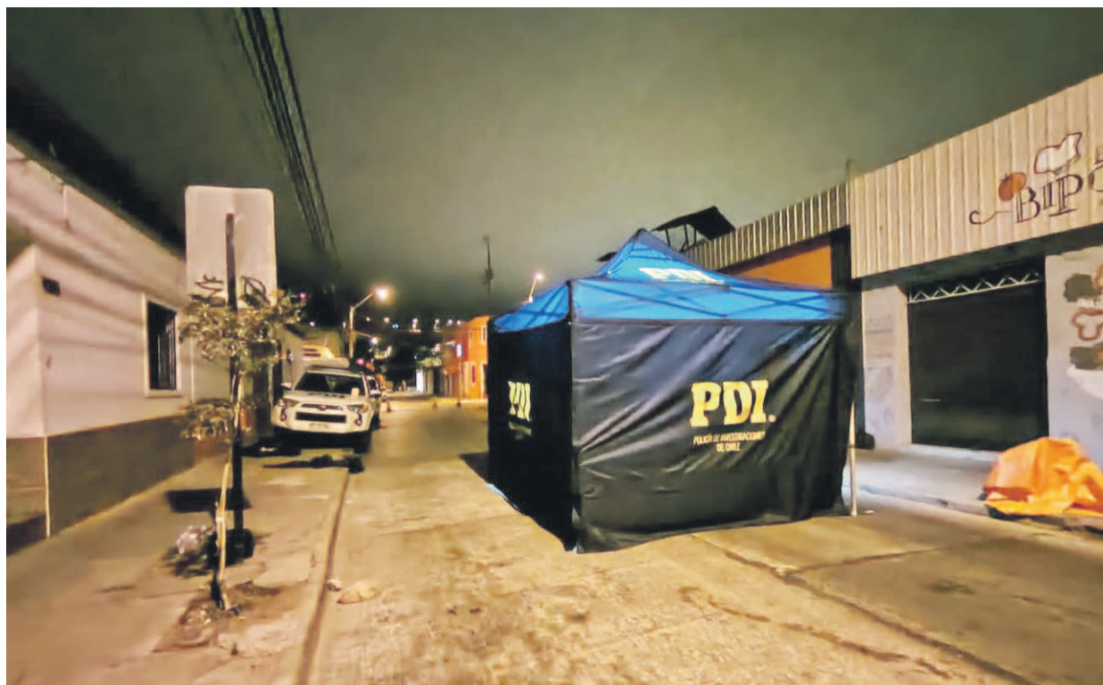
La Brigada de Homicidios llegó hasta la calle Tocopilla para investigar el homicidio de un hombre.

El crimen fue alertado por la central de cámaras de seguridad, al percatarse de un hombre herido en plena vía pública. "A eso de las 23:00 horas se activó un procedimiento por aviso de la central de cámaras municipales. Ellos se percataron de que una persona se había desvanecido al medio de la calzada. Carabineros y SAMU concurren al lugar, constatando la muerte de esta persona, ante lo cual se realizó la denuncia. Al momento de entregar el procedimiento a la PDI no estaba identificado la identidad de la víctima, ya que no