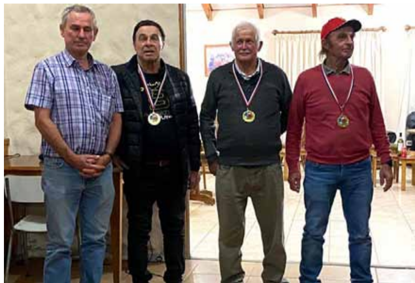
CLUB ITALO TRENTINO

Los jugadores del Club Italo Trentino se dieron cita durante dos meses en el bochódromo de La Serena hasta conocer a los campeones.