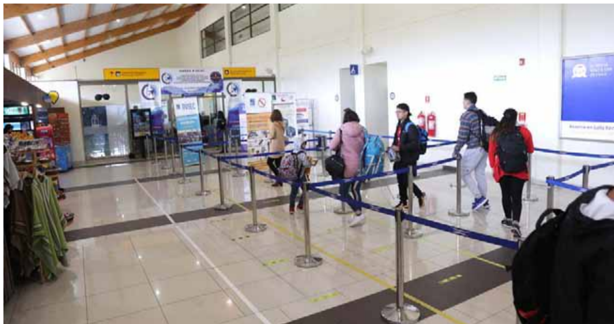
La Florida es el principal recinto aeroportuario de la Región de Coquimbo.

En los últimos meses, Diario El Día ha dado cuenta de una realidad que cada cierto tiempo se repite: la demora en el despegue de aviones a causa de, por ejemplo, las malas condiciones climáticas, todo lo cual hace perder conexiones con otros vuelos y compromisos laborales o familiares, los que perjudican directamente a los pasajeros.