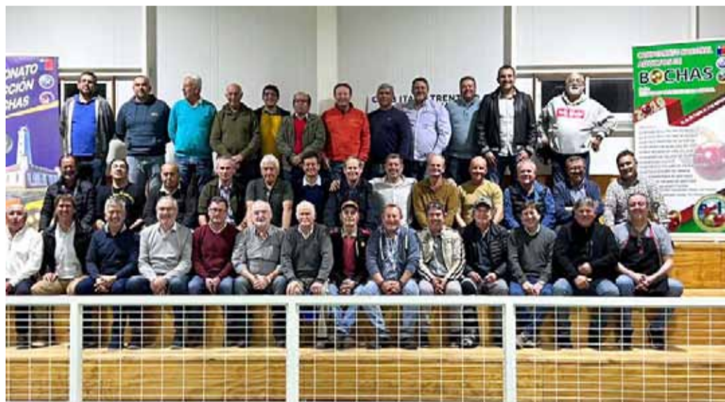
CLUB ITALO TRENTINO

También hay quienes postulan al portero Claudio Bravo, e incluso a los históricos goleadores Marcelo Salas o Iván Zamorano, pero sin duda la discusión no está acabada y, con el correr de los años, irán apareciendo nuevos matices e impresiones.