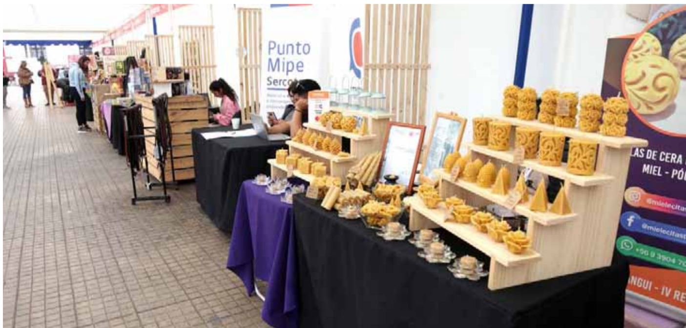
Las pequeñas y medianas empresas para muchos expertos, son el motor de la economía chilena.

“Para evitar esto, deben evitar tres errores comunes. Por una parte, buscar líneas de financiamiento sólo cuando su situación es mala, por cuanto no contar con un plan de ahorro para solucionar imprevistos representa uno de los mayores errores financieros que cometen. También se tiene que evitar mezclar finanzas personales con las del negocio. Bastantes veces pasa que sus dueños se pueden ver tentados a usar capital del negocio para fines personales, o para salvar sus emprendimientos utilizan su propio capital o piden créditos de consumo y, todo esto, sólo les desordena sus