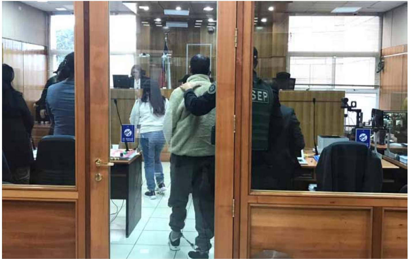
Esposado y de espaldas, se aprecia al acusado por violación y abuso sexual reiterado, de iniciales L.A.S.E.