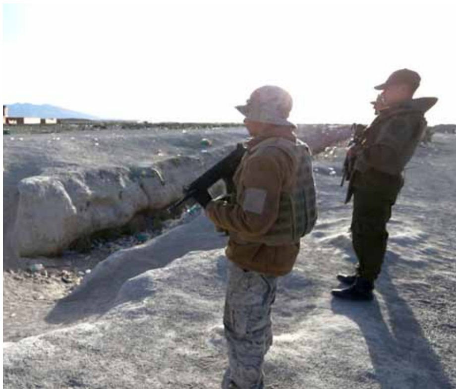
Desde febrero de este año, el Ejército se encuentra resguardando la frontera con Bolivia y Perú.