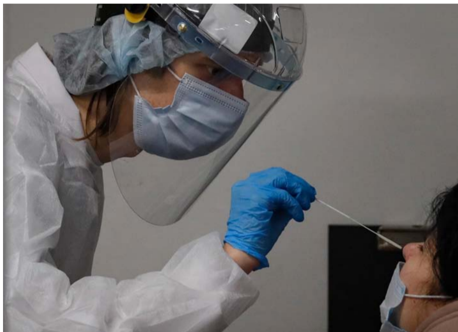
Esta información es de gran relevancia ya que, si bien la crisis sanitaria ya terminó, existen posibilidades que se desarrollen nuevas cepas.

En ese sentido, manifestó que los datos apoyan las medidas de utilizar una vacuna contra dos cepas. "Lo que nosotros hemos visto es que efectivamente lo que hizo el gobierno de tener esta vacuna bivalente para Ómicron es lo que hay que hacer".