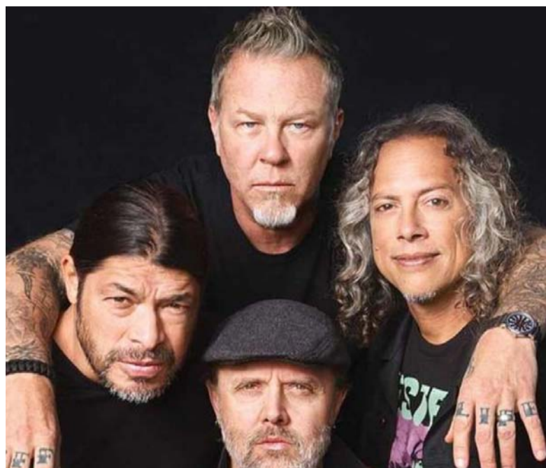
La banda de rock estadounidense originaria de Los Ángeles.