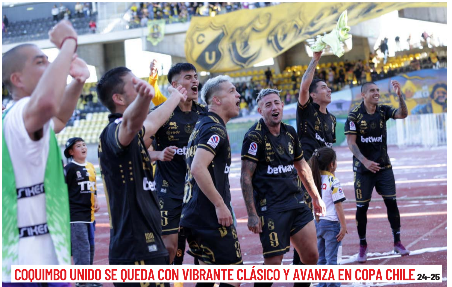
COQUIMBO UNIDO SE QUEDA CON VIBRANTE CLÁSICO Y AVANZA EN COPA CHILE 24-25

PREOCUPAN LAS MUERTES POR CÁNCER DE PULMÓN 5