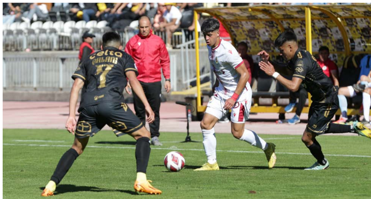
Piratas y papayeros no se sacaron ventajas durante los 90 minutos reglamentarios que finalizaron con el marcador igualado a 1.