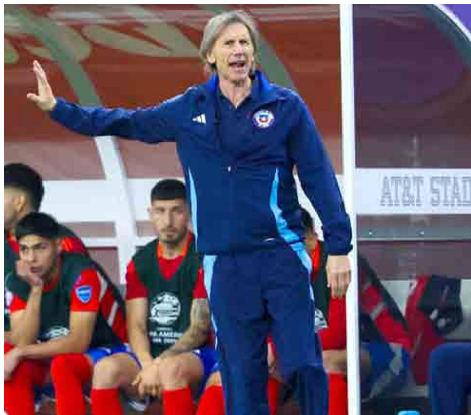
El técnico, Ricardo Gareca, afirmó que, más allá de lo especial que le resulta enfrentar a su país, sus esfuerzos están enfocados en la selección chilena.

Gareca señaló que no conoce al entrenador argentino, Lionel Scaloni, más allá de los saludos antes de