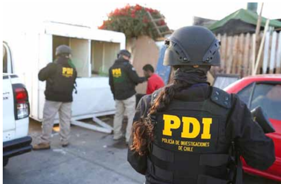
Los detectives de la PDI ubicaron y detuvieron a los padres prófugos en distintos domicilios de La Serena.

Los 7 deudores de pensiones alimenticias fueron ubicados y detenidos, en distintos domicilios de la comuna de La Serena, y sus deudas por estos compromisos impagos, van desde los $800 mil a más de $18 millones. En