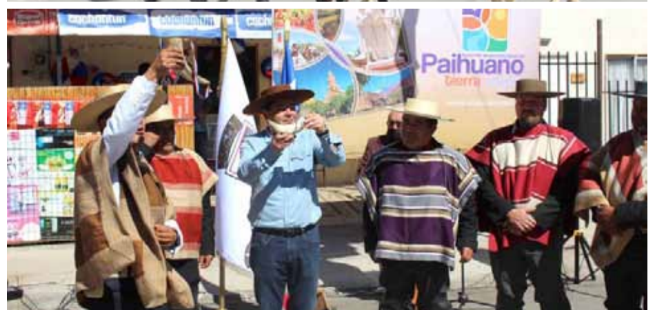
La festividad busca conservar las tradiciones y costumbres del Valle del Elqui.