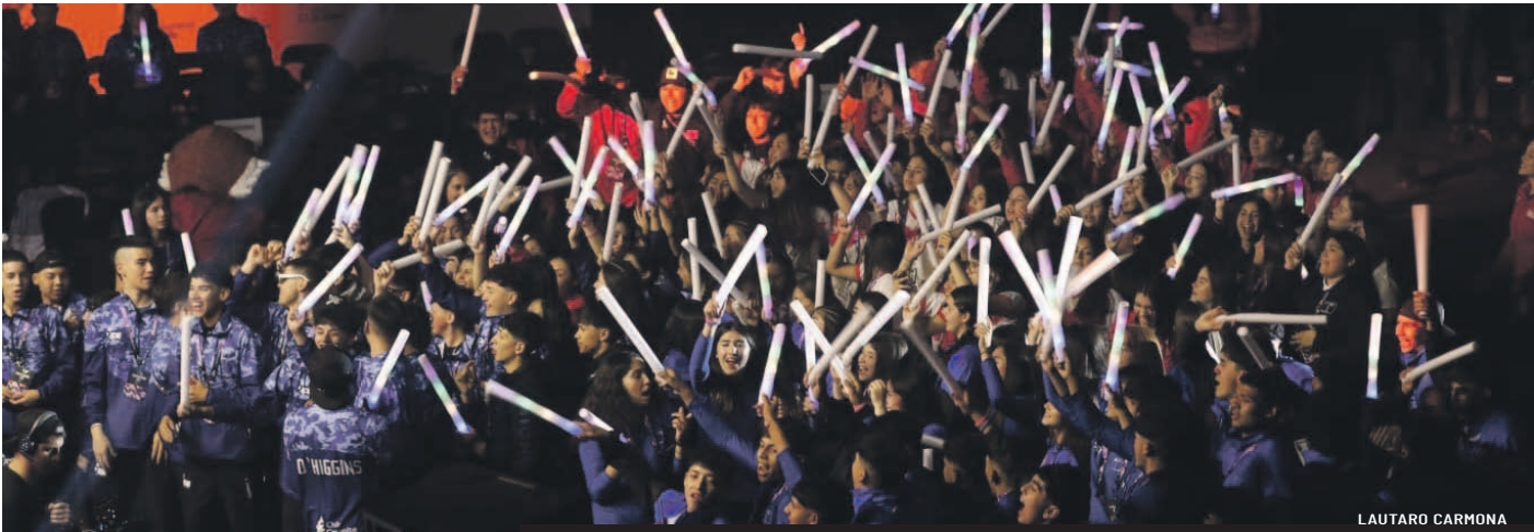
Coquimbo y La Serena son las anfitrionas de la fase final de vóleybol y básquetbol hasta el 29 próximo.