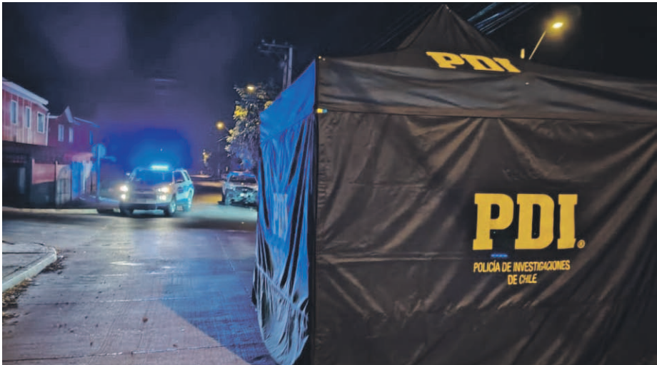
Desde la PDI se informó que el imputado también mantenía otro requerimiento judicial pendiente por el delito de acoso sexual, ocurrido el pasado 24 de junio.

Tras un intenso trabajo de análisis criminal e inteligencia policial, la Brigada de Homicidios de la PDI La Serena logró la detención de un hombre de 31 años, de nacionalidad chilena, imputado por el homicidio de otro sujeto de 43 años, ocurrido el pasado 29 de mayo en el sector de Las Compañías. La víctima perdió la