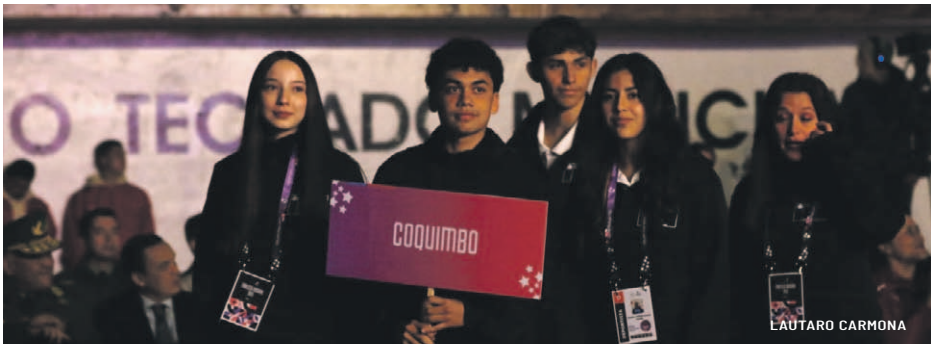
Las 16 delegaciones regionales desfilaron ante las autoridades y el público coquimbano en un ambiente de unidad y entusiasmo.