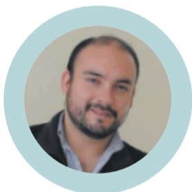
MARCELO PEREIRA alcalde de Coquimbo

"Los resultados de ambas auditorías serán compartidos con la comunidad y los diferentes medios de comunicación, permitiendo que la opinión pública se mantenga informada de hechos de interés general".