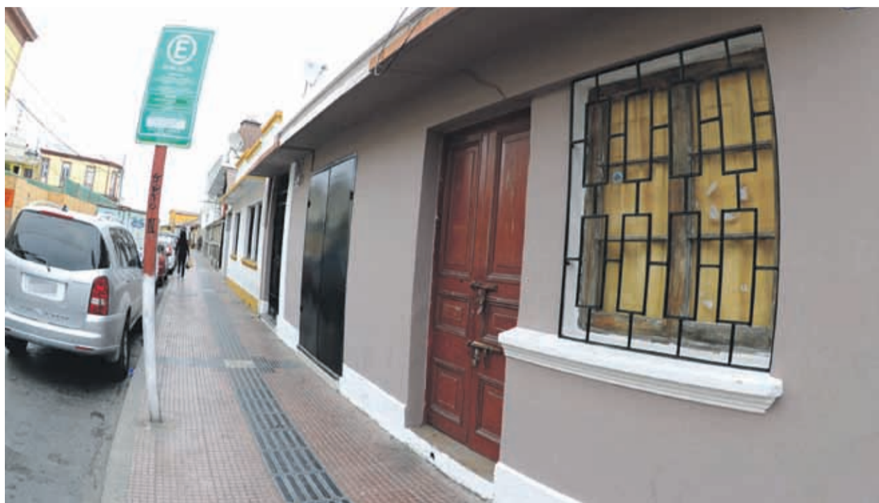
La casa ubicada en calle Vicuña 531 funcionaba como “after” clandestino cuando fue cerrada en enero.

Tal como comenta la mujer, a eso de las 7:30 horas del viernes 18 de enero Carabineros realizó un operativo en la casa a raíz de una denuncia anónima por ruidos molestos. En el lugar, los funcionarios verificaron la existencia de un local clandestino de venta de