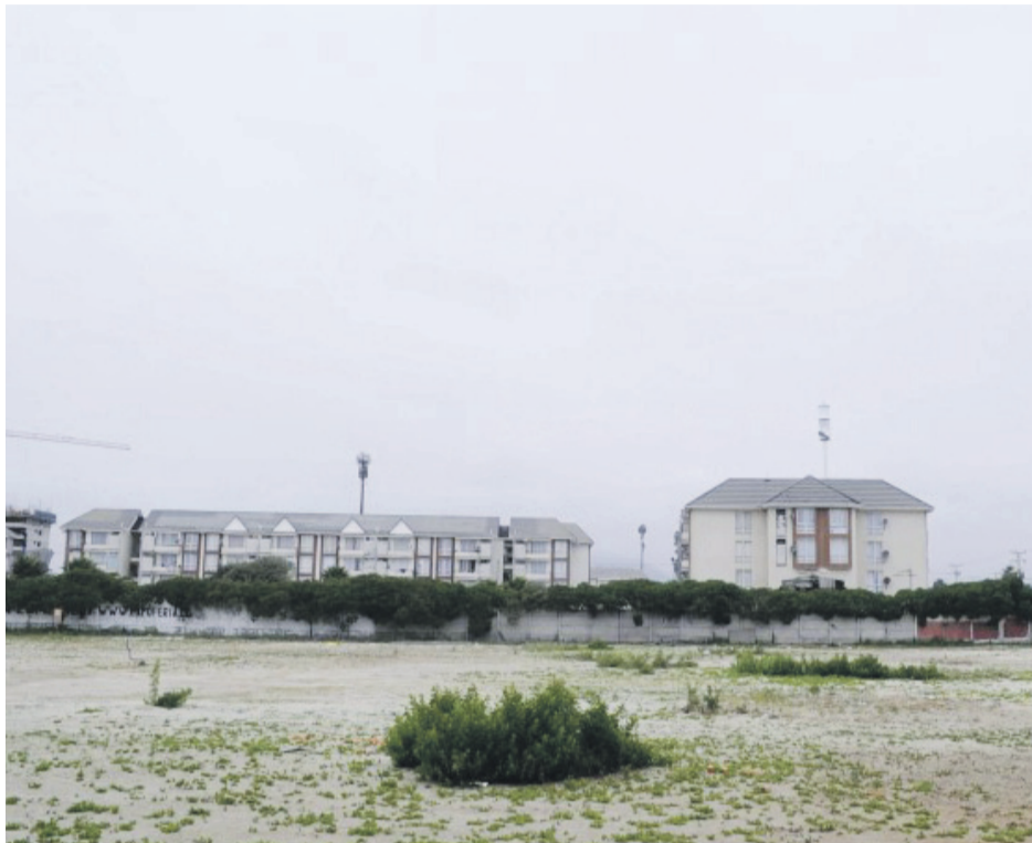
Actualmente, el terreno donde se ubicaría Ibis La Serena se encuentra eriazó. En abril iniciarían su construcción. ANDREA CANTILLANES

En tanto, hay que agregar que la cadena hotelera estaría ad portas de iniciar la