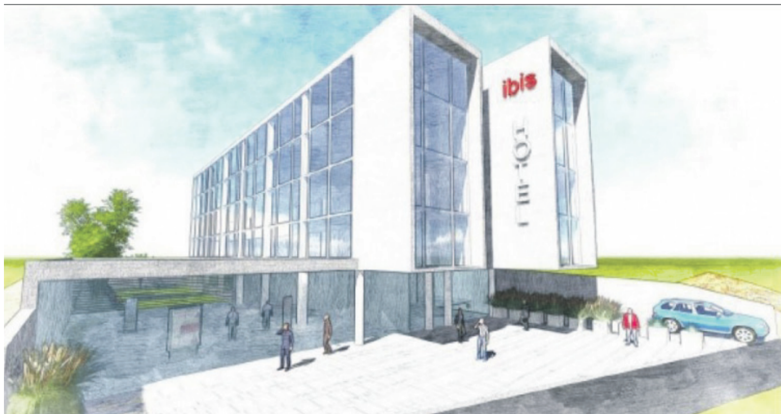
Así se vería Ibis La Serena, ubicado en Avenida El Santo, una vez terminado.

Casi un año de atraso presenta el proyecto, de acuerdo a los datos publicados por este mismo medio en noviembre de 2016, donde se consignaba que el hotel