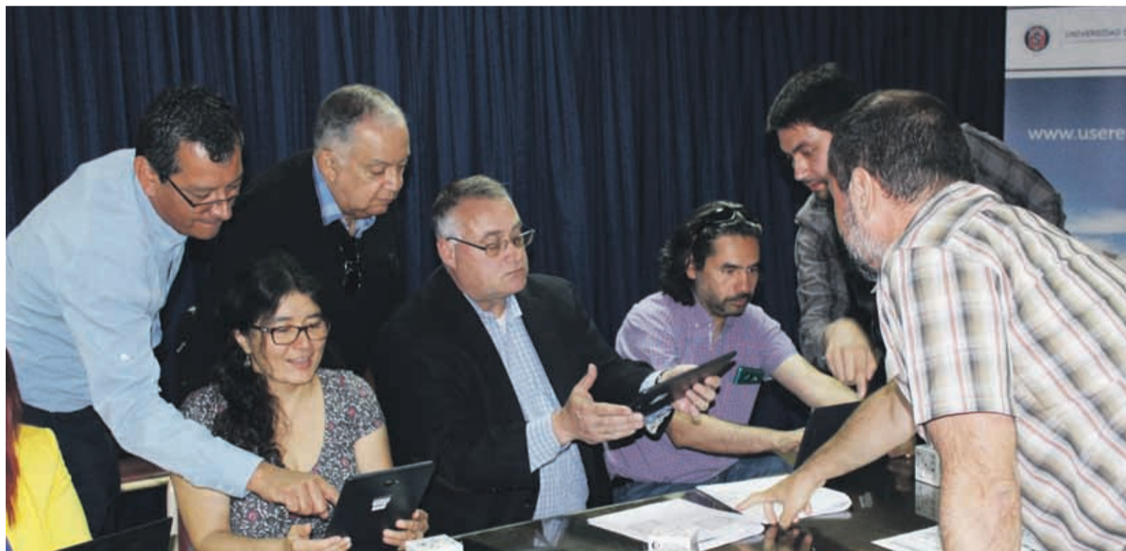
El reconocido académico estadounidense visitó el laboratorio de la ULS para conocer más sobre las aplicaciones móviles usadas en la enseñanza de áreas como la biología

muy buenas porque no sólo se aprenden ciencias desde un libro sino que ahora lo puedes hacer desde un teléfono, tablet, computador y hay mucho más acceso para poder desarrollar este conocimiento. Eso es algo que la NSTA está tomando en consideración y es muy importante para nosotros, la creación de las apps para mejorar la educación científica”, acotó.