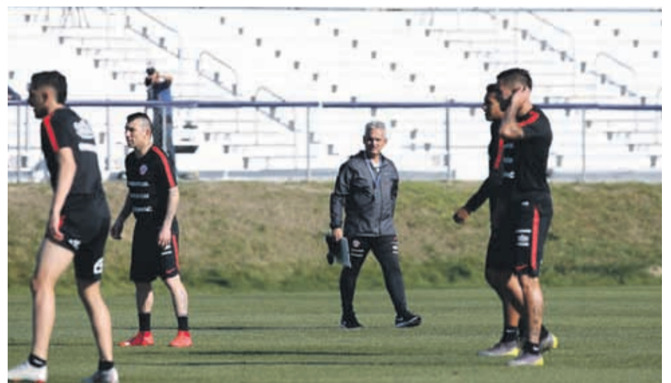
Los entrenamientos en la tierra del Tío Sam han dado luces del once que presentaría Rueda esta noche.

En la zaga, el retorno de Gonzalo Jara sería la gran novedad. El defensor de Estudiantes de La Plata ingresaría por Guillermo Maripán y acompañaría a Gary Medel