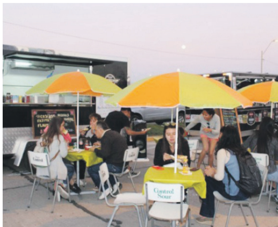
Trescientas 27 empresas se crearon en la Región de Coquimbo durante febrero.

Solicitar bases miércoles 27 de marzo 2019 de 9:00 a 18:00 horas al correo: licitaciones.sanmanuel@gmail.com