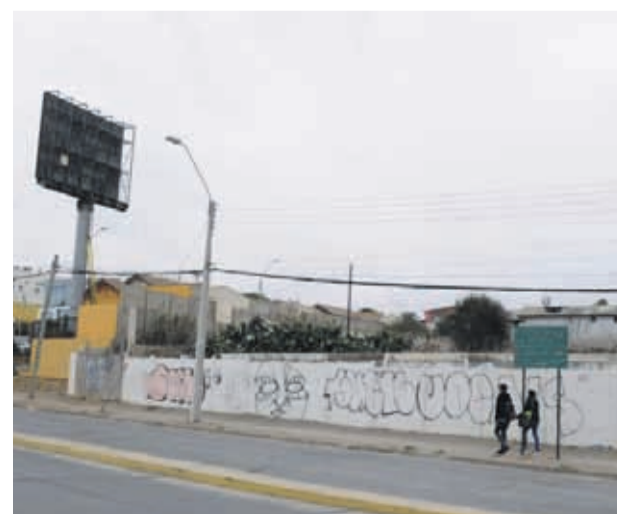
El sitio eriazó de Avenida Cuatro Esquinas con Avenida del Mar.