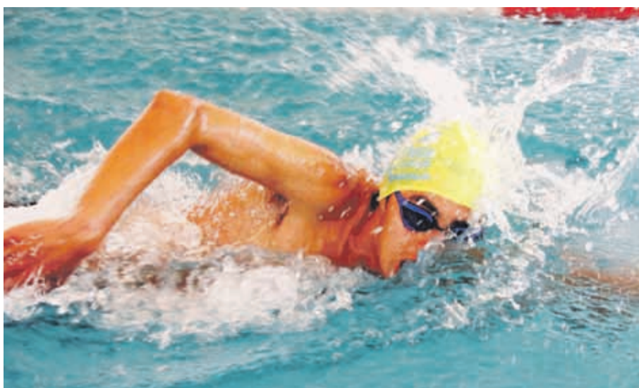
La natación fue una de las disciplinas que vivió su jornada de clasificaciones.