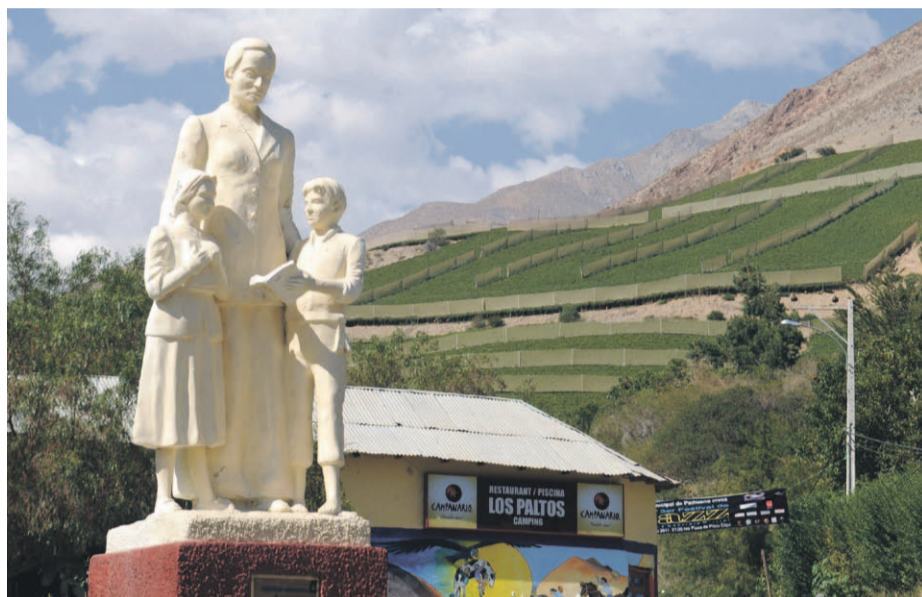
En el marco de la celebración de los 80 años del Premio Nobel, la idea de rebautizar la región ha tomado relevancia entre distintos sectores.