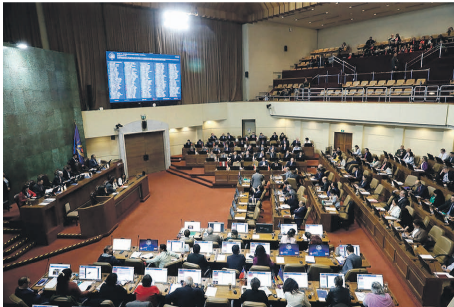
CÁMARA DE DIPUTADOS

En la región, dispararon en contra de parlamentarios de la UDI acusándolos que se alinearon con la izquierda y que abandonaron la sala para no votar la normativa. La respuesta de los diputados gremialistas fue dura y directa, calificando el proyecto como "malo" y que ni Kast fue capaz de sacarlo adelante.