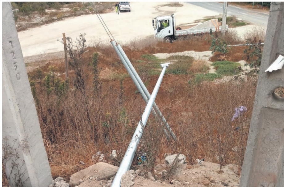
EL DÍA El robo de las recién instaladas luminarias en la ruta D-41 es una de las principales denuncias que han efectuado los pobladores de las localidades aledañas a la carretera.

Robos de luminarias, falta de patrullajes y accidentes viales impulsan la protesta, ante la cual, las autoridades prometen reforzar la presencia policial y otras soluciones integrales.