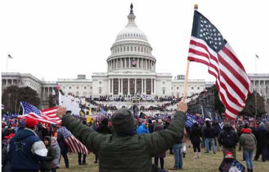
Fue el 6 de enero de 2021, cuando miles de seguidores de Trump intentaron tomar el edificio del Capitolio, en Washington DC.

Se trata hasta ahora, de una de las condenas más duras que un tribunal estadounidense ha dictado contra un imputado por el ataque al congreso de ese país, ocurrido a comienzos de enero de 2021.