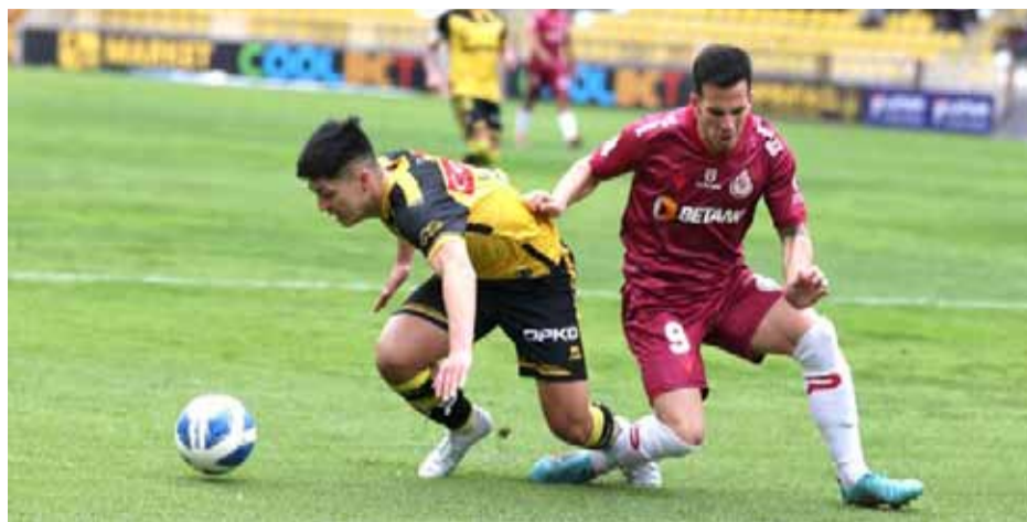
Granates y aurinegros volverán a verse las caras por Copa Chile en un mes más.