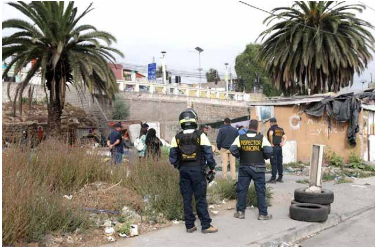
Concejales esperan información y resultados del plan "Calles sin Violencia".