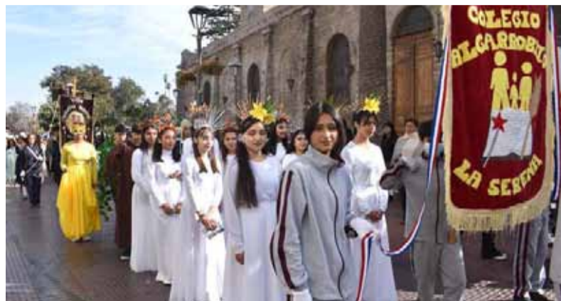
Las alumnas del Colegio Algarrobito rescataron el patrimonio natural de la vegetación que se da en el desierto.