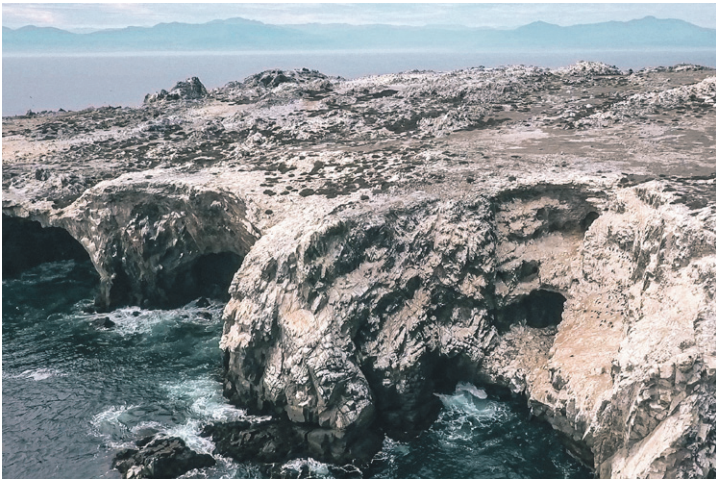
La instancia, además, busca visibilizar la ciencia que se desarrolla en estos sitios.