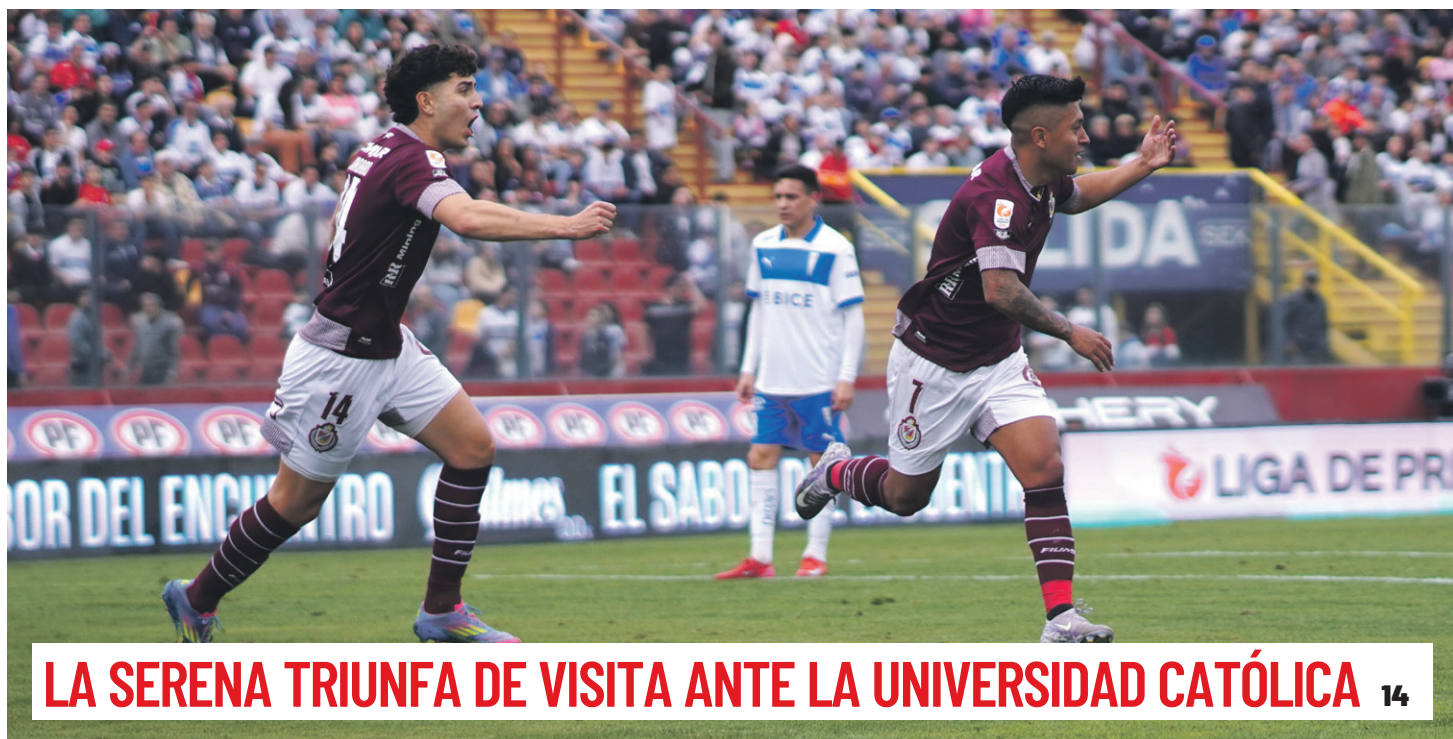
LA SERENA TRIUNFA DE VISITA ANTE LA UNIVERSIDAD CATÓLICA 14

OBSERVATORIOS OBTIENEN SU CERTIFICACIÓN STARLIGHT 8