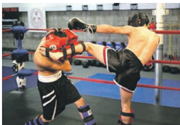
El kick boxing es una disciplina que ha crecido en los últimos años y que ahora busca proyectarse en Guanaqueros y Tongoy.

Bajo la organización de la escuela de kick boxing, Team Boyd Chile y del gimnasio Playfit-Tongoy, la idea de quienes