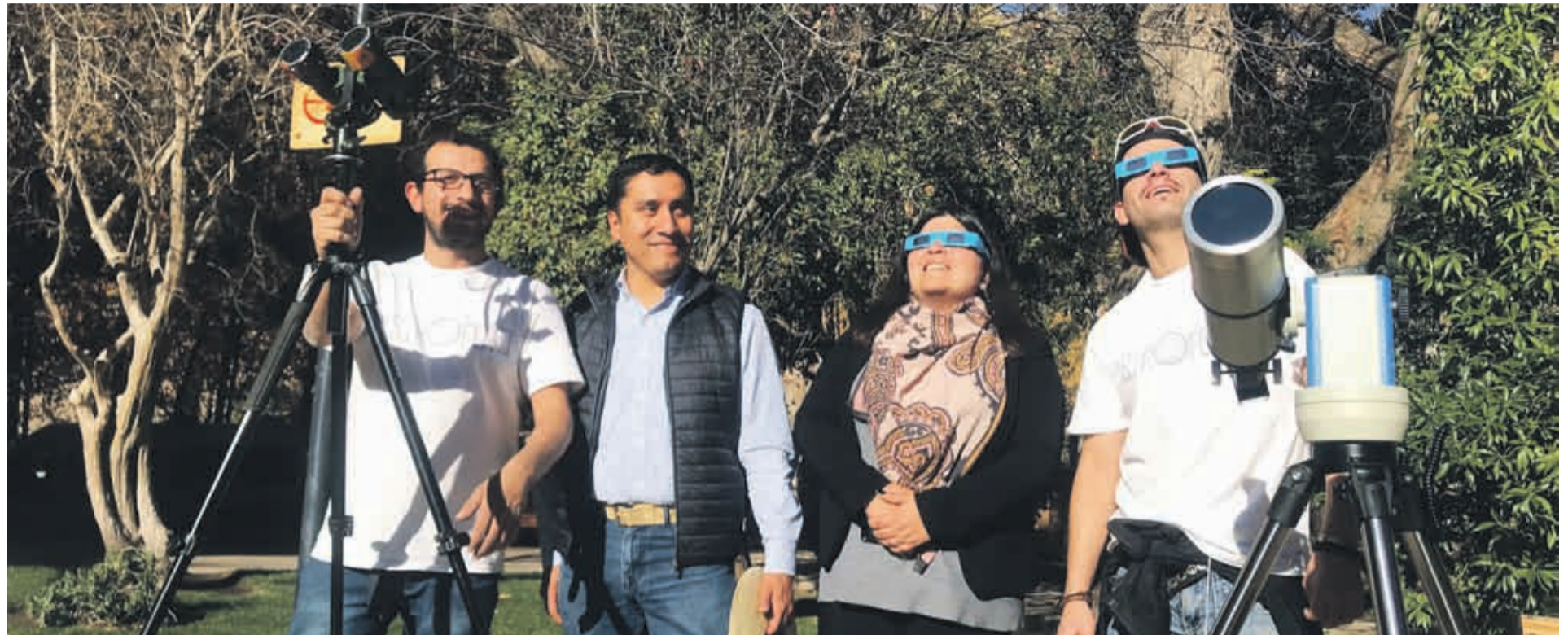
En Combarbalá ofrecerán guía y observación del eclipse desde parcelas privadas.