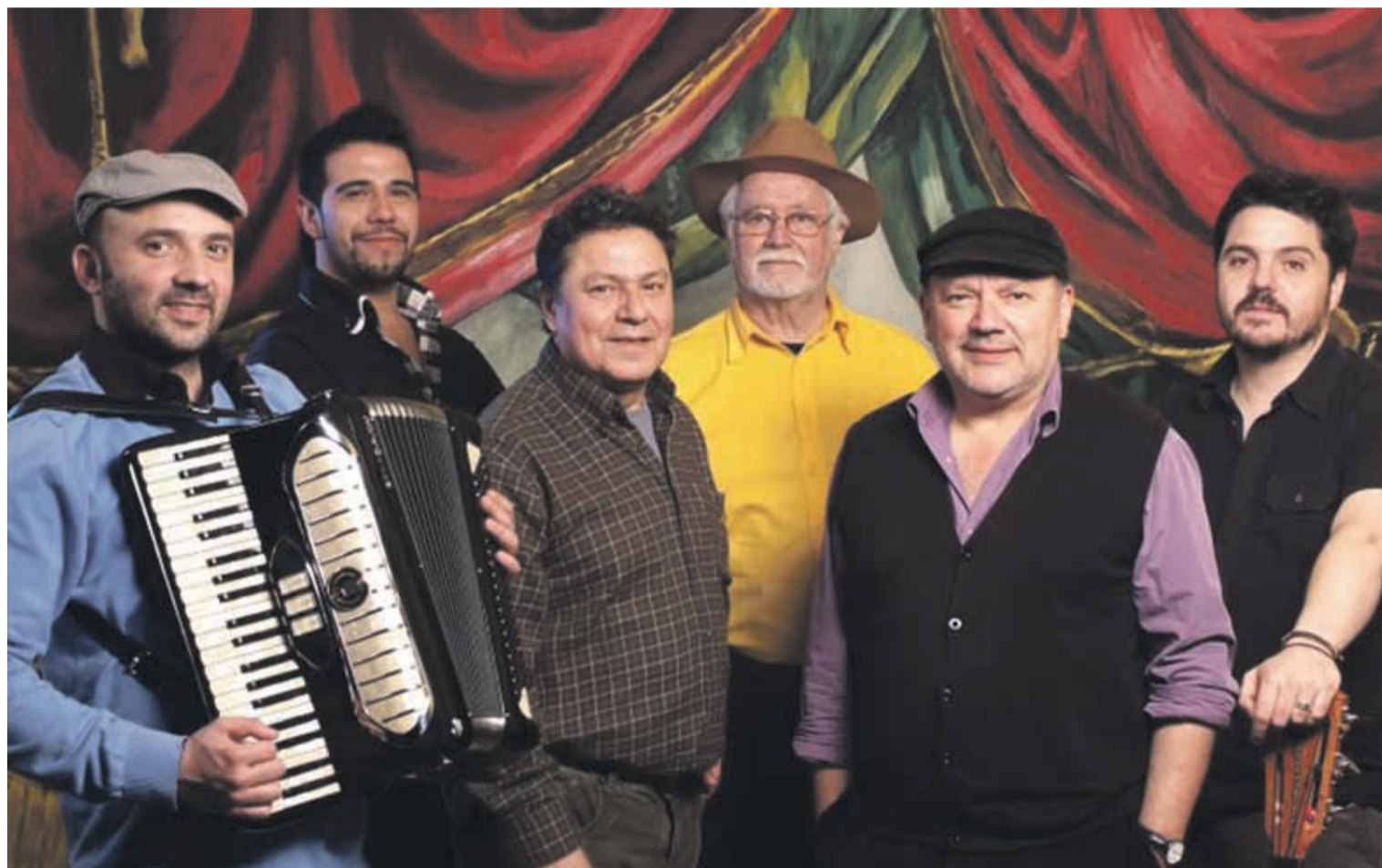
Serán cuatro días de actividades para todos los gustos, desde cocina local hasta tributos de rock.

Las actividades comenzarán este sábado 29 de junio, a partir de las 14:00 hrs, con un boulevard y una feria de emprendedores, mientras que la música estará a cargo de las agrupaciones locales como Jack Napiers, Banda Hesper, y de la banda Resist Tributo a Pink Floyd. Junto a las actividades musicales también se contará con show de magia, circo y malabares, además la charla “Los Eclipses y el nacimiento de la nueva era”, a cargo del conocido periodista, escritor, conferencista y doctor en