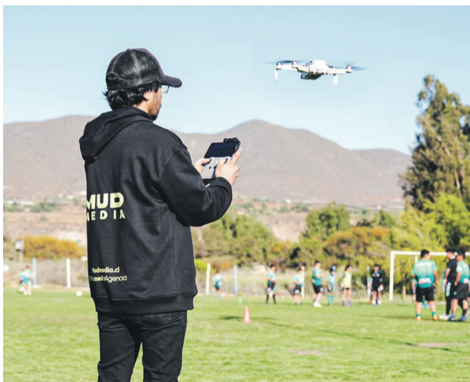
En la elaboración del video participaron todas las ramas del club.

El material audiovisual fue filmado durante meses e incluye la participación de todas las ramas del club, además de los hinchas que frecuentemente asisten al estadio. El estreno está pactado para las 18:00 horas de este viernes 27 de septiembre, a través del canal de YouTube del club.