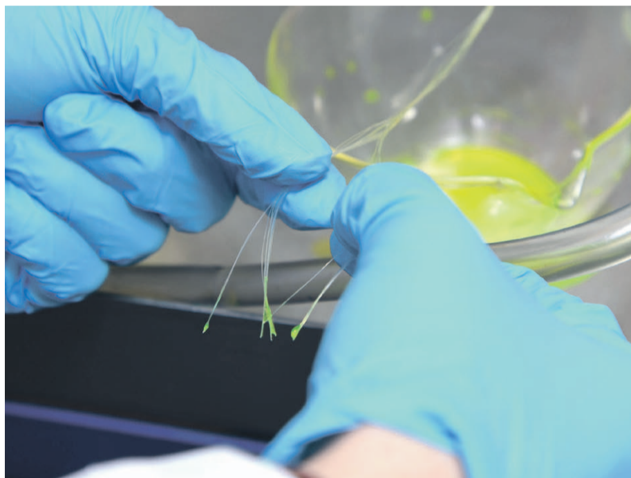
Imagen de una investigadora manipulando un haz de fibras especiales.

Científicos suizos han desarrollado fibras de núcleo líquido que pueden cargarse con casi cualquier tipo de medicamento y luego lo dispensan de manera local, precisa y controlada solo donde lo necesita el cuerpo. Darán lugar a una nueva generación de productos médicos textiles con capacidades especiales, aseguran.