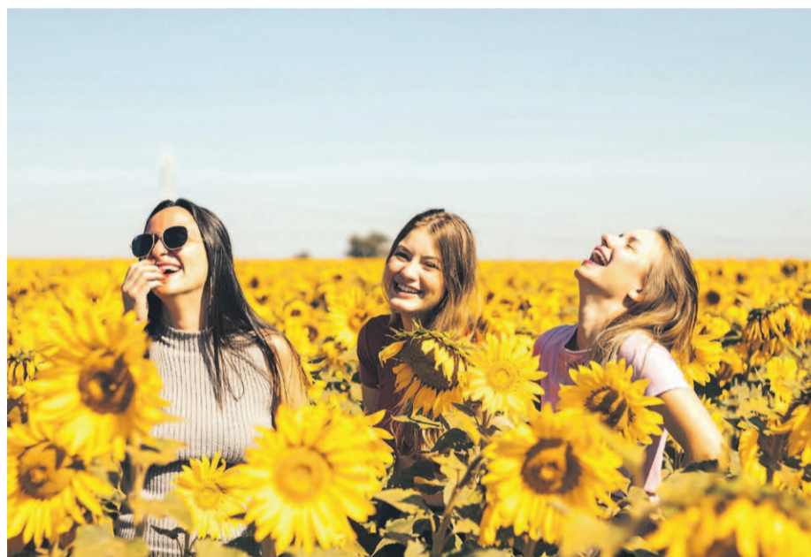
La alegría no sólo se expresa, sino que se vive en nuestro interior.

Los seres humanos tenemos una alegría natural que surge del hecho de estar vivos y mantenemos guardada en nuestro interior, pero a veces no encontramos la llave para liberarla, según una especialista en crecimiento personal que ofrece algunas claves para despertar nuestra fuente innata de bienestar.