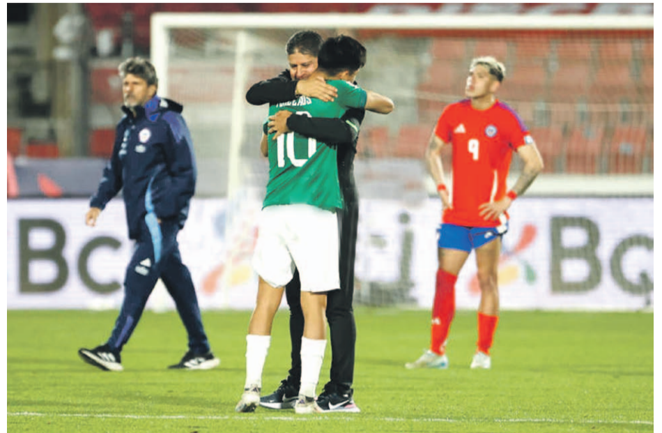
En el último partido, Chile cayó de local ante la selección boliviana.