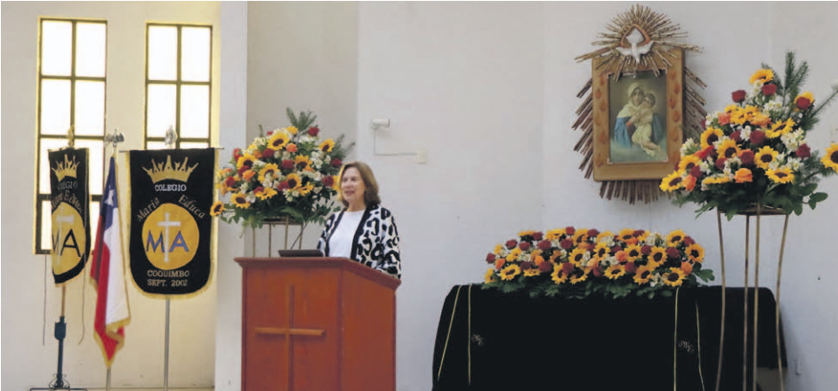
Mariana Aylwin durante la charla en el Santuario Tabor de Peñuelas.

En el marco de la conmemoración de los 25 años de la Fundación María Educa, los equipos de sus colegios participaron en la charla magistral “Respuestas de la fe a los quiebres y crisis de la educación actual”, impartida por Mariana Aylwin Oyarzún, docente, consultora y ex ministra de Educación. Tras la charla, la fundación reconoció a miembros destacados de las comunidades educativas de los colegios de La Serena y Coquimbo, por su compromiso, entrega y espíritu mariano.