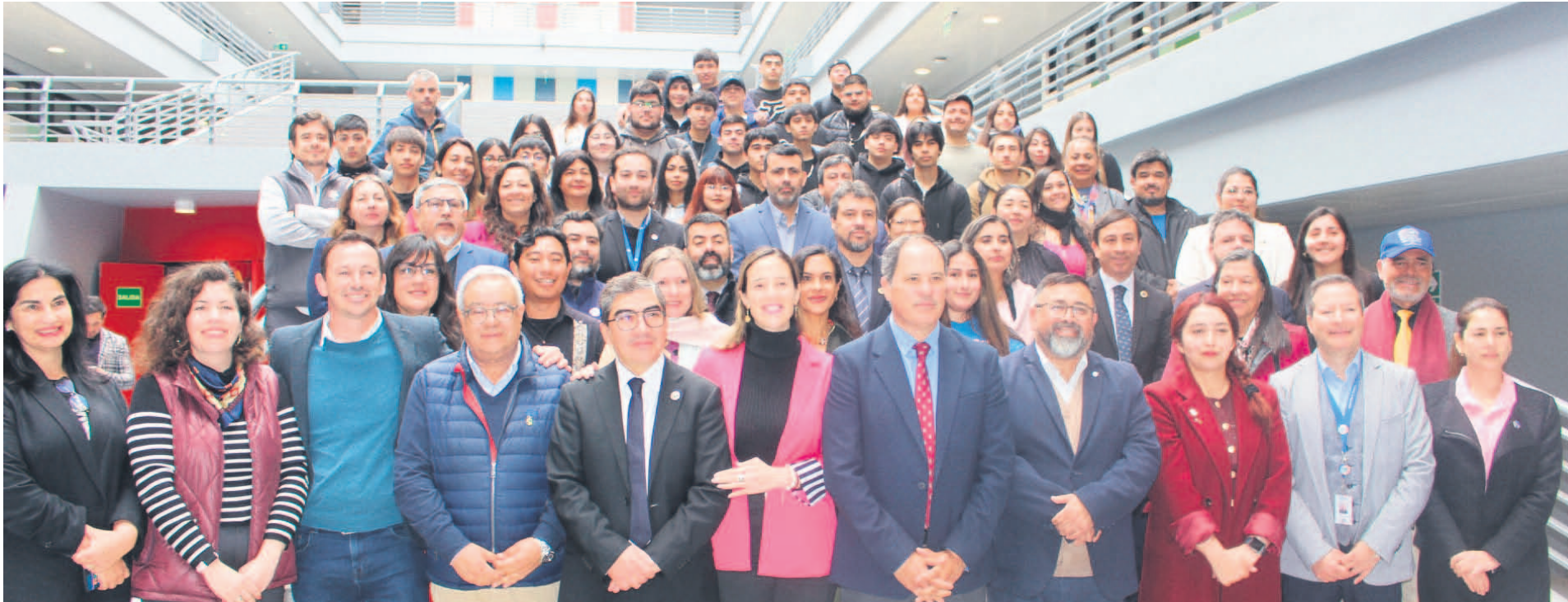
Asistentes a la ceremonia inaugural de la Feria Laboral “Conecta tu Futuro”.