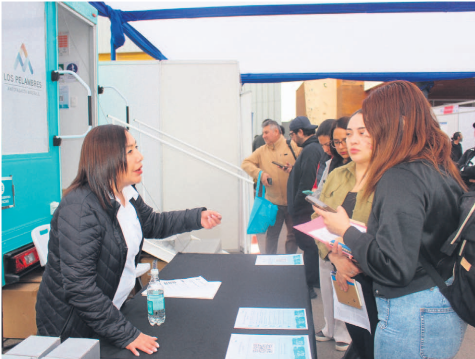
Público asistente a stands de la Segunda Feria Laboral “Conecta tu Futuro”.