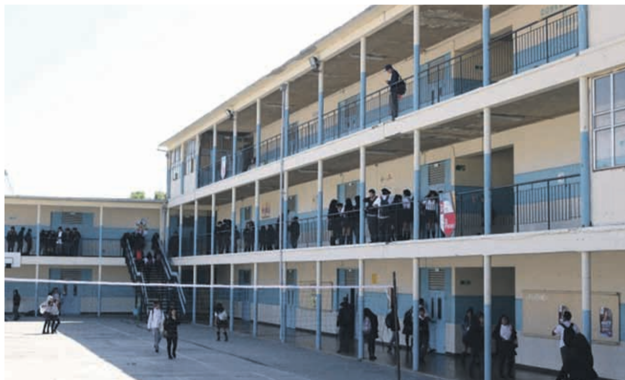
El liceo Diego Portales tiene altos índices de vulnerabilidad y es el primer recinto de educación media de la comuna puerto que se integra al proyecto