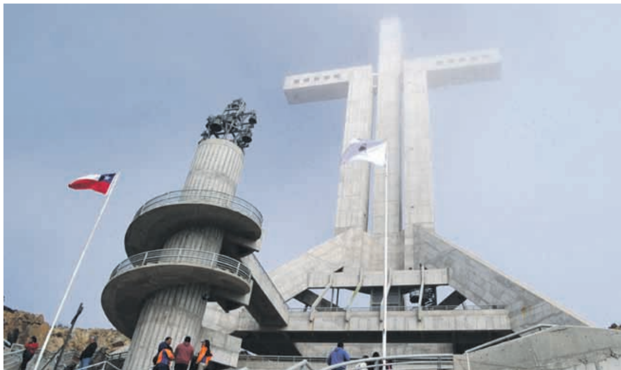
La situación en la Cruz comienza a ordenarse, pero siguen existiendo voces críticas.