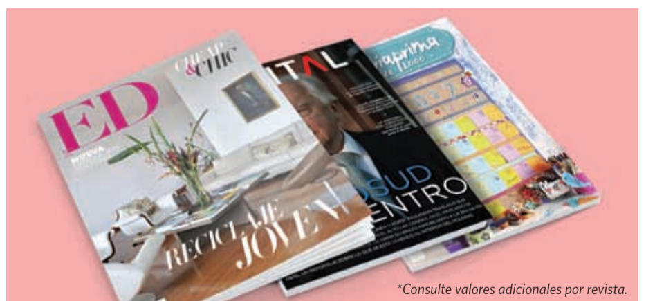
*Consulte valores adicionales por revista.