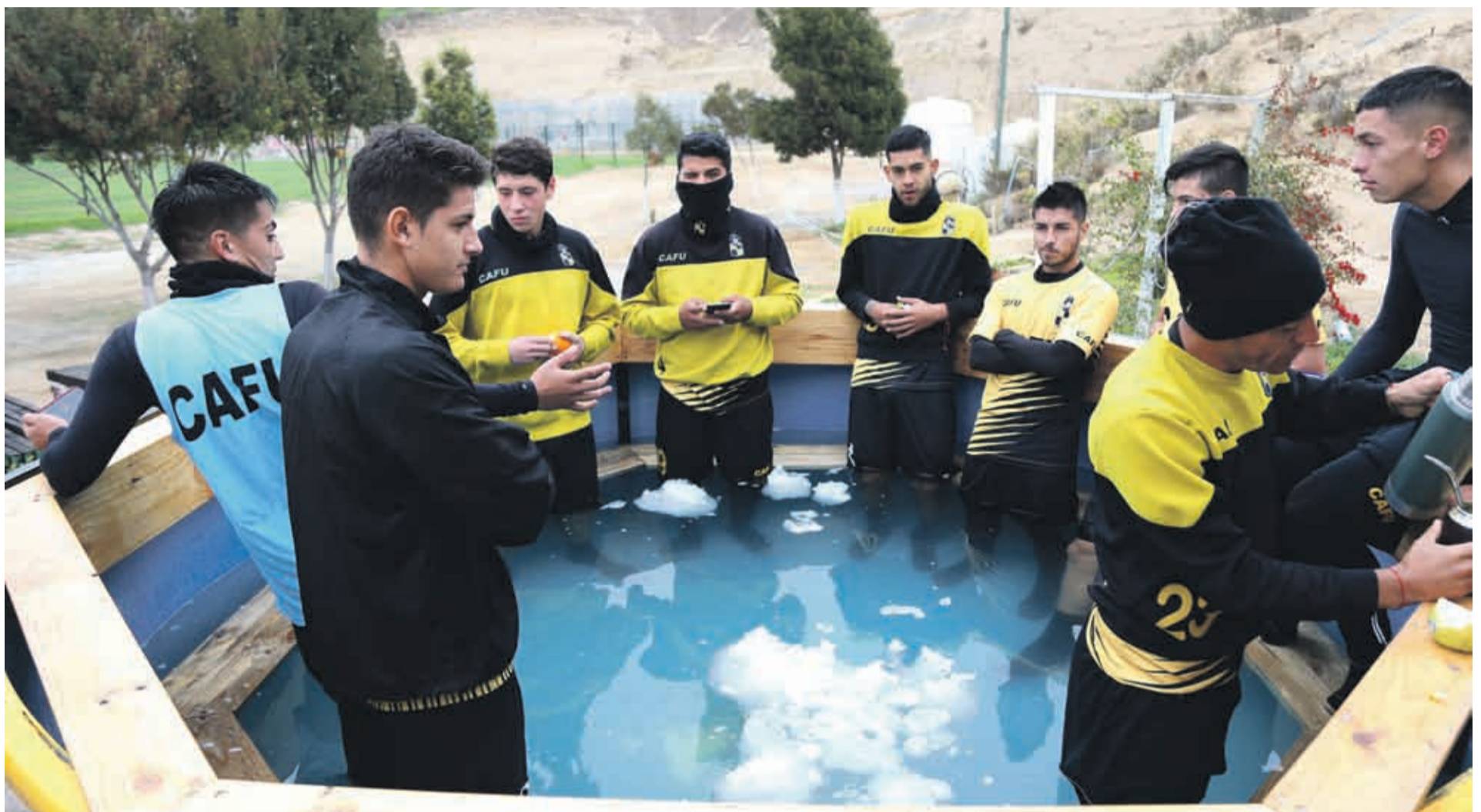
La crioterapia a la que son sometidos los jugadores de Coquimbo Unido todos los días, al término de cada práctica, hace que el frío actúe como una especie de analgésico, entregando múltiples beneficios. Ya están habituados a cerrar cada jornada de entrenamiento en esa cámara.

PARA ENFRENTAR A LOS ACEREROS POR LA SEXTA FECHA