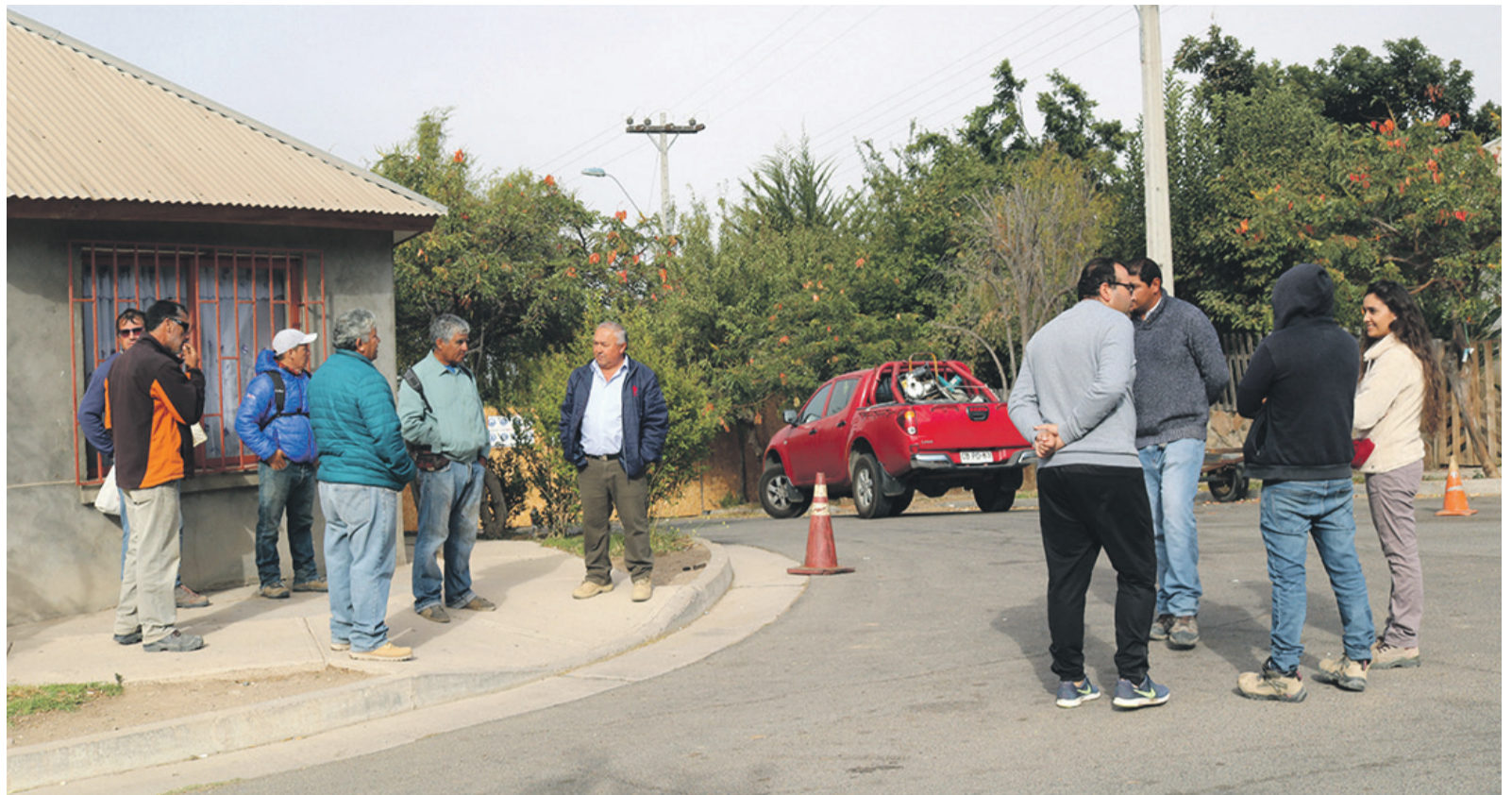
Trabajadores fuera de la obra mientras Labocar realizaba labores de peritaje al interior.